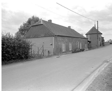
Vue générale. IVR22_19980202894X