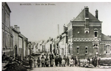
La rue de la Poste, chaussée Brunehaut, avec le nouveau bâtiment de Poste, à droite, vers 1905.