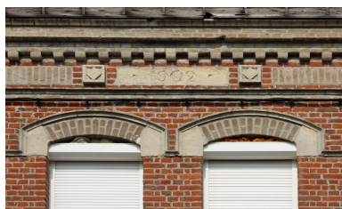
Détail du chronogramme : 1902.

IVR22_20098005823NUCA