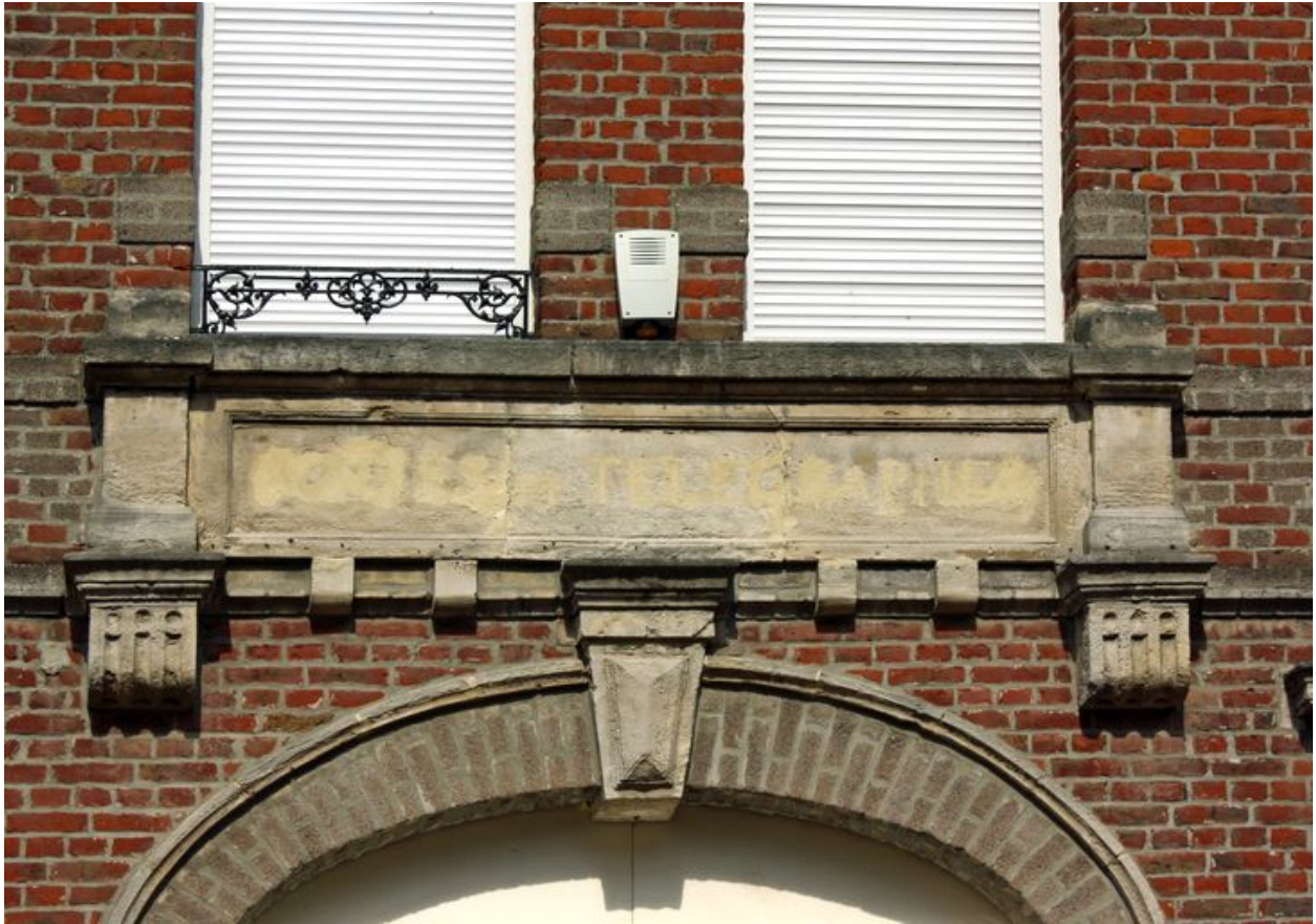
Ancienne poste. Inscription sur la façade : Poste et Télégraphes.