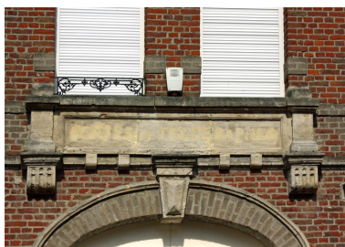
Ancienne poste. Inscription sur la façade : Poste et Télégraphes.

IVR22_20098005824NUCA