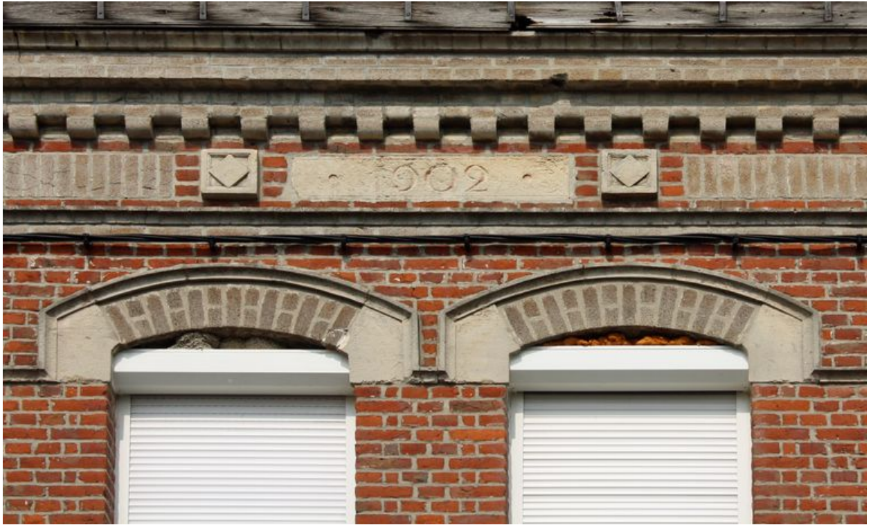
Détail du chronogramme : 1902.