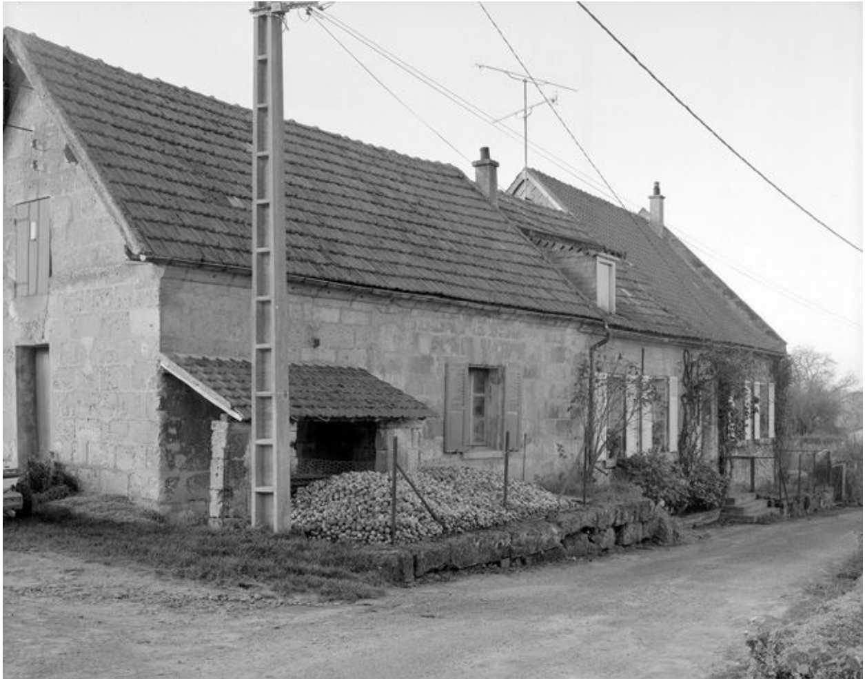
Logis. Vue générale.