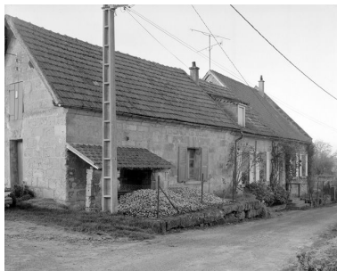
Logis. Vue générale. IVR22_19846001398V

Plan de situation. Extrait du plan cadastral de 1982, section A3 533. IVR22_20096000063NUCA