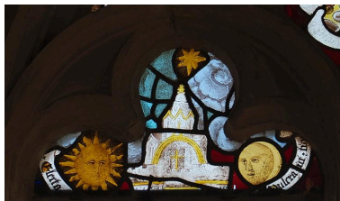
Vue de détail : le soleil, la Civitas Dei (?), l'étoile et la lune (tête de lancette gauche).