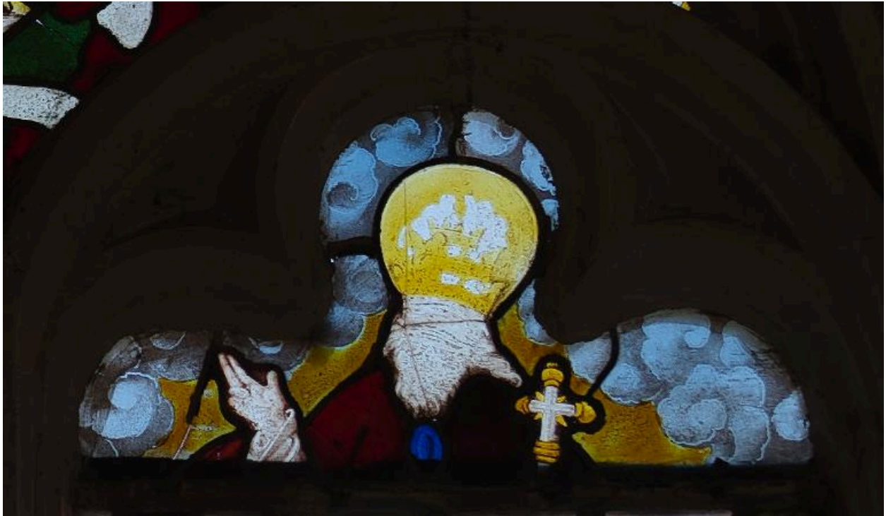
Vue de détail : Dieu le Père bénissant (tête de lancette droite).