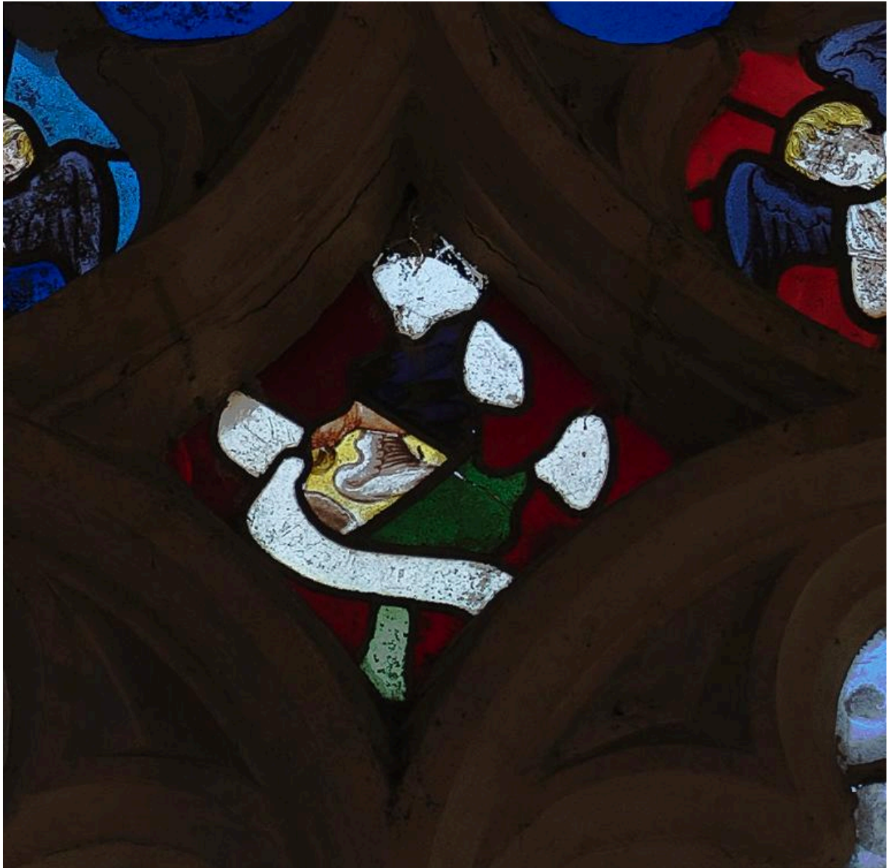
Vue de détail : le lys (tympan).