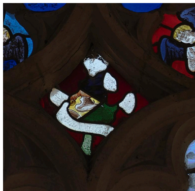
Vue de détail : le lys (tympan). IVR22_20148000733NUC2A