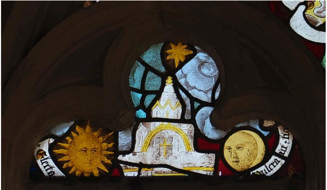
Vue de détail : le soleil, la Civitas Dei (?), l'étoile et la lune (tête de lancette gauche).