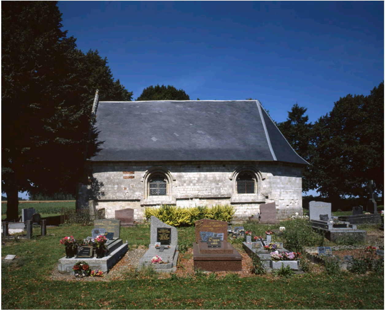
Vue depuis le sud.