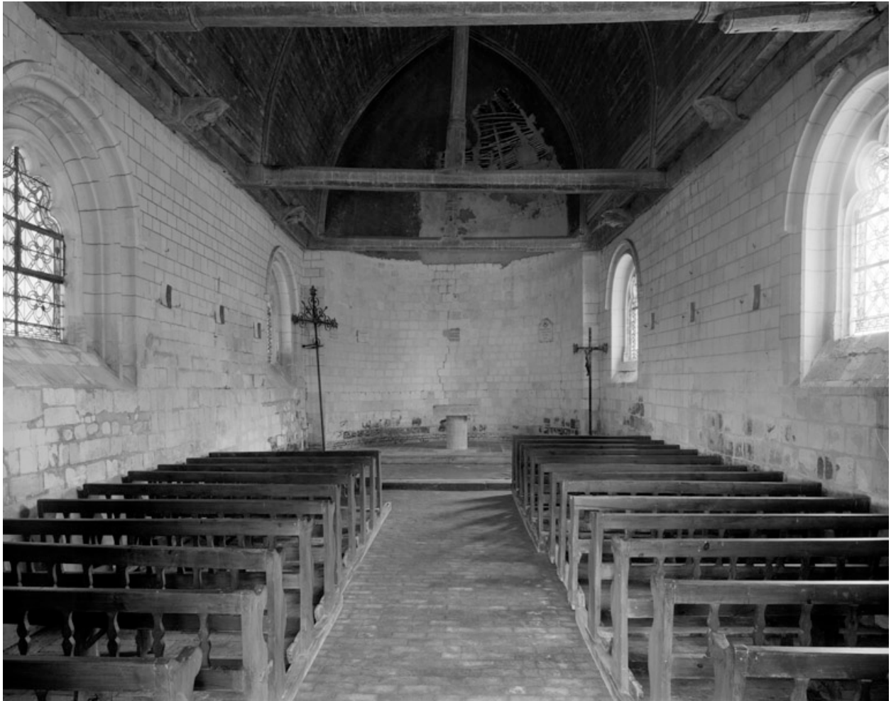
Vue intérieure, vers le chœur.