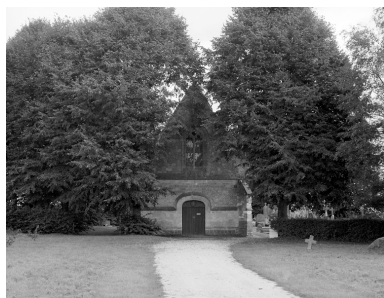
Vue générale. IVR22_20008000681X