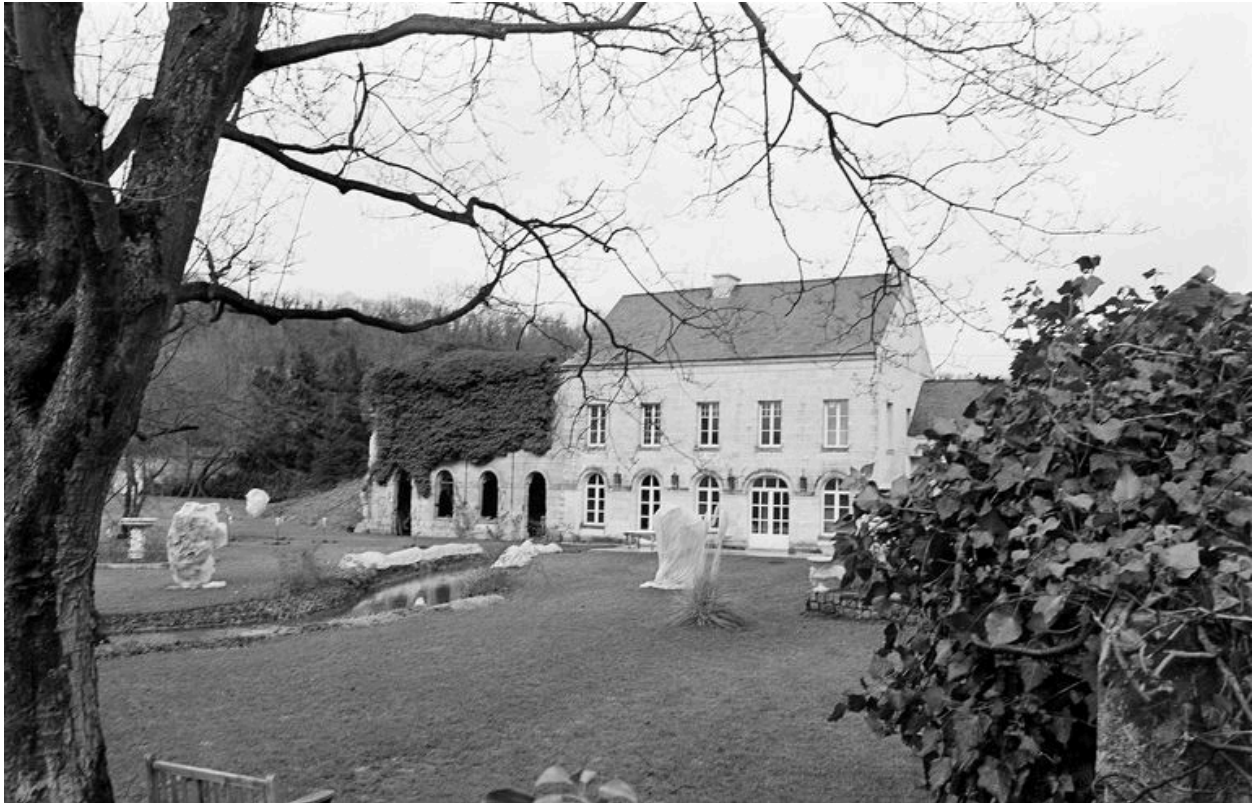
Atelier de fabrication, bâtiment d'eau et logement patronal, façade sud.