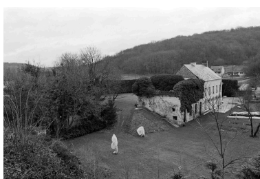
Vue générale. IVR22_19936002475Z