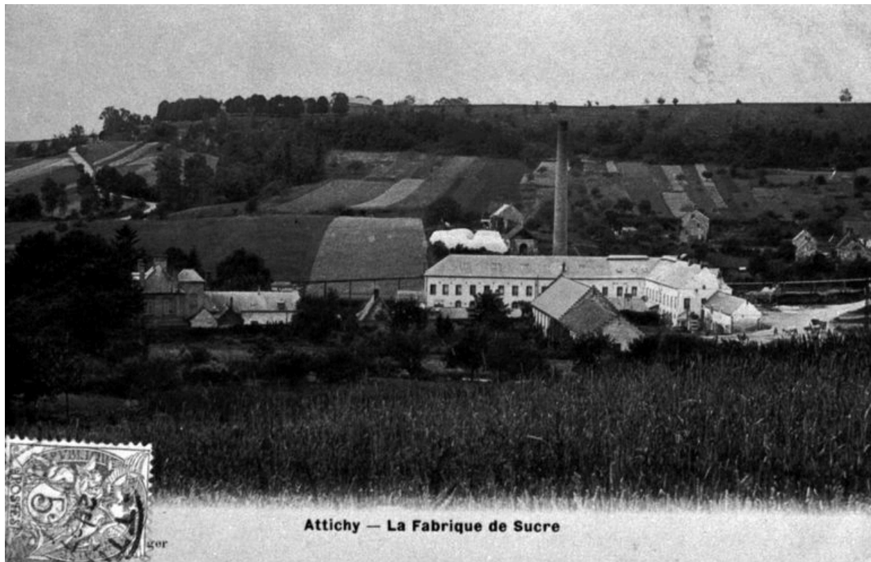
Attichy — La Fabrique de Sucre

Vue générale de la sucrerie, vers 1900 (AP).