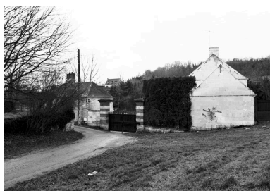
Vue générale de l'entrée de l'usine, avec la conciergerie et le bureau.