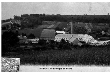
Vue générale de la sucrerie, vers 1900 (AP).