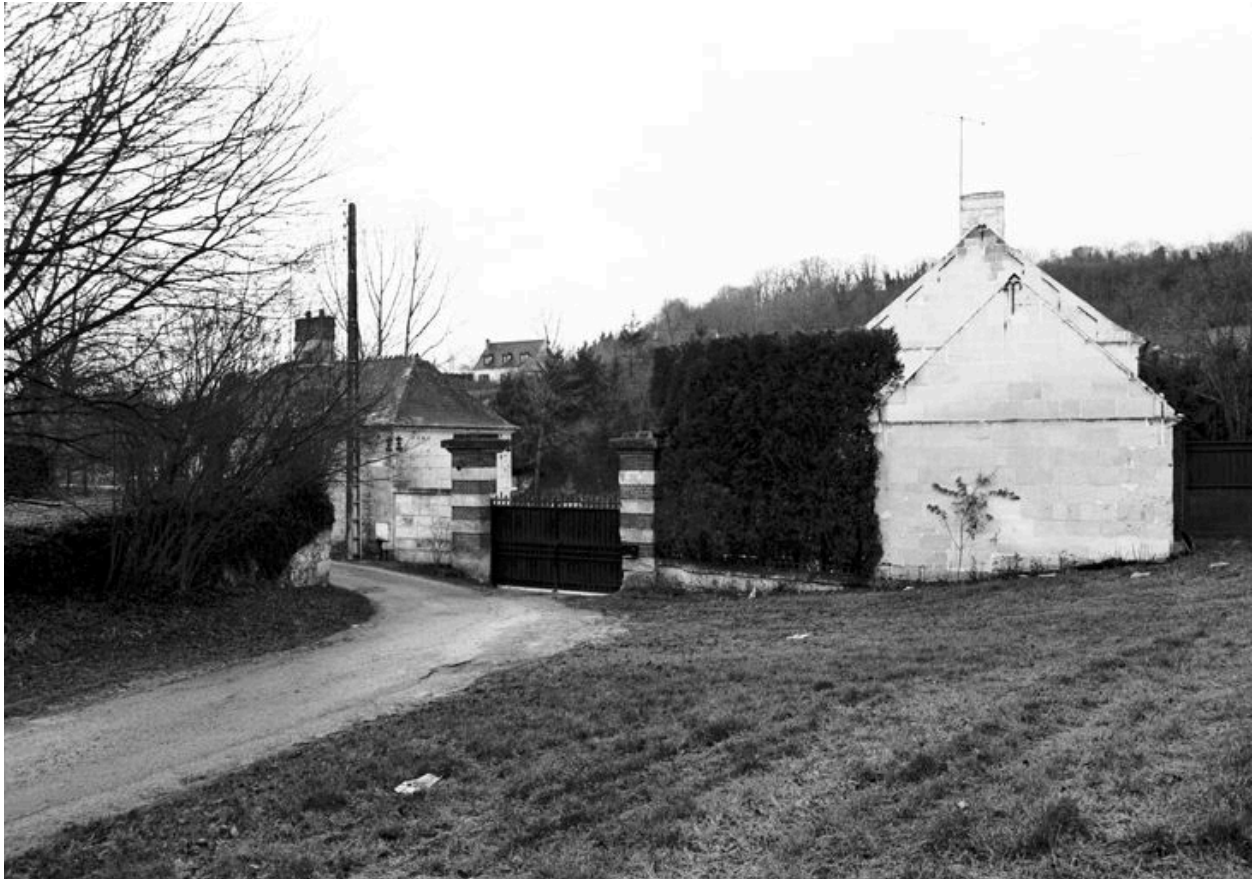
Vue générale de l'entrée de l'usine, avec la conciergerie et le bureau.