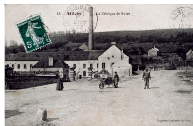
Vue générale de la sucrerie, vers 1900. IVR22_20106000154XA