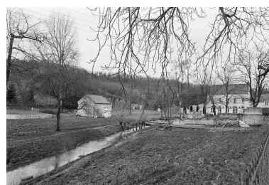
Vue générale sud. IVR22_19936002472Z