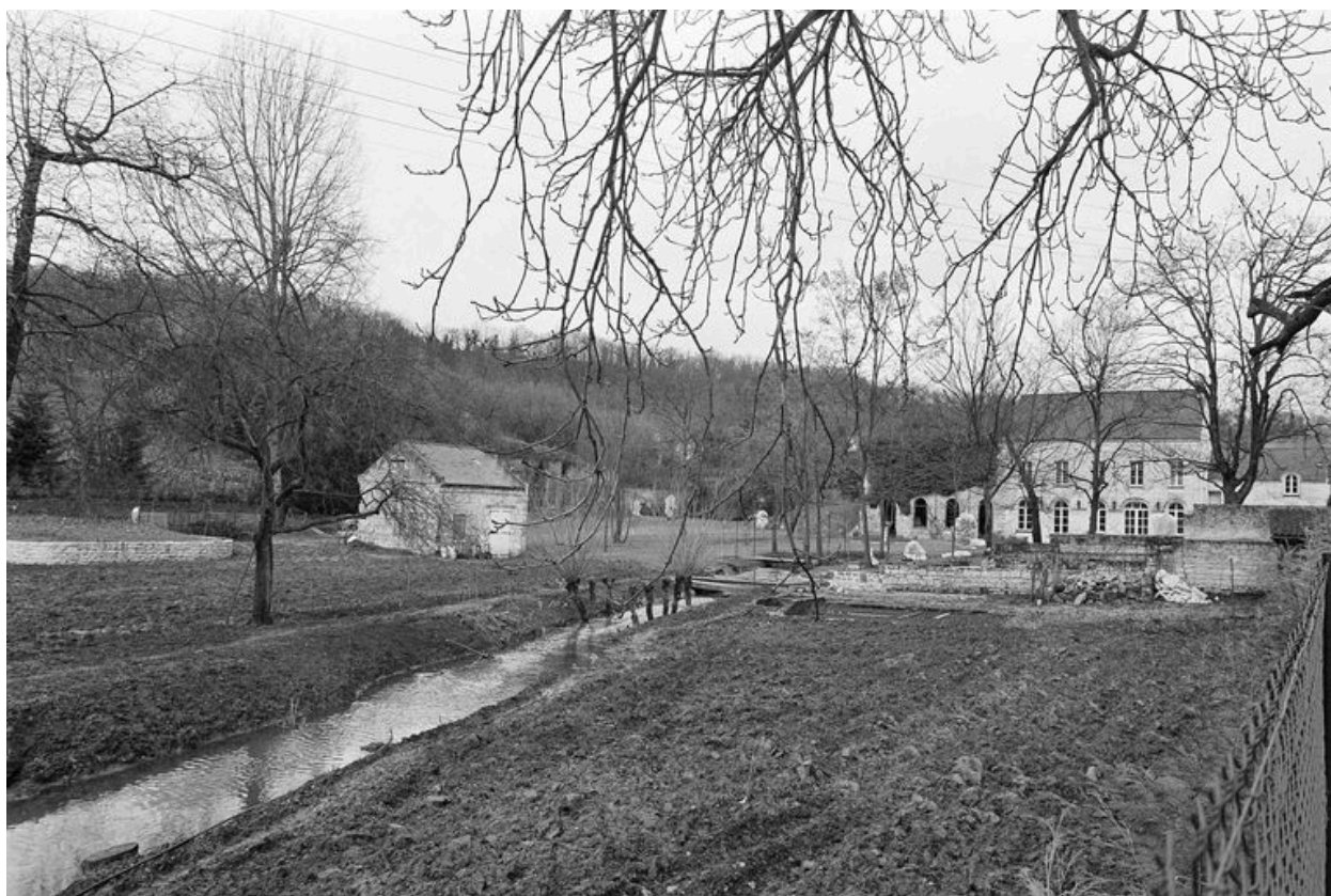
Vue générale sud.