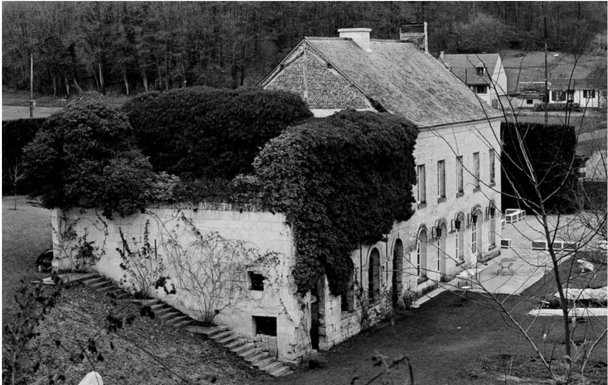
Atelier de fabrication, bâtiment d'eau et logement patronal.