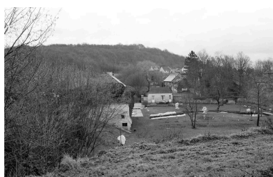
Vue de situation. IVR22_19936002476Z