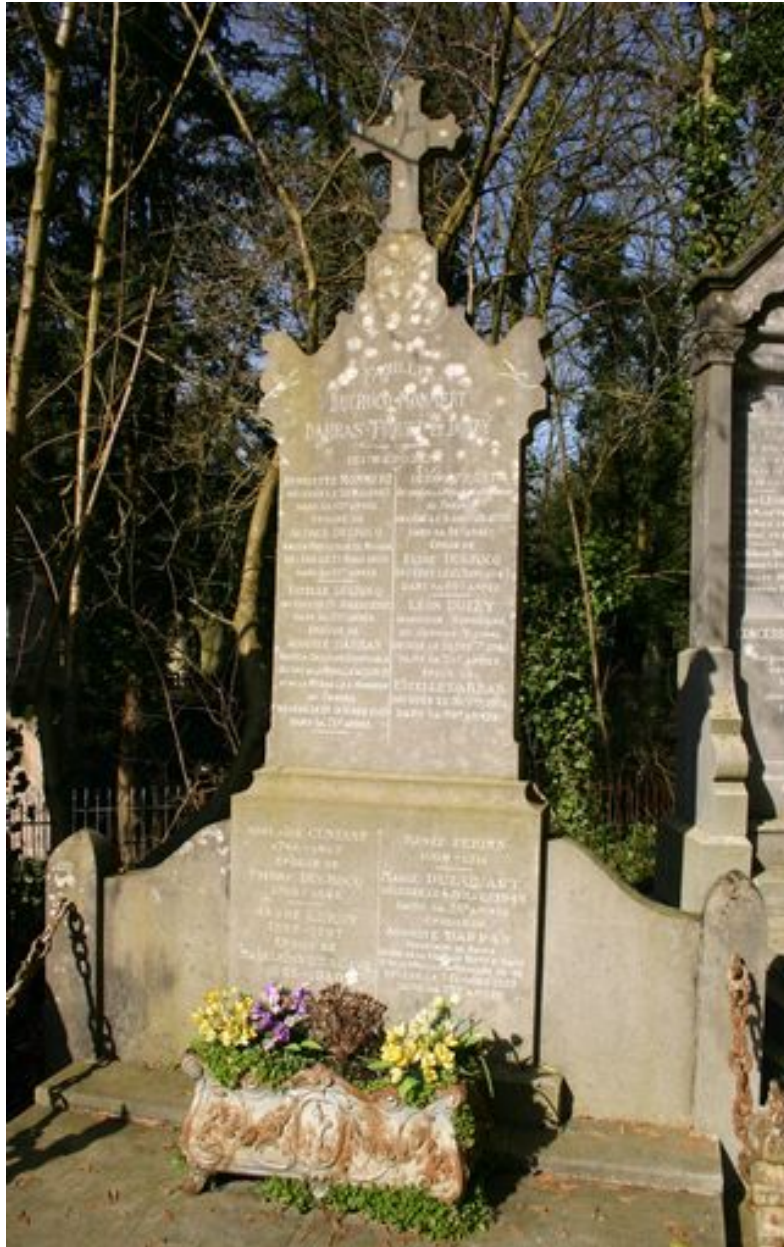
Stèle stylisée à acrotères.