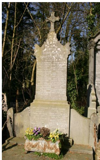
Stèle stylisée à acrotères.