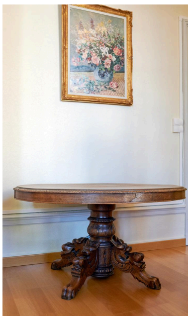
Table ronde avec piètement central provenant de l'ancienne bibliothèque.