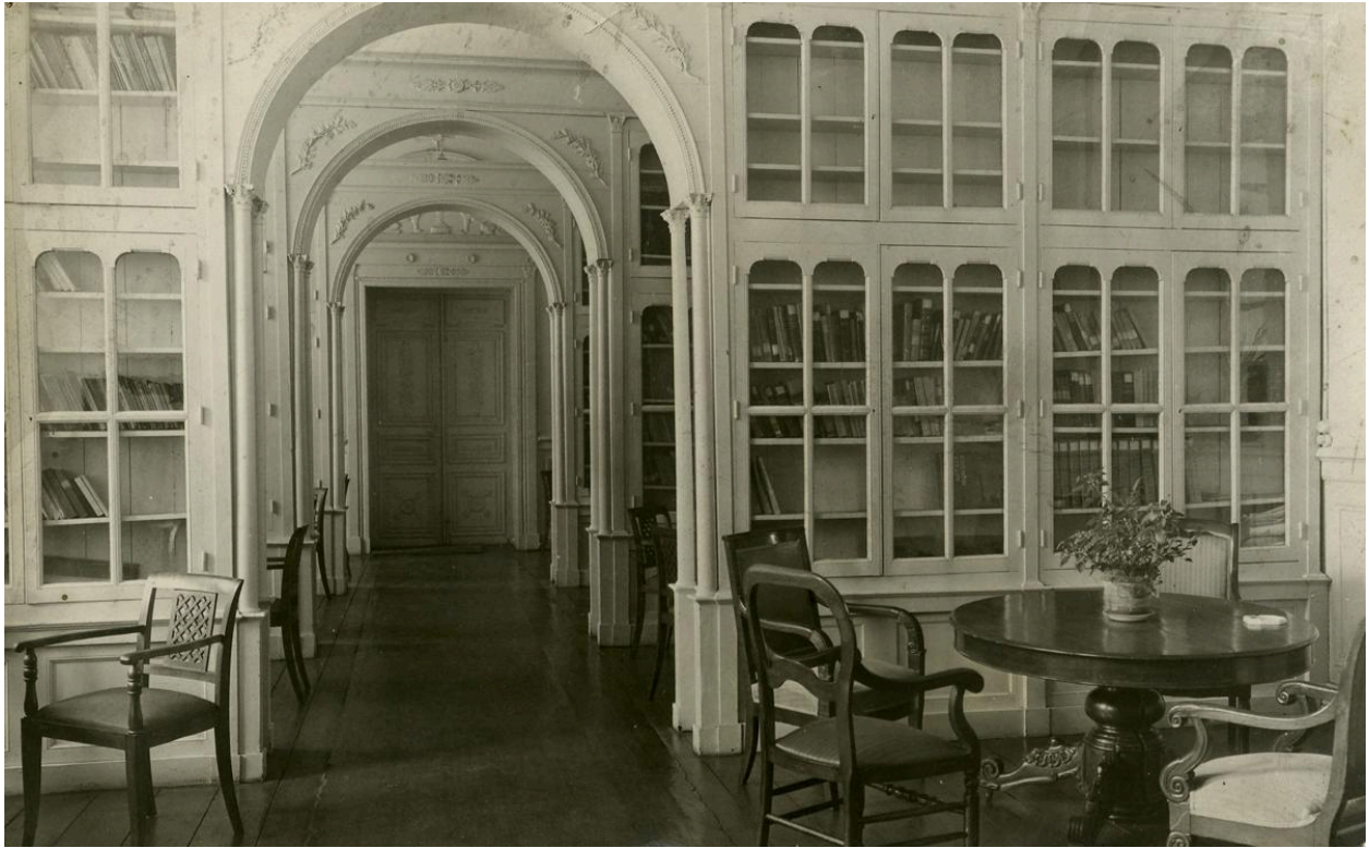
Bibliothèque meublée. Photographie, sans date (vers 1904 ?).