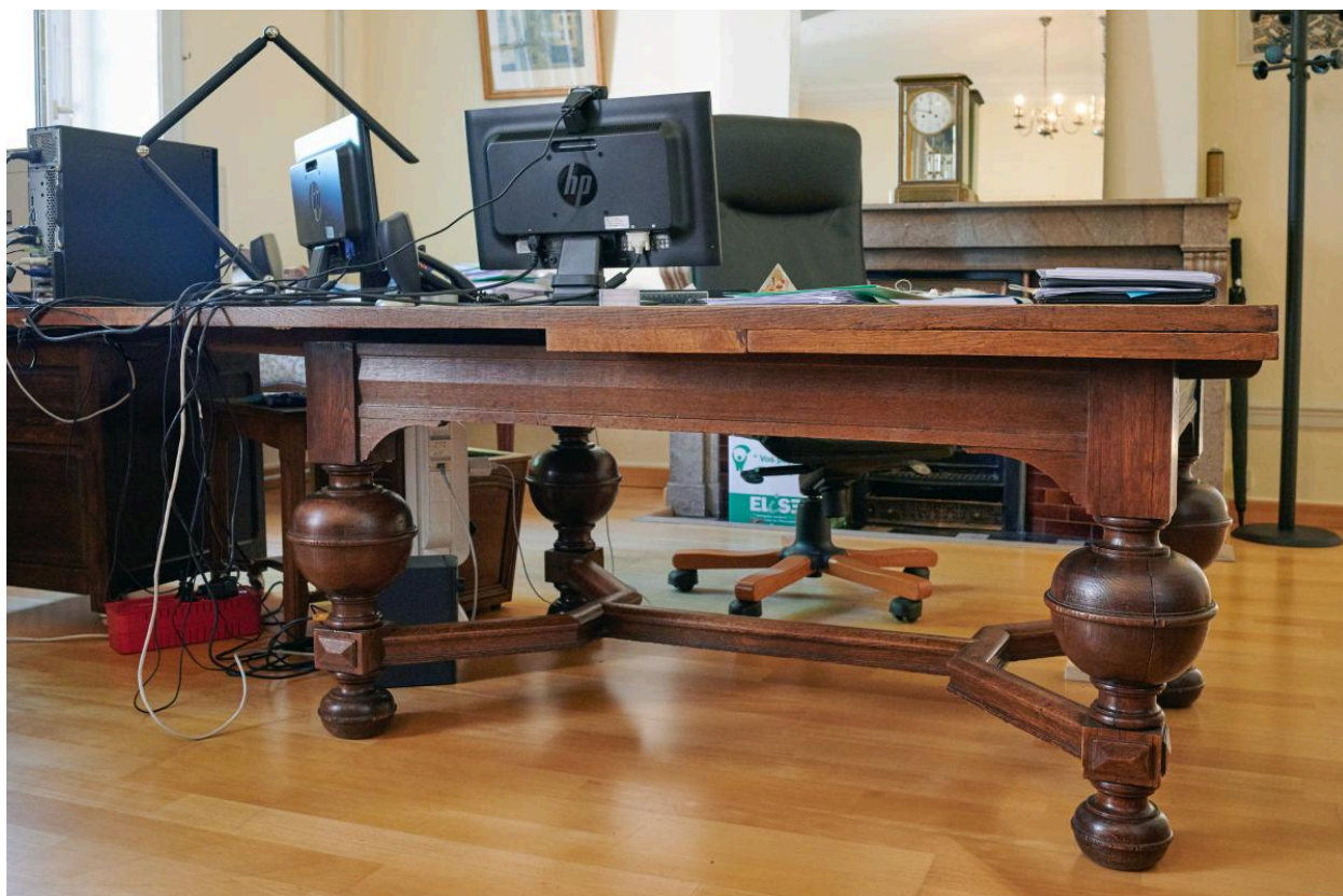
Table servant du bureau.