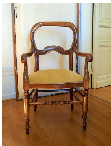
Fauteuil provenant de l'ancienne bibliothèque. Ce meuble est visible sur la photographie de la bibliothèque produite vers 1904.