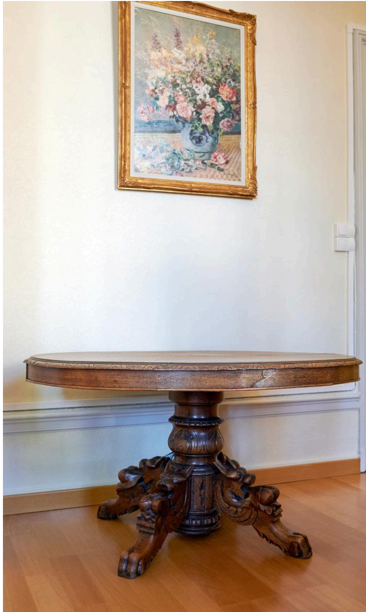
Table ronde avec piètement central provenant de l'ancienne bibliothèque.