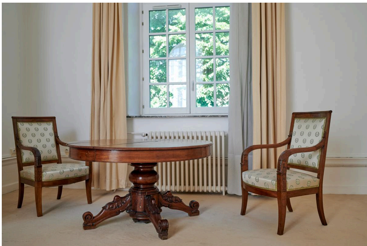
Table ronde à piètement central et deux fauteuils provenant de l'ancienne bibliothèque. Ce mobilier est visible sur la photographie de la bibliothèque produite vers 1904.