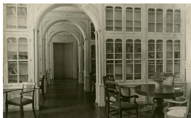
Bibliothèque meublée. Photographie, sans date (vers 1904 ?).

Phot. Thibaut Pierre (reproduction) IVR32_20225900219NUCAB