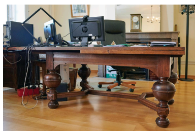
Table servant du bureau. IVR32_20225900281NUCA