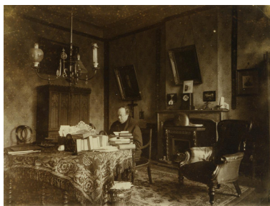
Bureau du directeur. Photographie, avant 1903. On aperçoit au fond à gauche l'armoire qui est toujours conservée dans le lycée.

IVR32_20225900219NUCAB