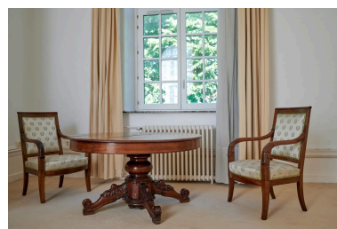
Table ronde à piètement central et deux fauteuils provenant de l'ancienne bibliothèque. Ce mobilier est visible sur la photographie de la bibliothèque produite vers 1904.