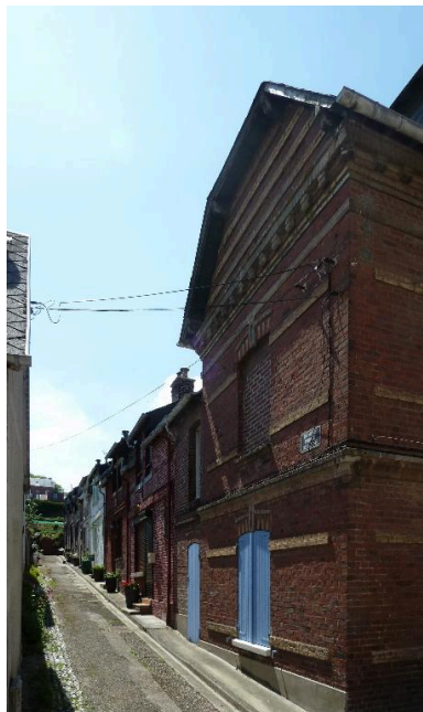
Vue de trois-quarts depuis l'entrée de l'impasse. IVR22_20158006090NUCA