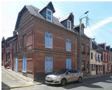
Logement de contremaître.