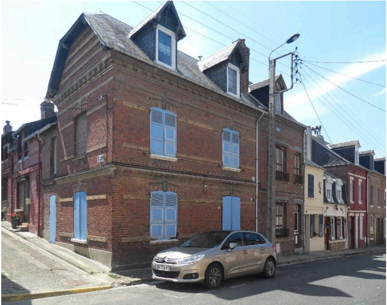
Logement de contremaître.