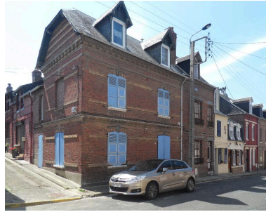
Logement de contremaître. IVR22_20158006714NUCA