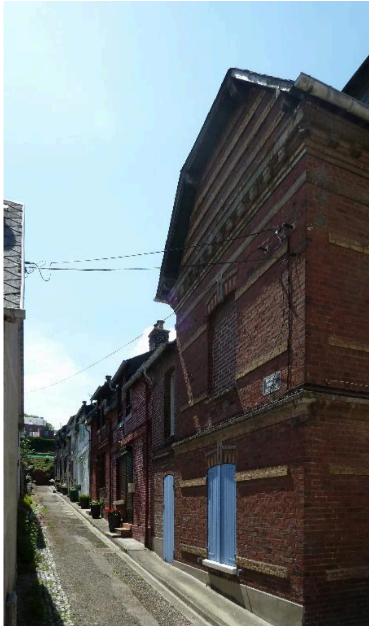
Vue de trois-quarts depuis l'entrée de l'impasse.