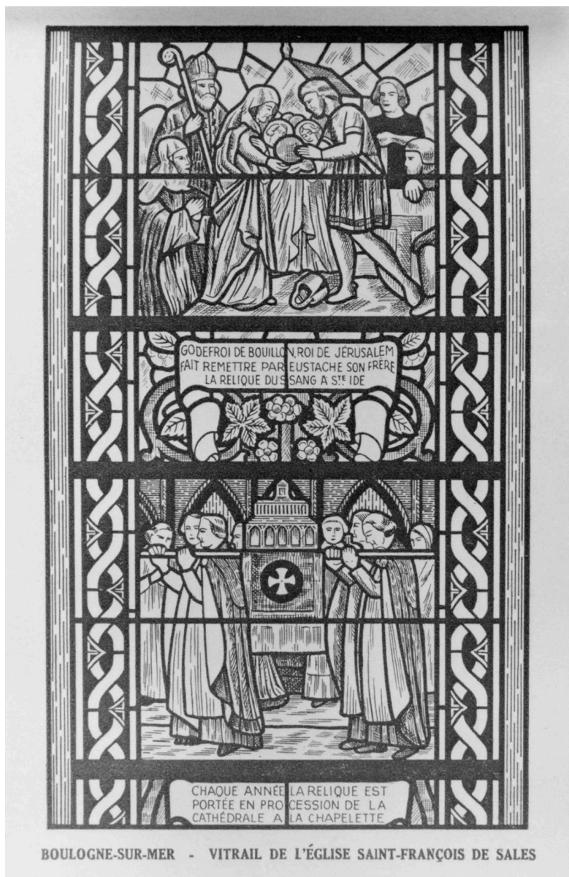
La remise de la relique et la procession de la relique (dessin) : vue générale (coll. part.)