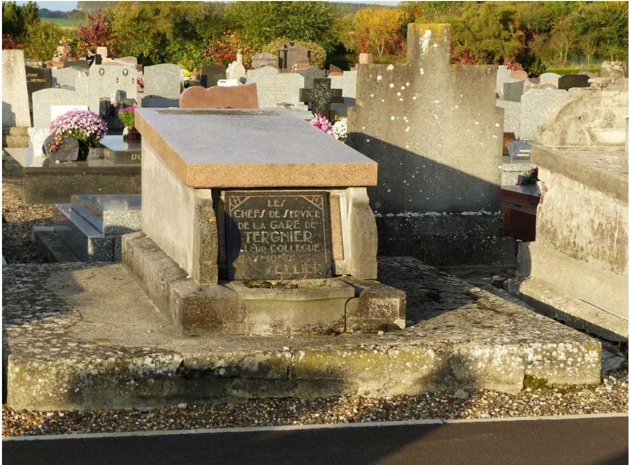
Tombeau (sarcophage) de Raymond Sellier.