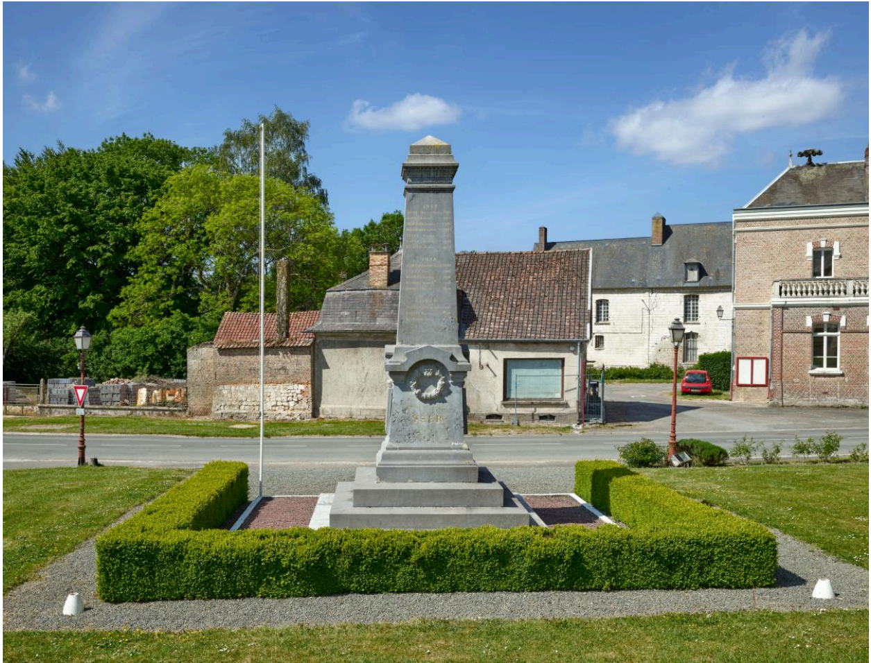
Vue générale depuis le nord-est.