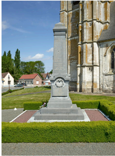
Vue générale depuis le sud-est. IVR22_20228000111NUCA