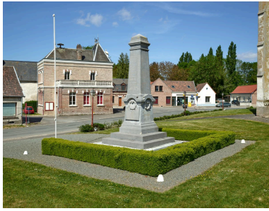
Vue générale de trois quarts depuis l'est.