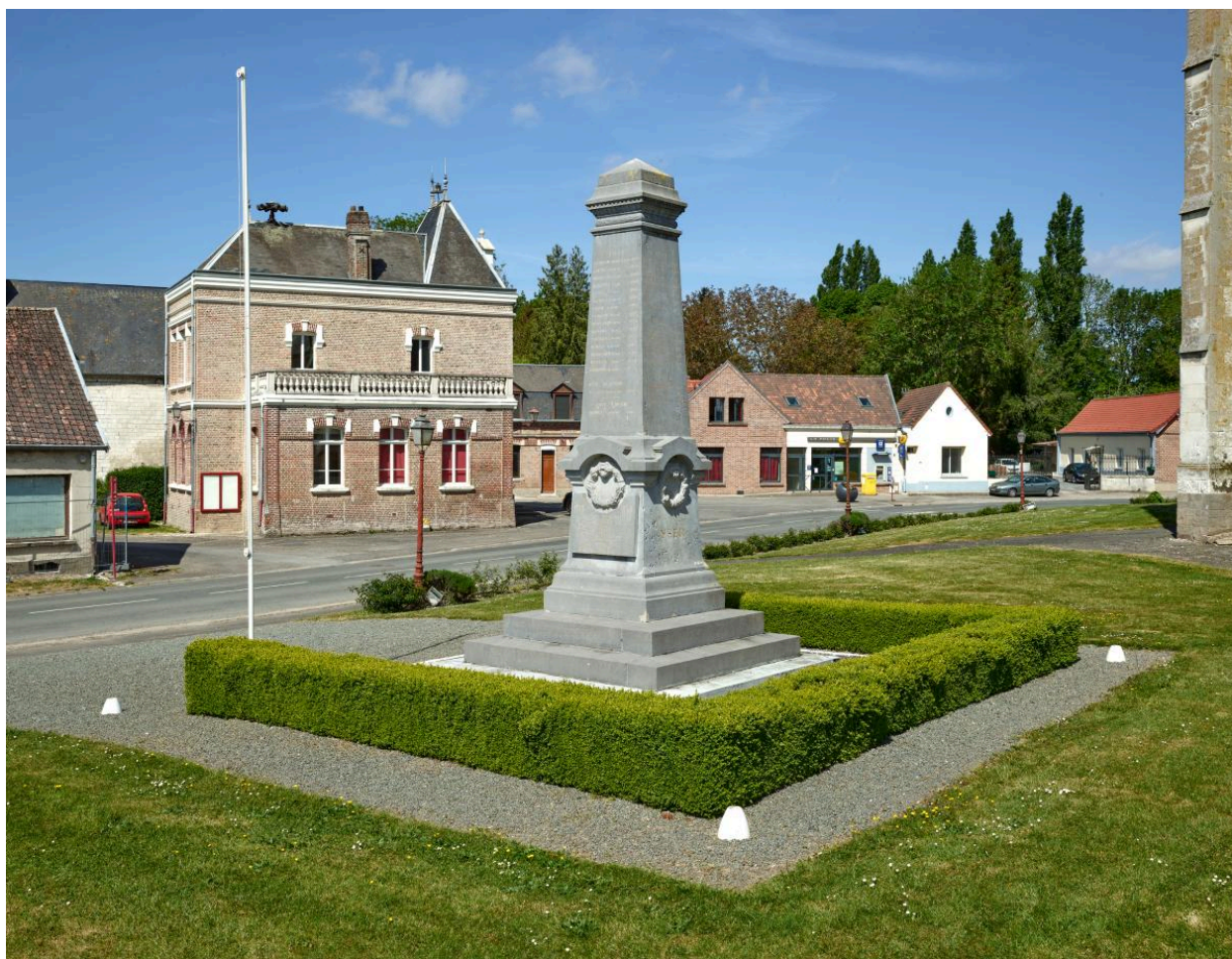
Vue générale de trois quarts depuis l'est.