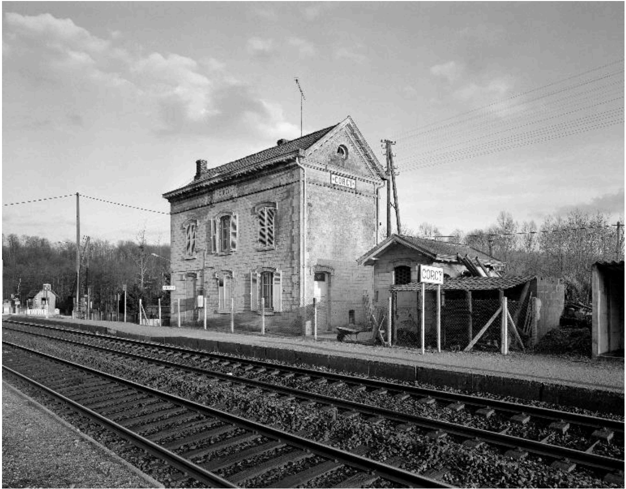
Vue générale nord-ouest de la halte, depuis la voie ferrée.