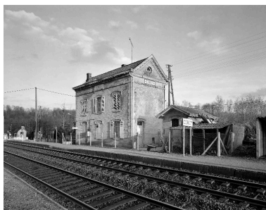
Vue générale nord-ouest de la halte, depuis la voie ferrée.