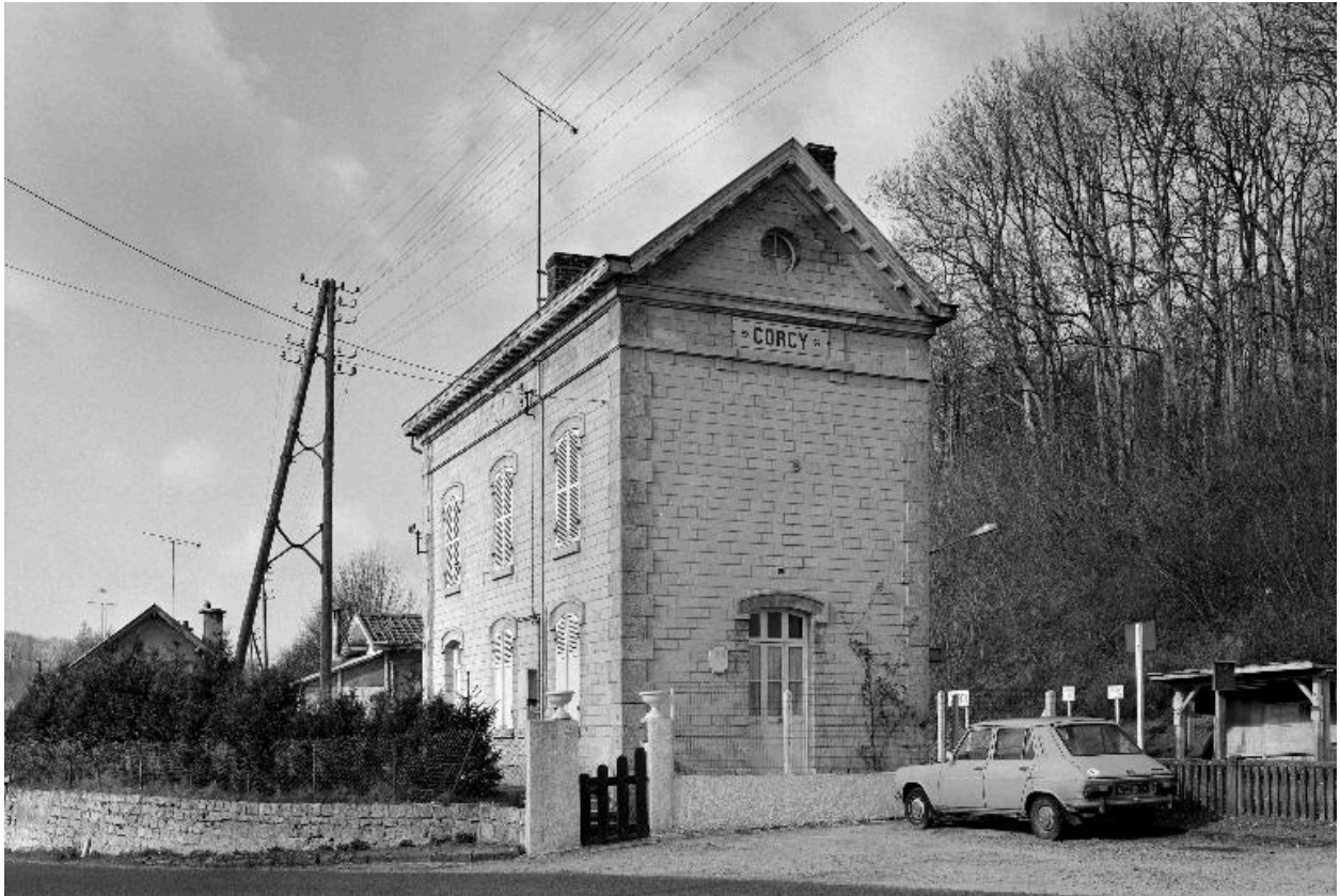
Vue du bâtiment de voyageurs, depuis l'est.