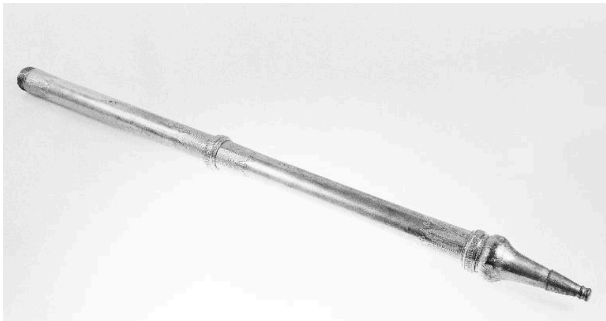
Vue d'ensemble, allongé.