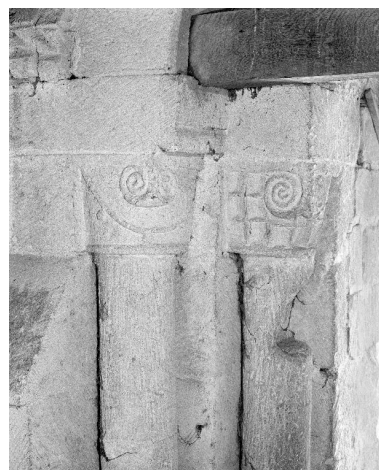
Colonnettes et chapiteaux d'une fenêtre du clocher.