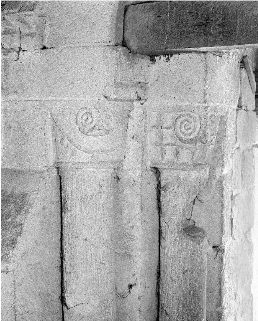
Colonnettes et chapiteaux d'une fenêtre du clocher.