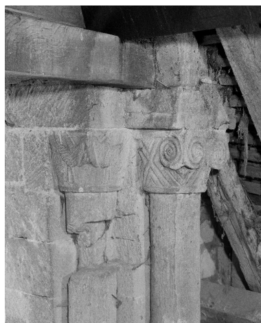
Colonnettes et chapiteaux d'une fenêtre du clocher.