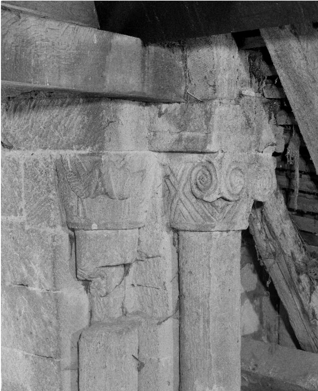
Colonnettes et chapiteaux d'une fenêtre du clocher.