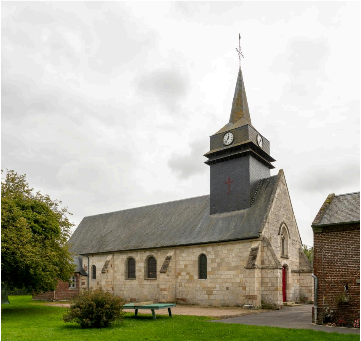
Vue depuis le nord-ouest.