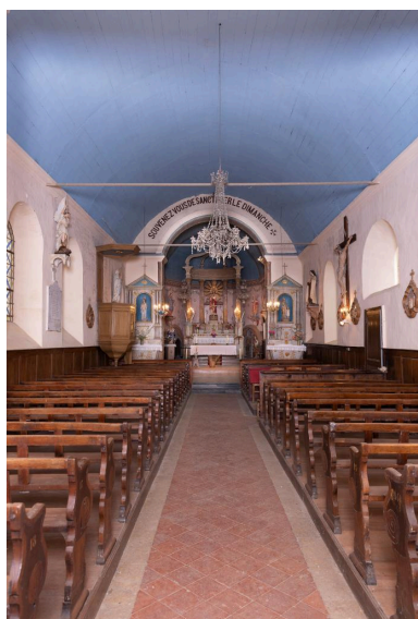
Vue vers le chœur depuis l'entrée occidentale. IVR32_20216001145NUCA