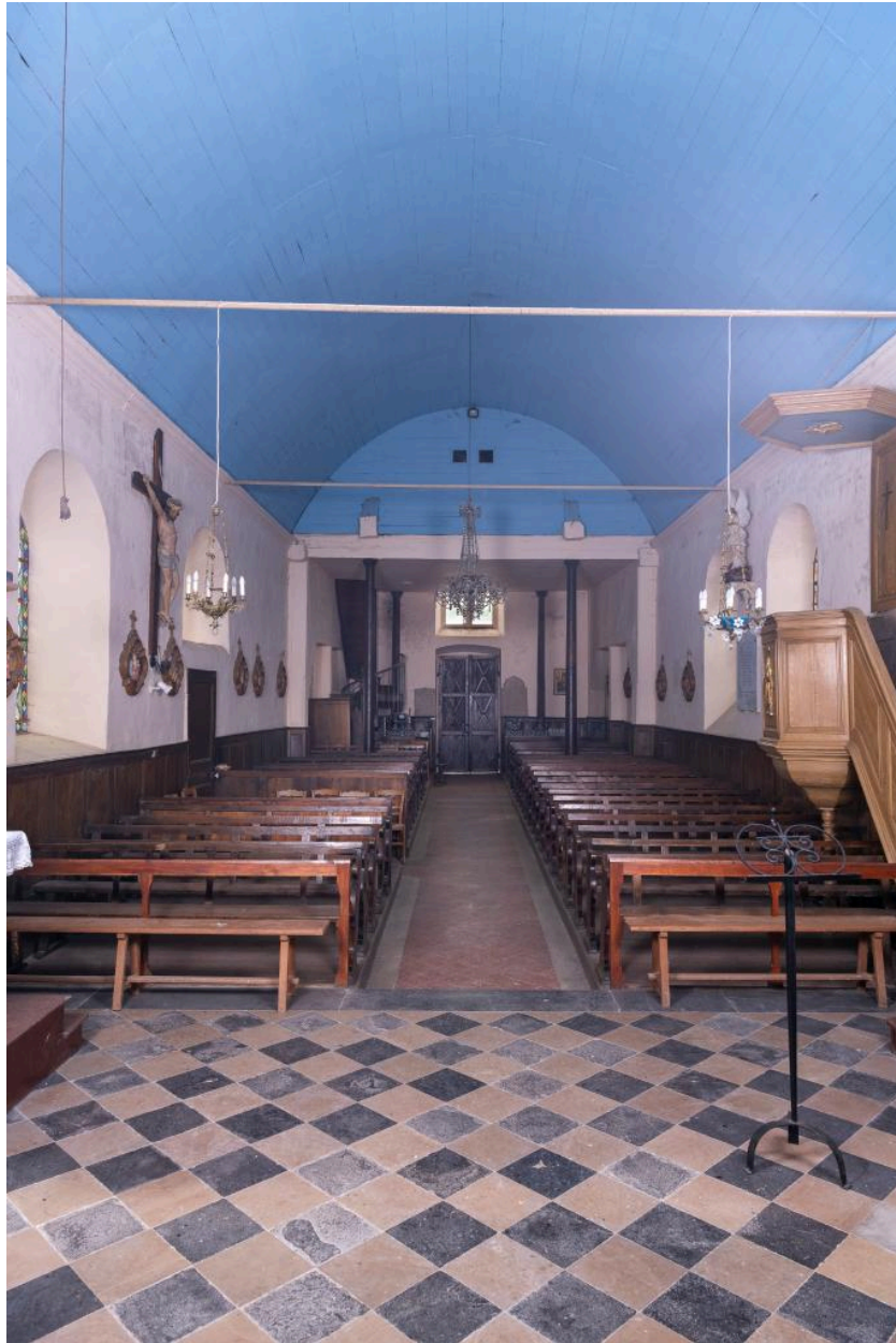
Vue intérieure vers la nef.