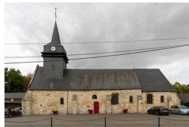
Vue depuis le sud. IVR32_20216000946NUCA