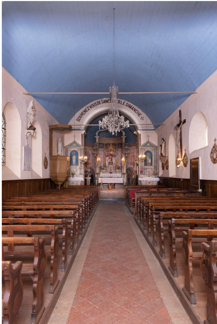
Vue vers le chœur depuis l'entrée occidentale.