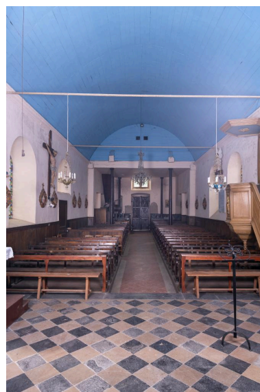
Vue intérieure vers la nef. IVR32_20216001142NUCA