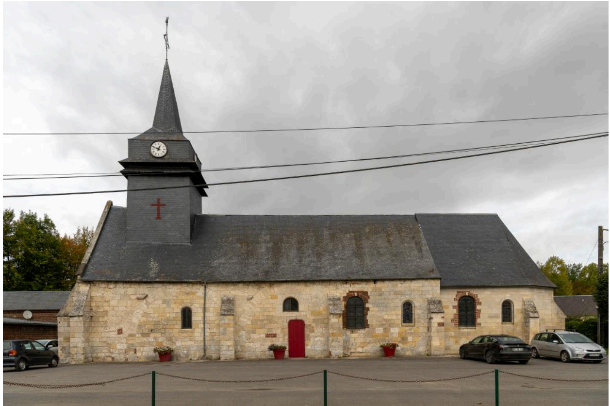
Vue depuis le sud.