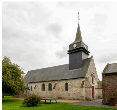
Vue depuis le nord-ouest. IVR32_20216000944NUCA