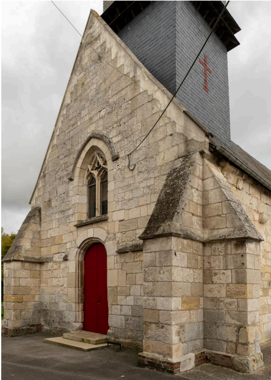
Vue de la façade occidentale.