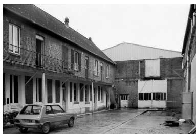
Cour intérieure, flanc ouest. IVR22_19898001392Z