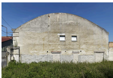
Pignon est de l'atelier principal de la conserverie. IVR22_20158000259NUC2A