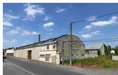
Vue d'ensemble sur rue. IVR22_20158000257NUC2A