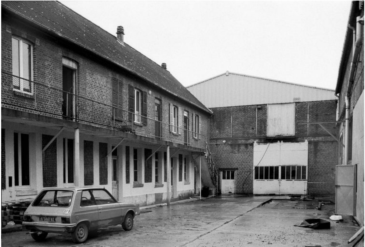
Cour intérieure, flanc ouest.