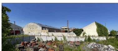
Vue d'ensemble est des ateliers. IVR22_20158000258NUC2AQ