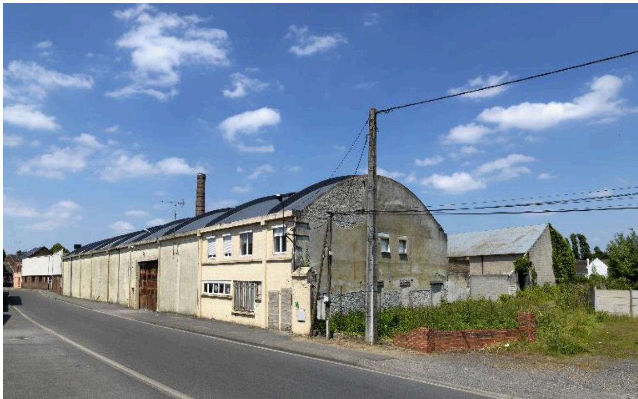
Vue d'ensemble sur rue.