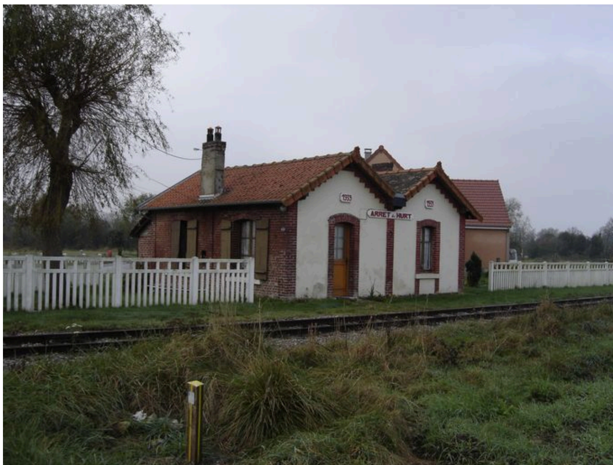
Halte de Hurt.