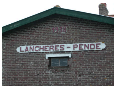
Détail porté sur le bâtiment principal de la gare de Lanchères.