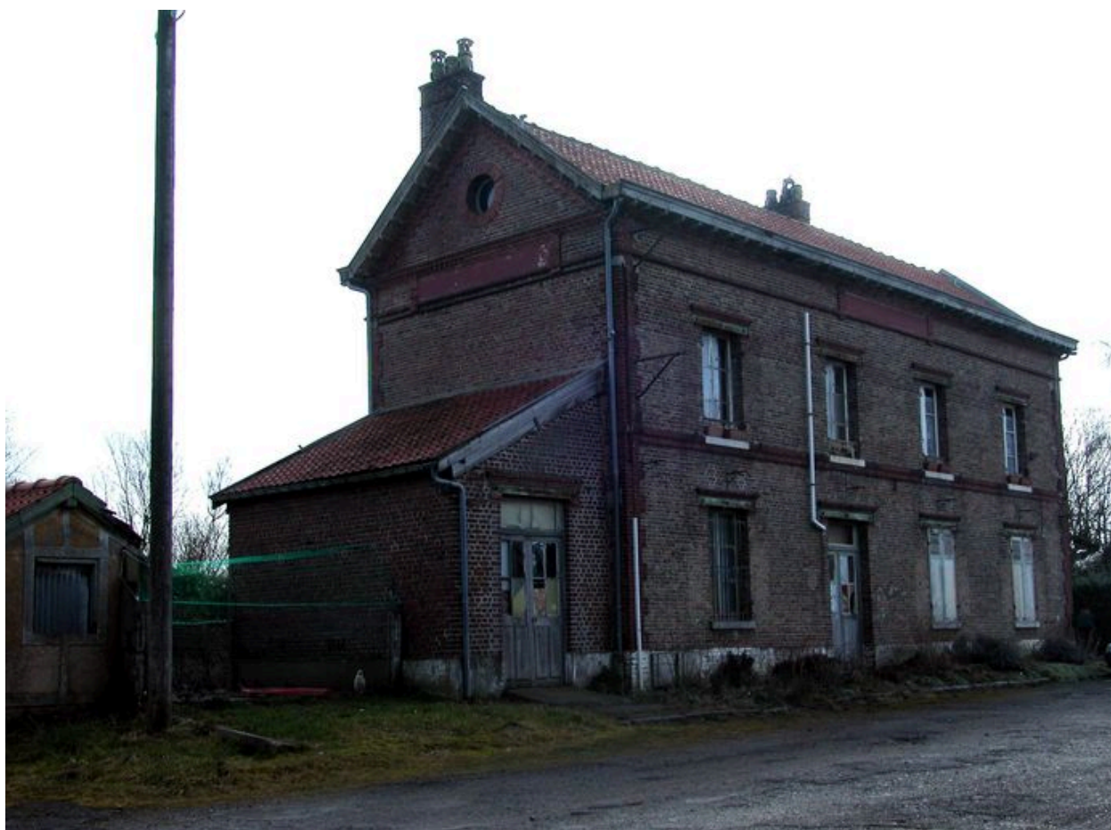
L'ancienne gare de Quend, sur la ligne Paris-Boulogne.