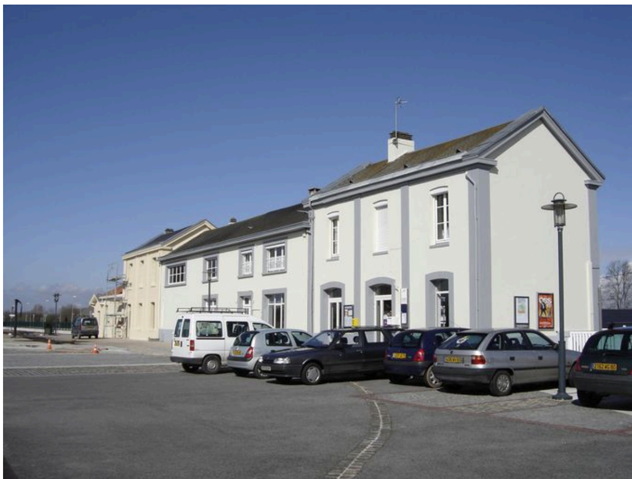
La gare de Noyelles-sur-Mer.