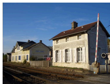
L'ancienne gare de Port-le-Grand.