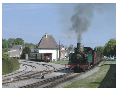
Le 'petit train' au départ de la gare de Saint-Valery-sur-Somme.