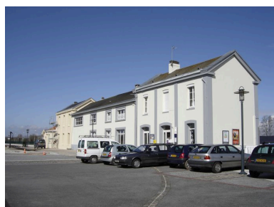
La gare de Noyelles-sur-Mer. IVR22_20058005421NUCA