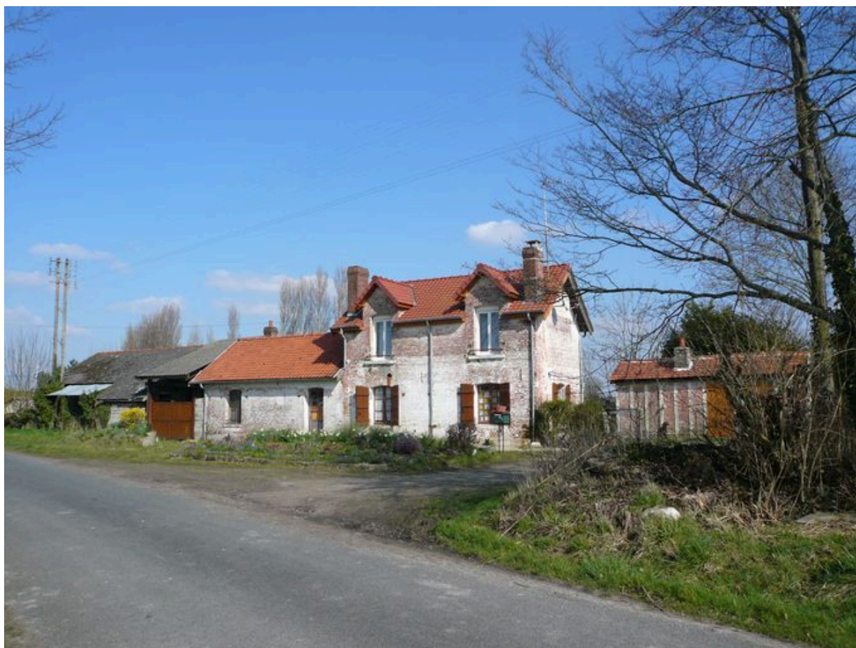
L'ancienne gare de Ponthoile-Romaine.