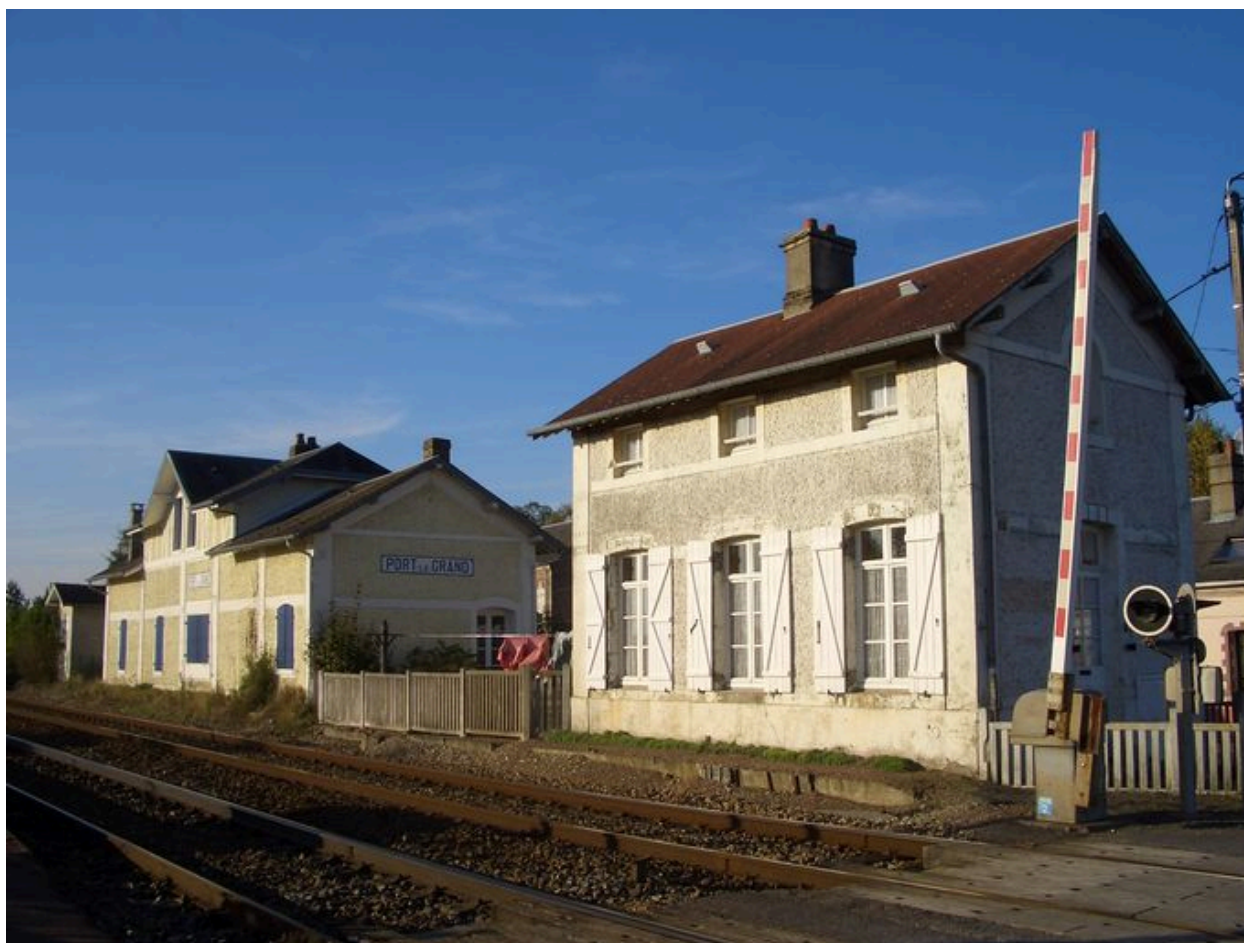
L'ancienne gare de Port-le-Grand.