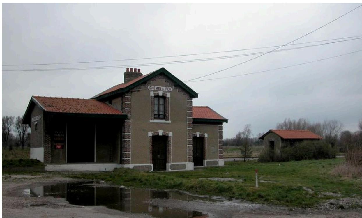
La gare de Lanchères, sur l'arrivée.