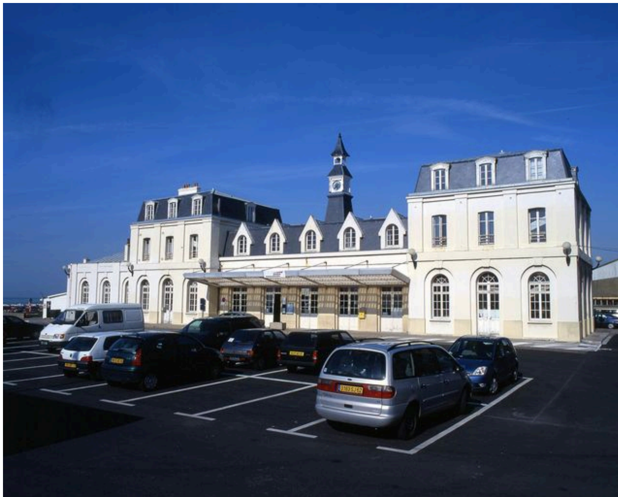
La gare de Le Tréport Mers, vue du côté de l'arrivée.