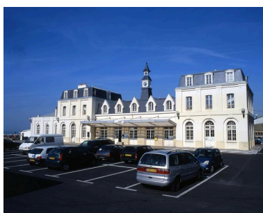
La gare de Le Tréport Mers, vue du côté de l'arrivée.