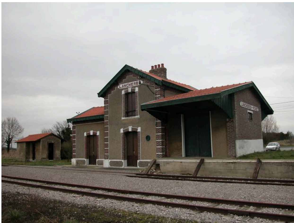
La gare de Lanchères, côté quais.