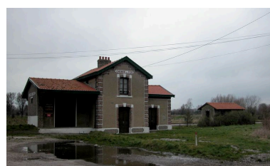
La gare de Lanchères, sur l'arrivée.