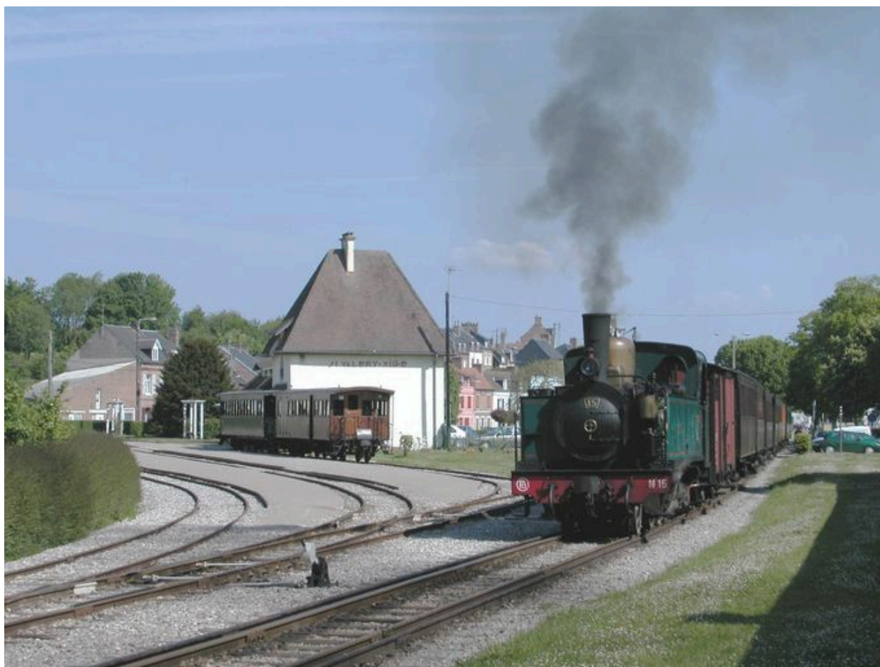
Le 'petit train' au départ de la gare de Saint-Valery-sur-Somme.