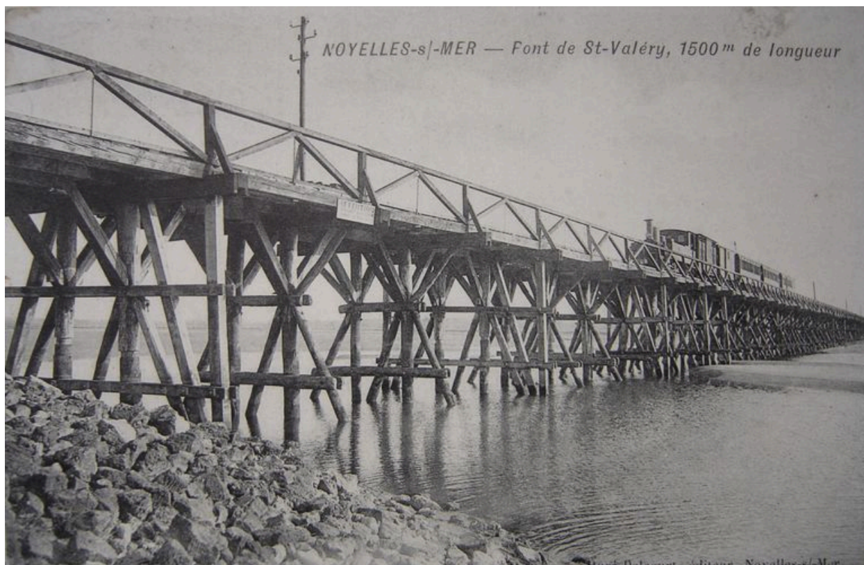
L'ancienne estacade de Noyelles à Saint-Valery au début du 20e siècle, carte postale.