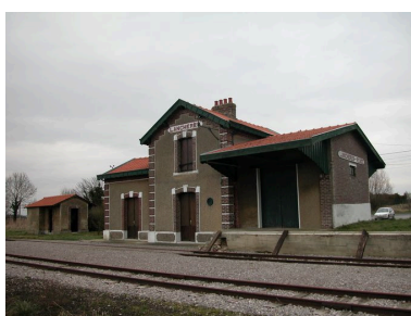
La gare de Lanchères, côté quais.