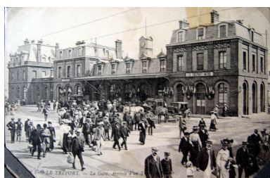
La gare Le Tréport Mers, carte postale, 1er quart 20e siècle (coll. part.).