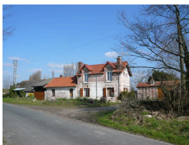
L'ancienne gare de Ponthoile-Romaine. IVR22_20078005579NUCA