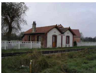
Halte de Hurt.