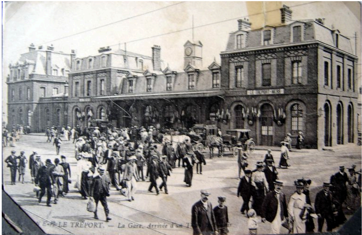
La gare Le Tréport Mers, carte postale, 1er quart 20e siècle.