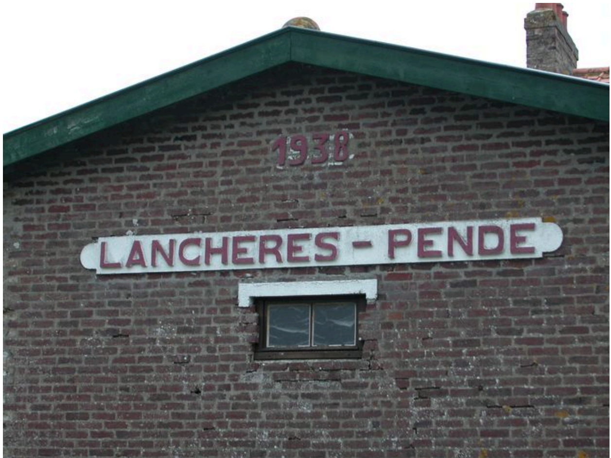
Détail porté sur le bâtiment principal de la gare de Lanchères.