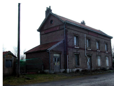
L'ancienne gare de Quend, sur la ligne Paris-Boulogne.