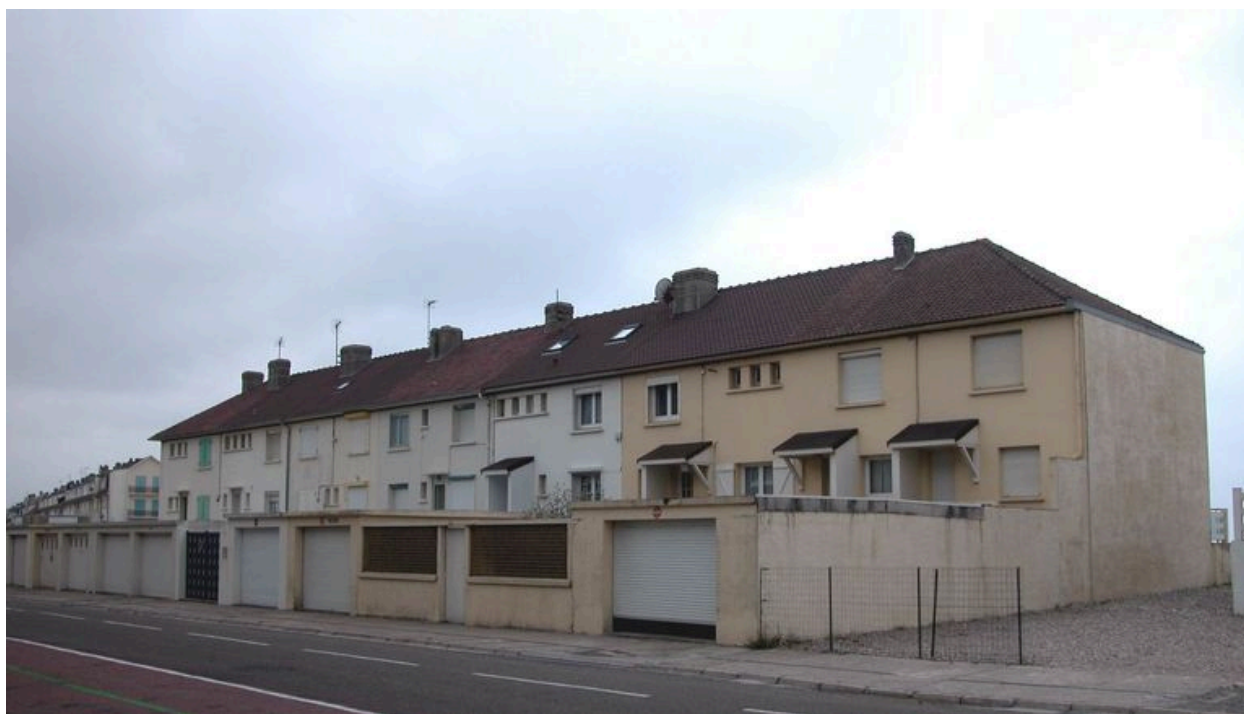
Vue d'ensemble des façades postérieures.