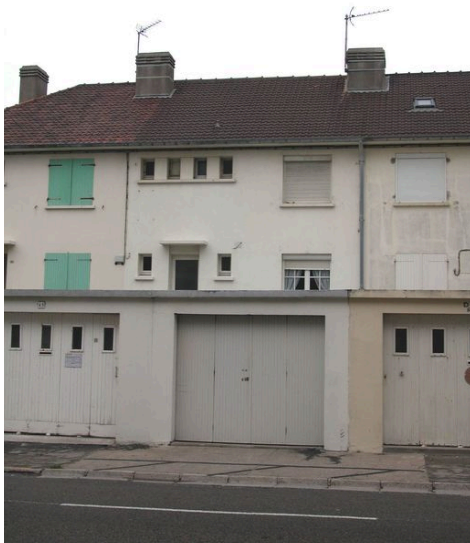
Détail d'une unité, façade postérieure.