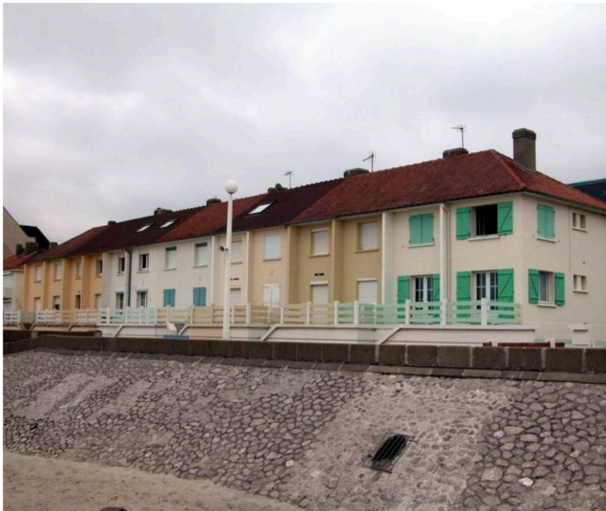
Vue d'ensemble des façades côté mer.