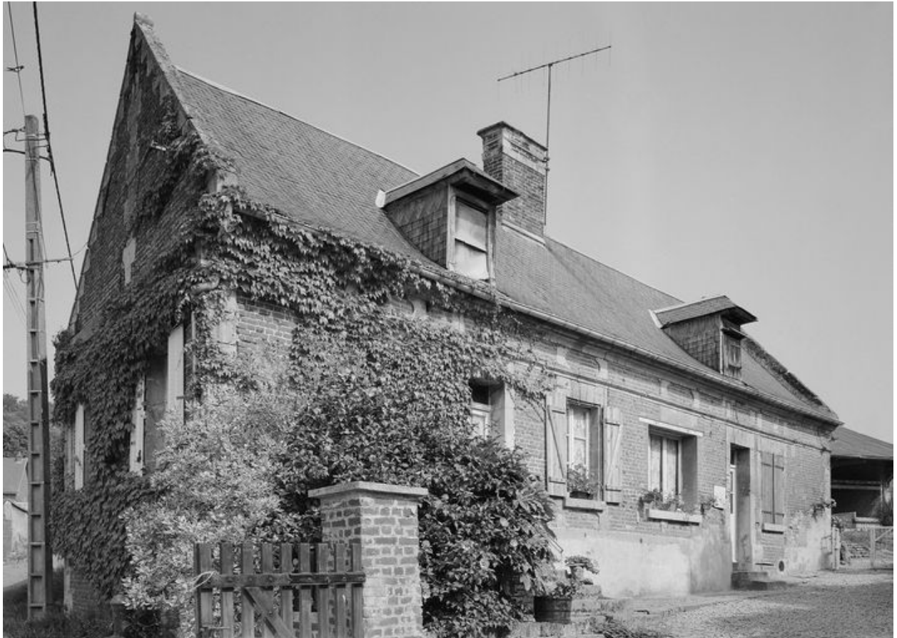
Logis. Vue générale.