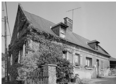
Logis. Vue générale. IVR22_19846001074X