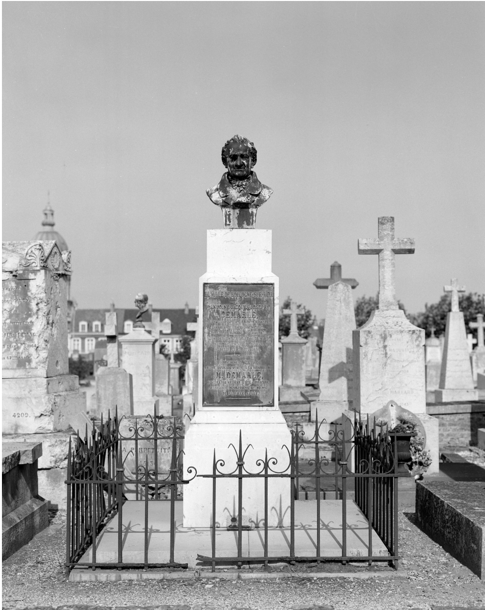
Tombeau d'Antoine-Jacques-Joseph Demarle. Vue générale.