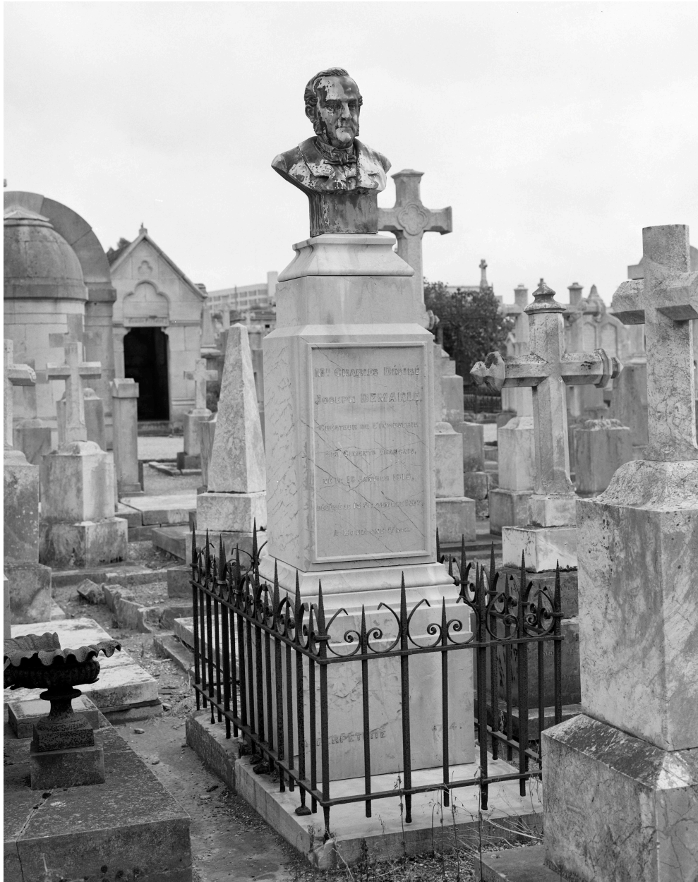
Tombeau de Charles-Désiré-Joseph Demarle. Vue générale.