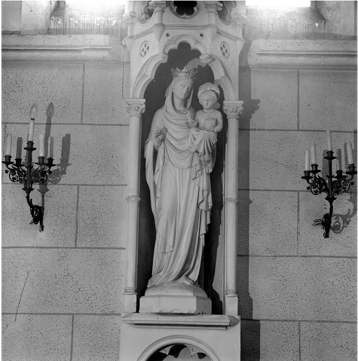
Statue Vierge à l'Enfant.