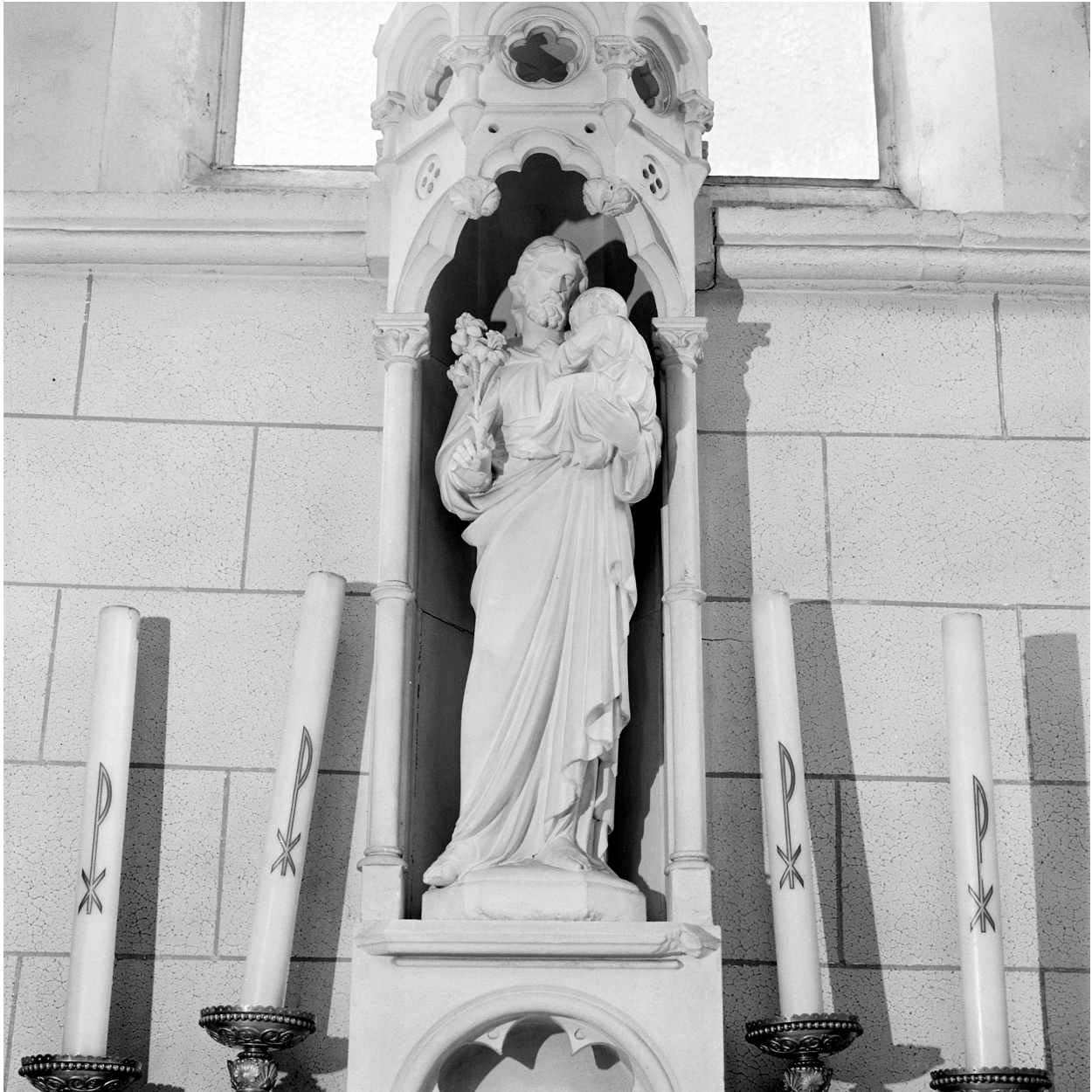
Statue Saint Joseph.