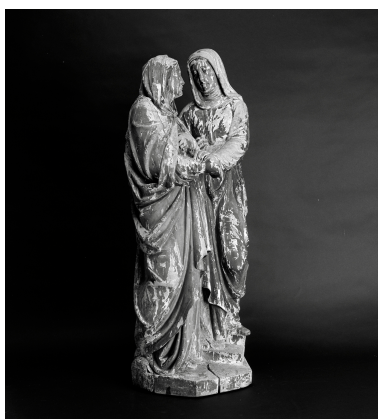
Sainte Élisabeth et la Vierge, vue de trois quarts.