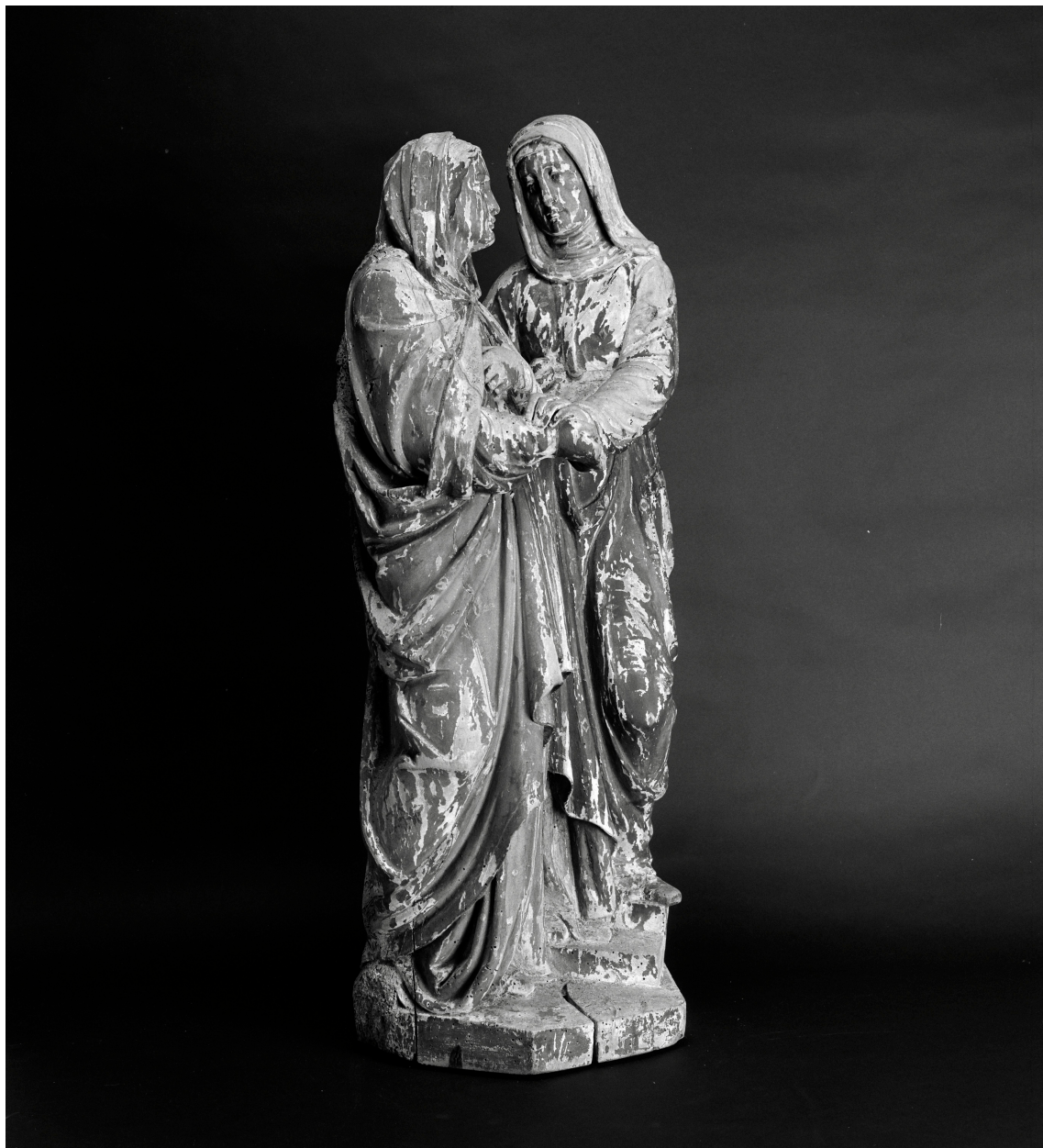
Sainte Élisabeth et la Vierge, vue de trois quarts.