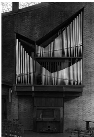
Vue générale. IVR31_19825901614X