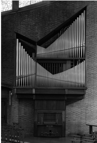
Vue générale. IVR31_19825901614X