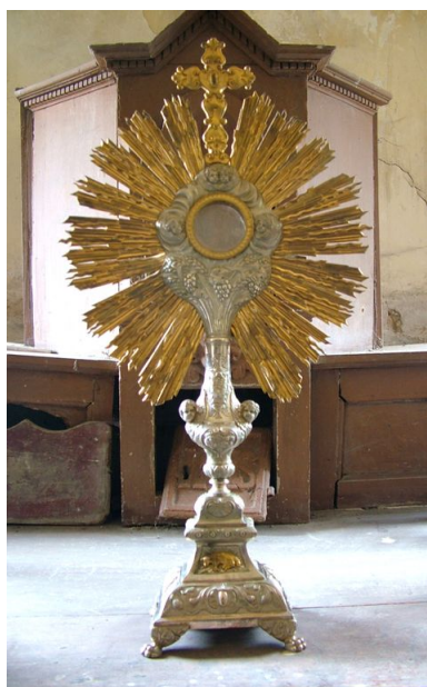
Ostensorio, bronze argenté et laiton, 2e moitié du 19e siècle. IVR22_20108002089NUCA