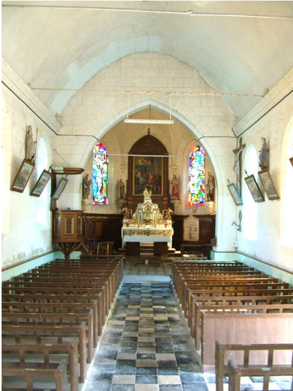
Vue de la nef et du choeur.