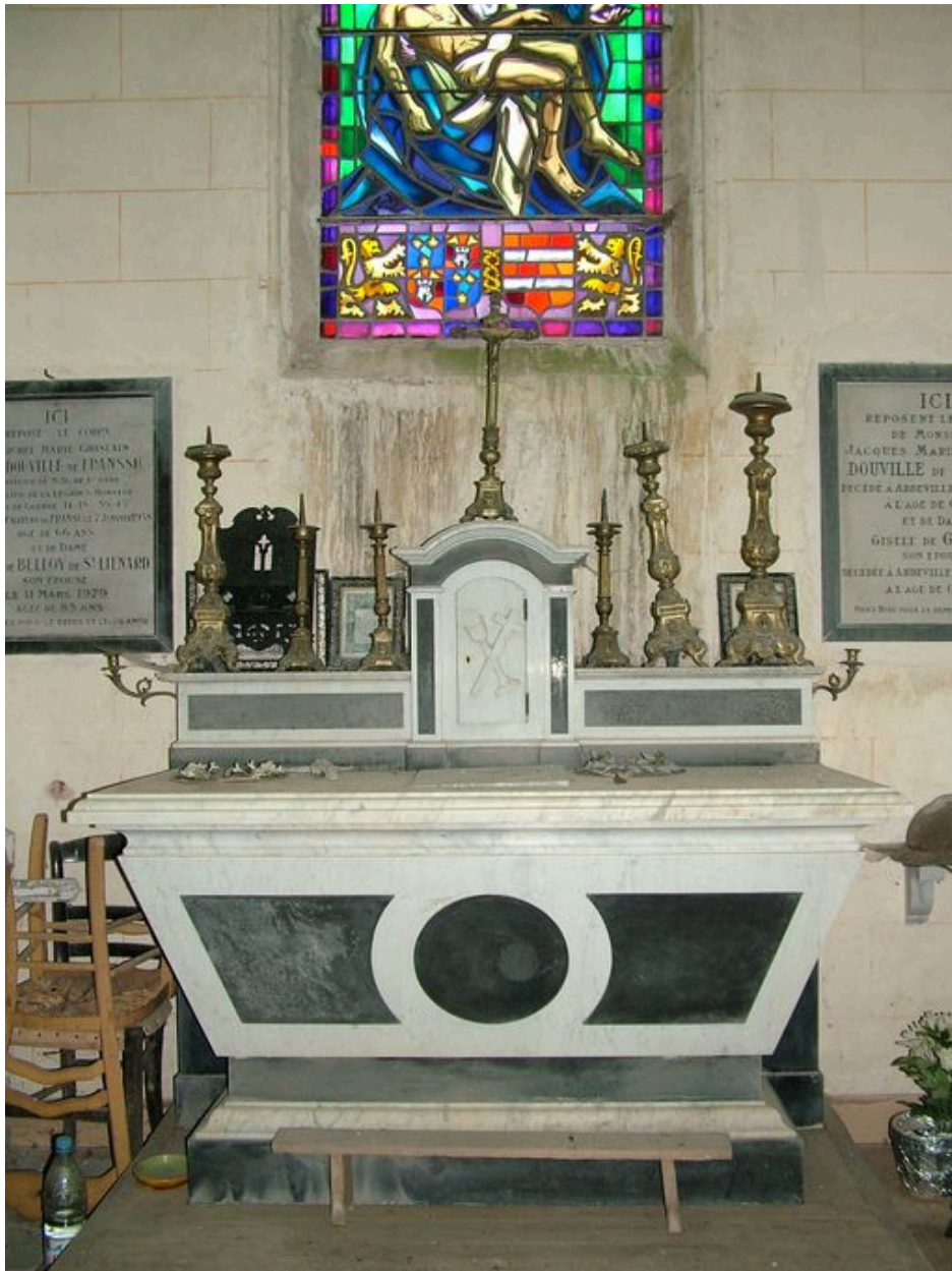
Autel de la chapelle funéraire de la famille Douville de Franssu.