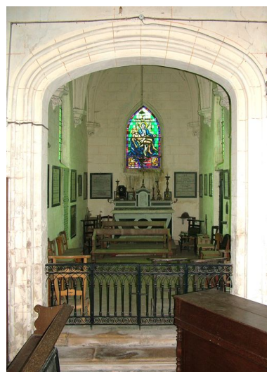
Vue générale de la chapelle funéraire de la famille Douville de Fransu.