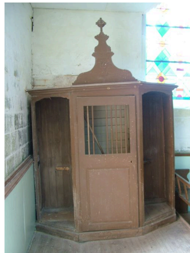
Confessionnal, chêne, 19e siècle.