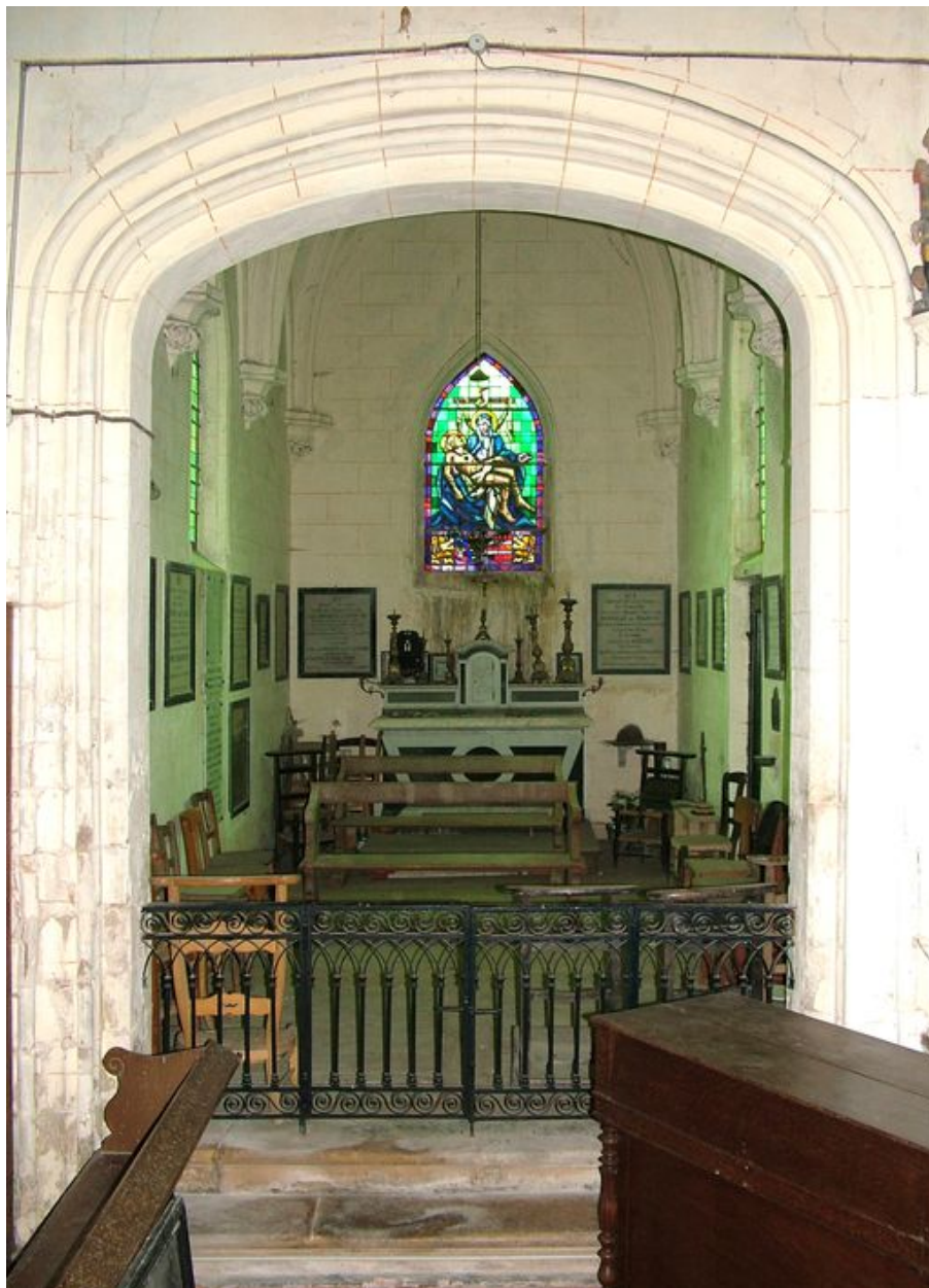
Vue générale de la chapelle funéraire de la famille Douville de Fransu.