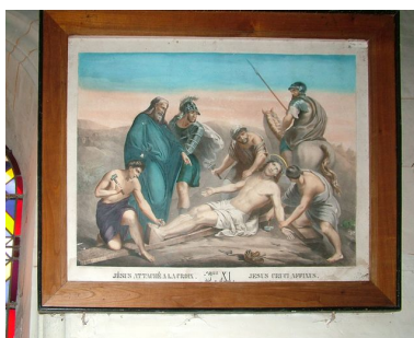
Chemin de croix (station XI) : Jésus est cloué sur la croix, 4e quart du 19e siècle. IVR22_20108002076NUCA