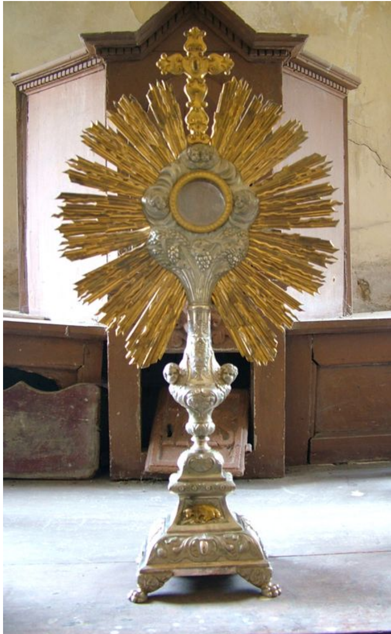
Ostensoir, bronze argenté et laiton, 2e moitié du 19e siècle.