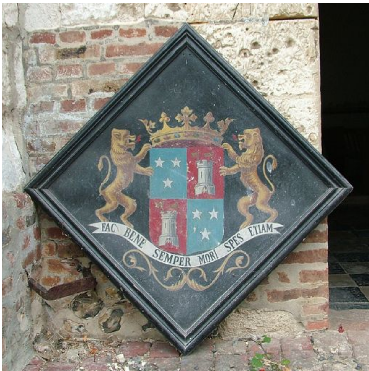
Tableau commémoratif de Henri Douville de Fransu, mort au combat le 25 octobre 1906.