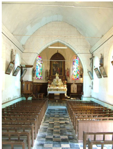
Vue de la nef et du chœur.