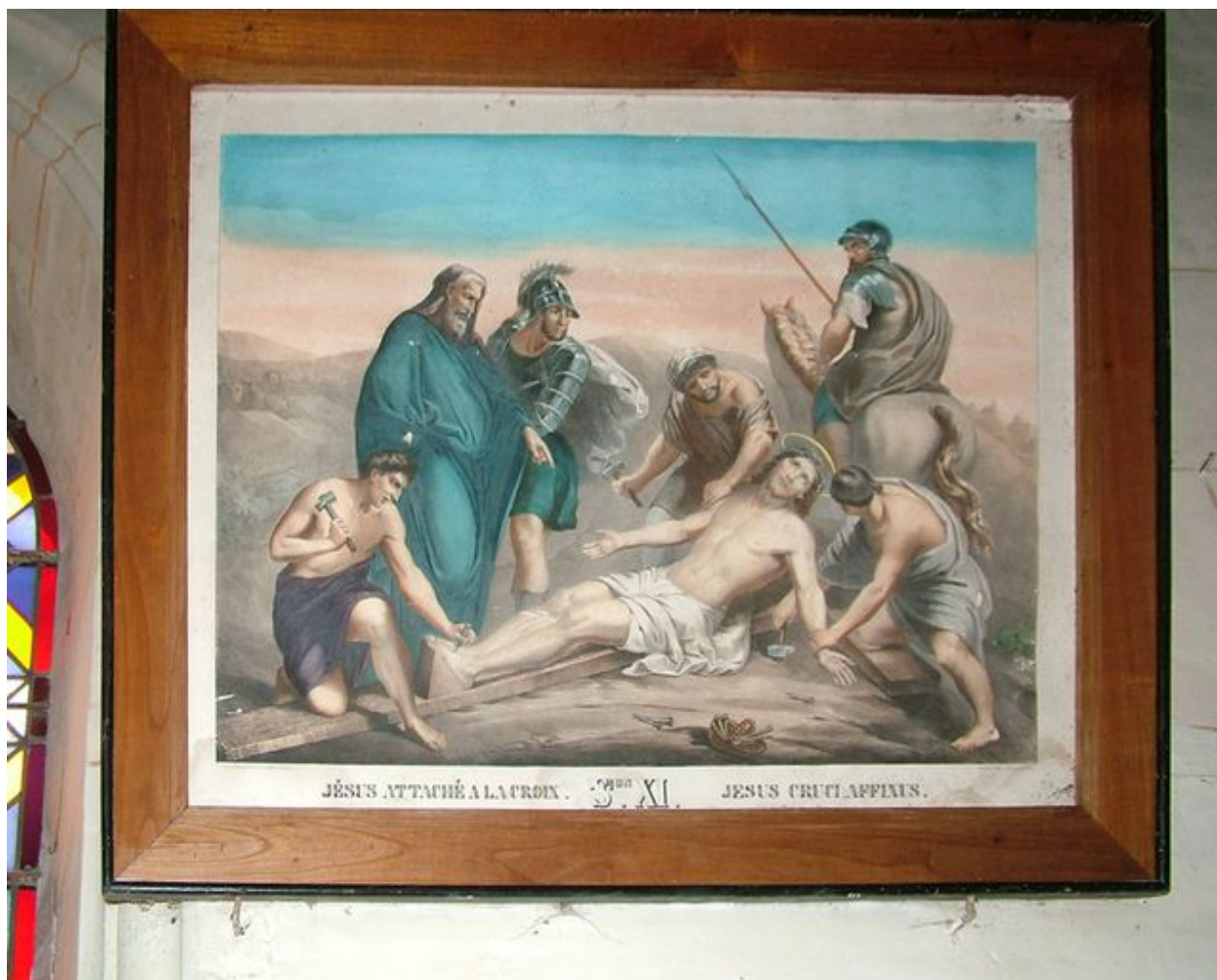
Chemin de croix (station XI) : Jésus est cloué sur la croix, 4e quart du 19e siècle.