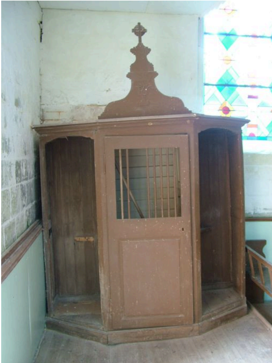
Confessionnal, chêne, 19e siècle.