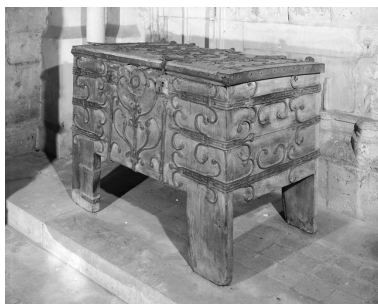
Vue de face après restauration.