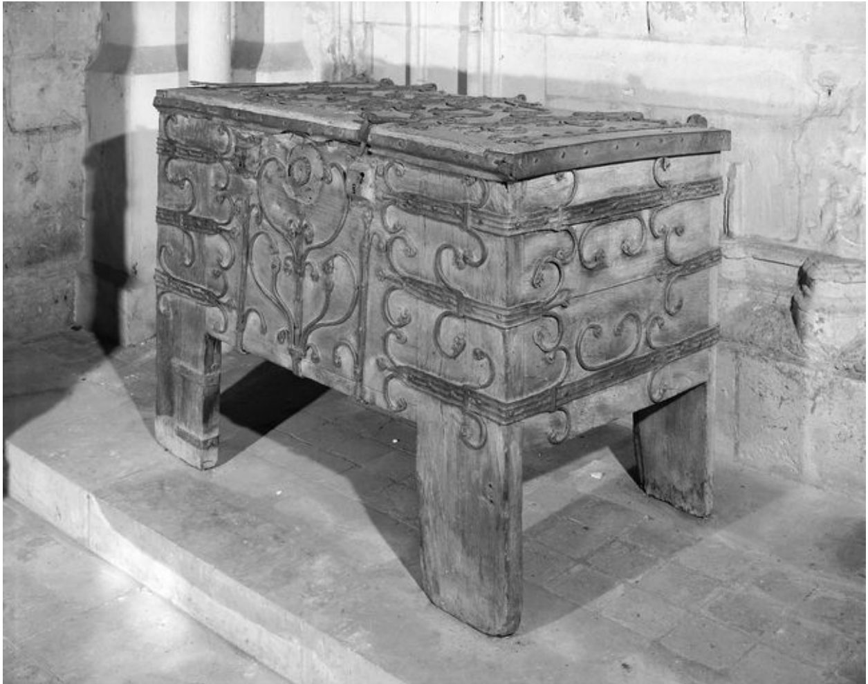
Vue de face après restauration.