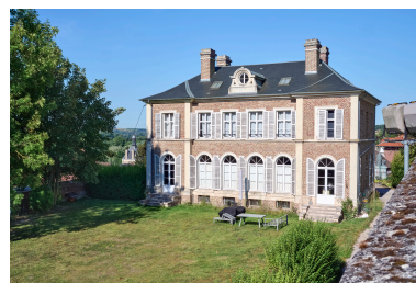
Vue du presbytère, depuis l'est. IVR32_20258001383NUCA