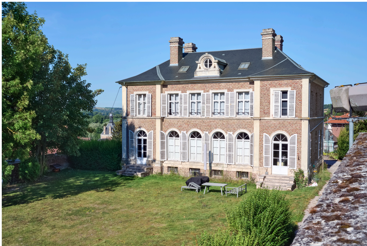
Vue du presbytère, depuis l'est.