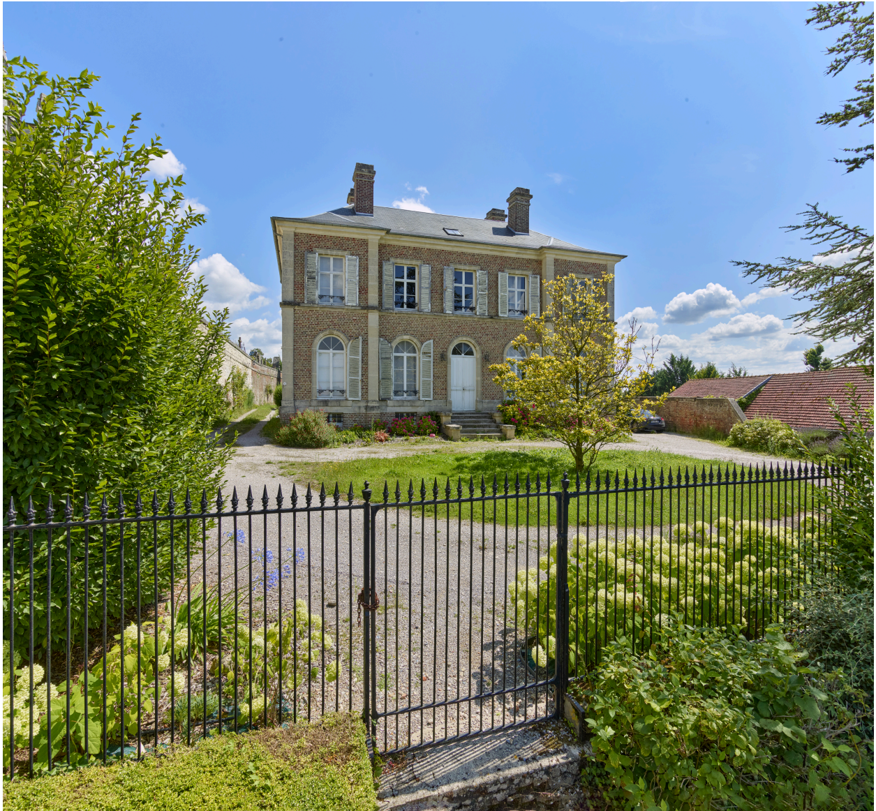
Vue du presbytère, depuis l'ouest.