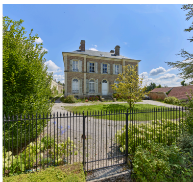
Vue du presbytère, depuis l'ouest.