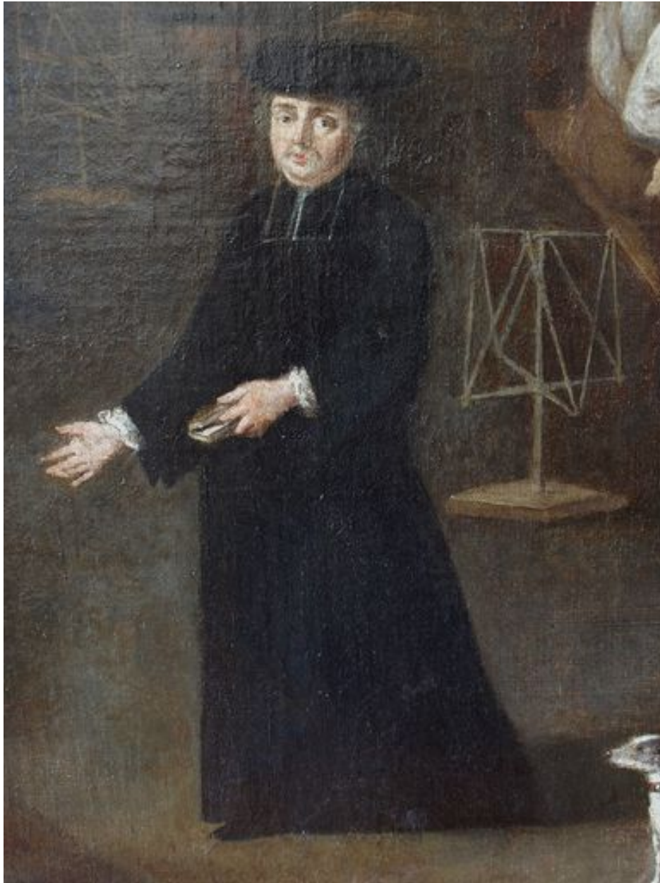
Vue de détail, prêtre