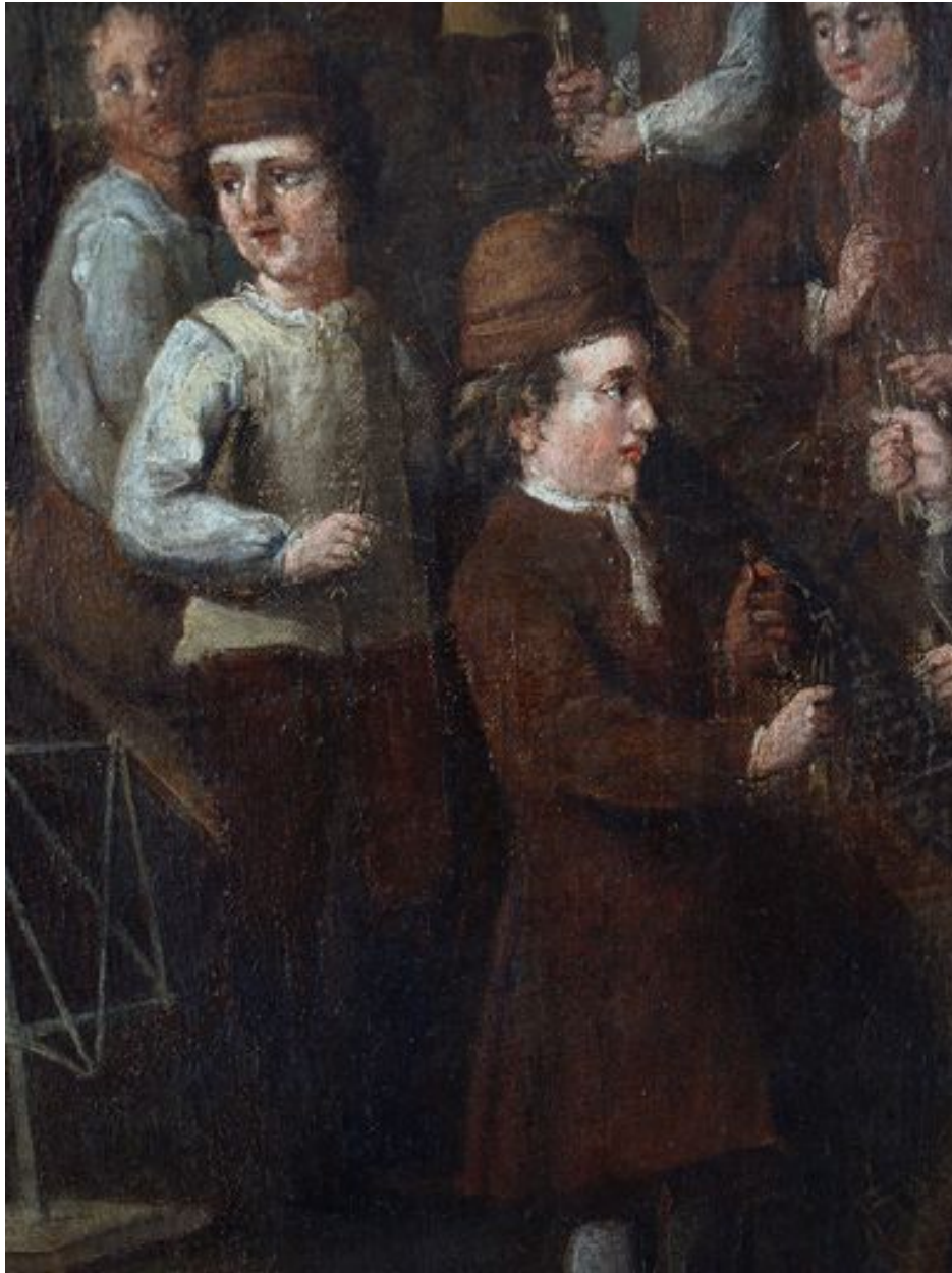
Vue de détail, garçons