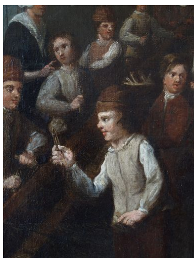
Vue de détail, garçons