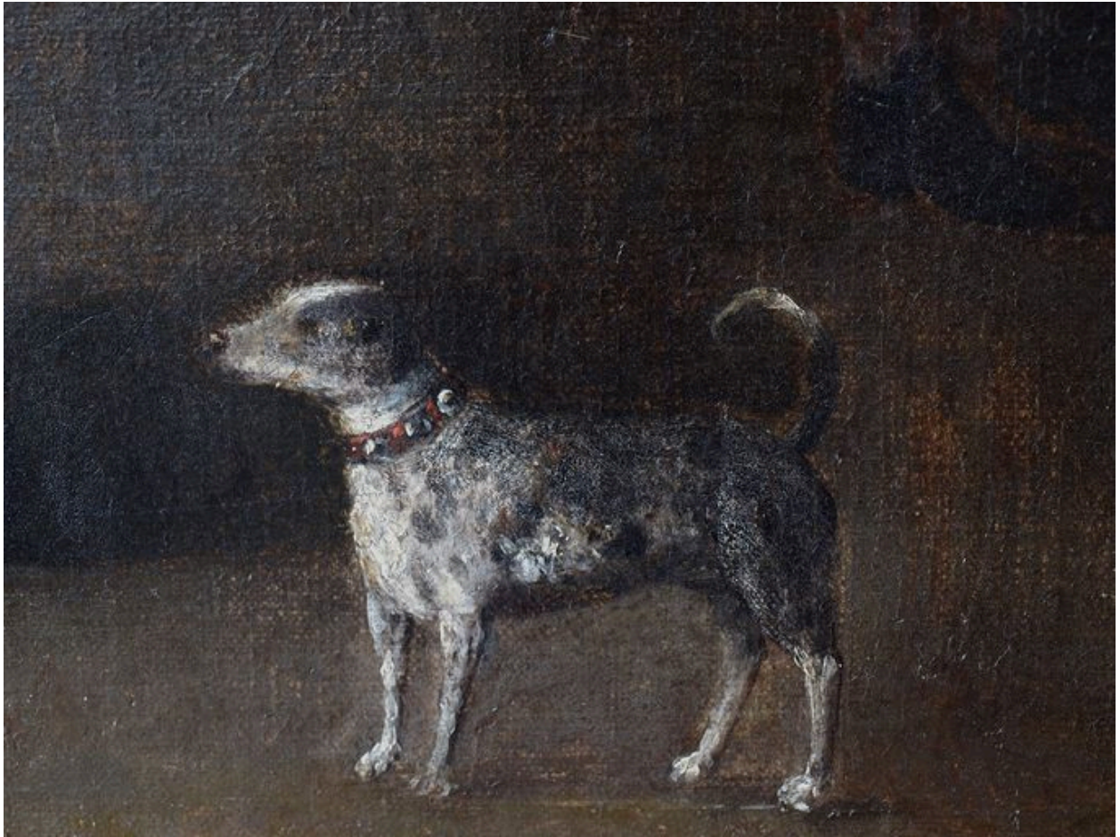
Vue de détail, chien