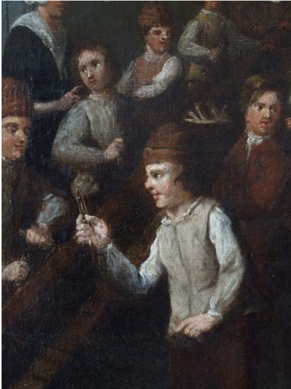
Vue de détail, garçons