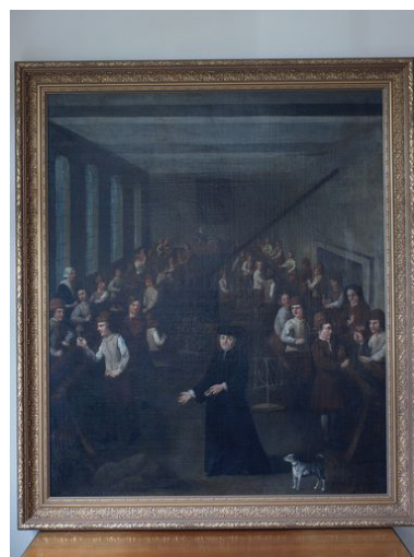
Vue générale IVR31_20106201743NUCA