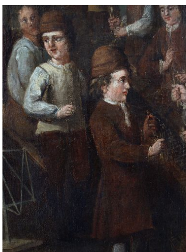
Vue de détail, garçons IVR31_20106201746NUCA