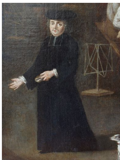
Vue de détail, prêtre IVR31_20106201744NUCA