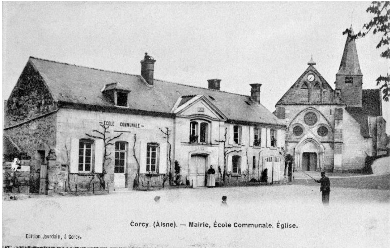
Carte postale éditée au début du 20e siècle, représentant la précédente mairie-école avant sa destruction au cours du premier conflit mondial (coll. part.).