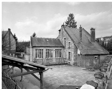
Vue générale des élévations sur cour.