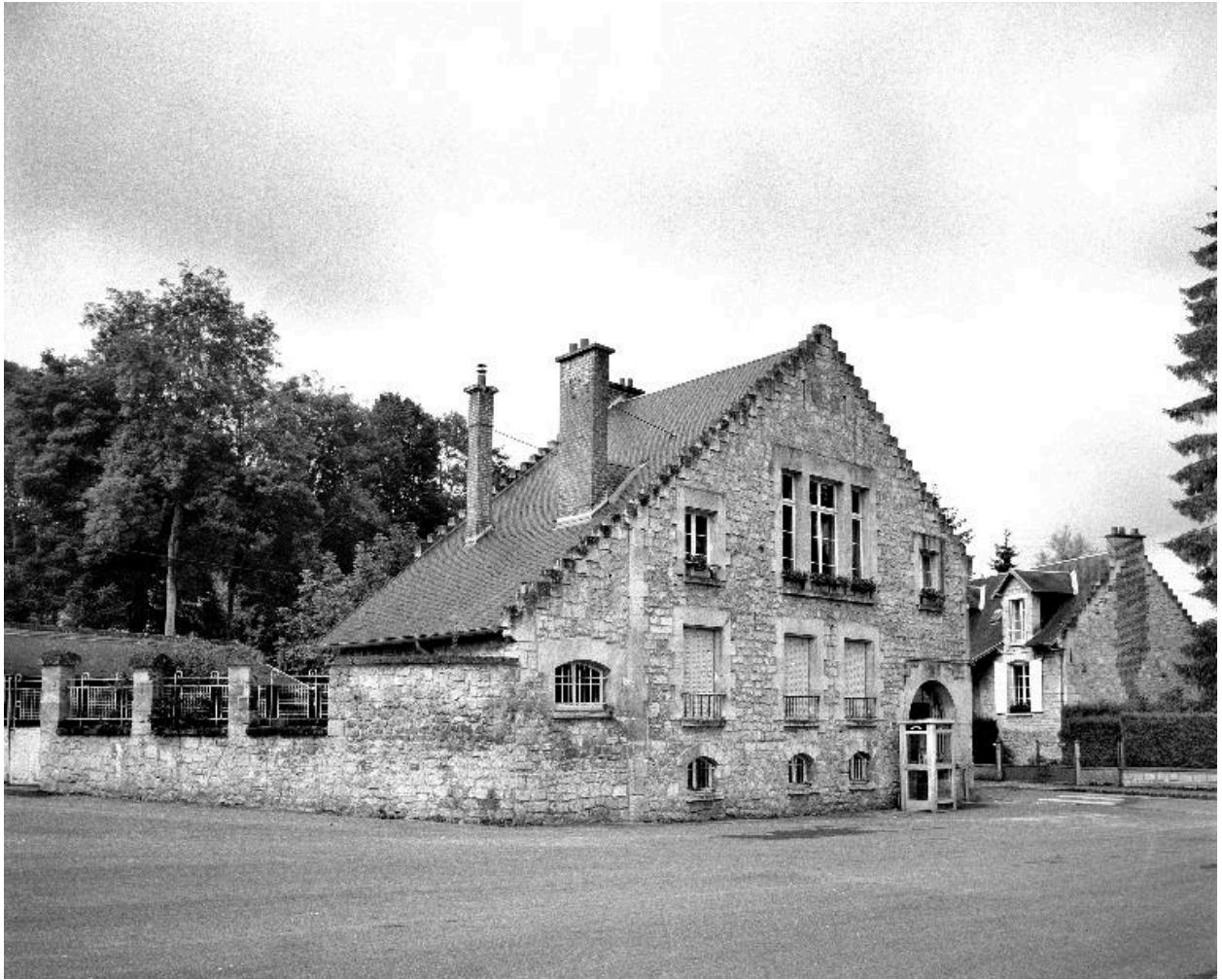
Vue de l'élévation principale nord.