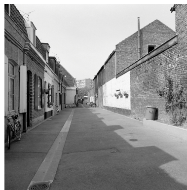
Atelier de fabrication, enfilade rue Roland Garros.