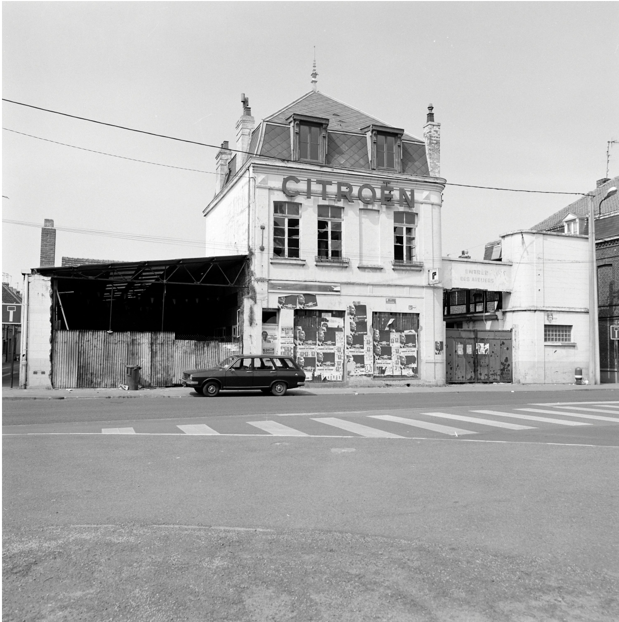
Elévation antérieure, vue du Pont de Beauvais.