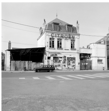
Élévation antérieure, vue du Pont de Beauvais. IVR31_19885900912X