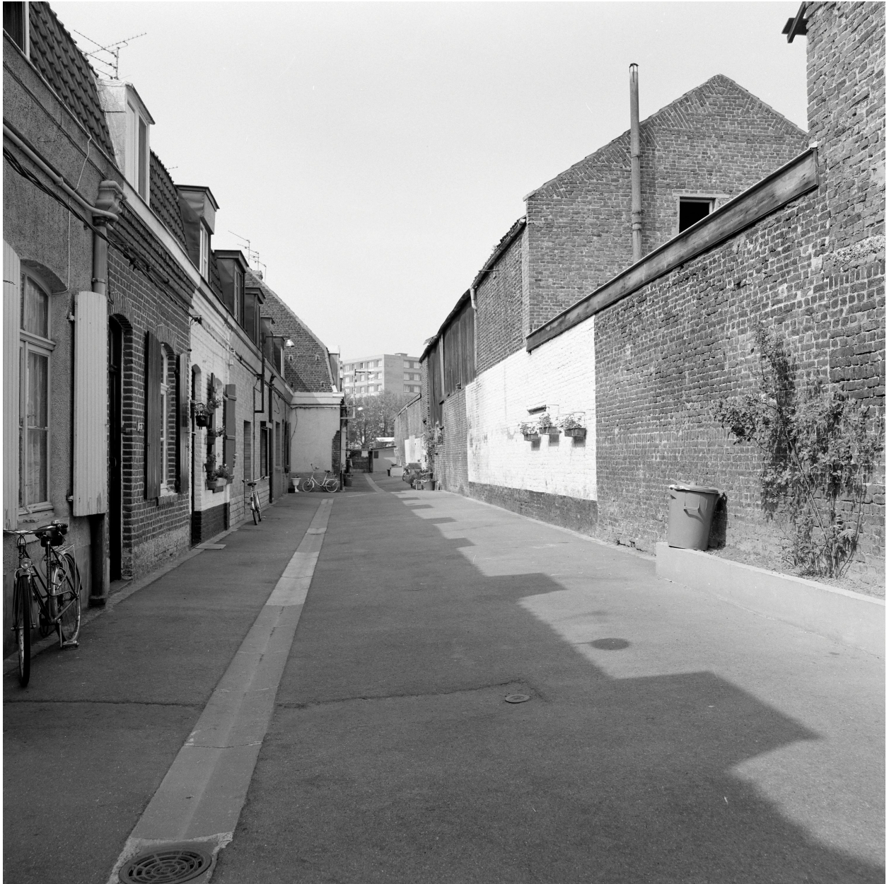
Atelier de fabrication, enfilade rue Roland Garros.