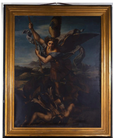
Tableau : Saint-Michel terrassant le dragon, copie d'une oeuvre de Raphaël ou Jules Romain, conservée au musée du Louvre.