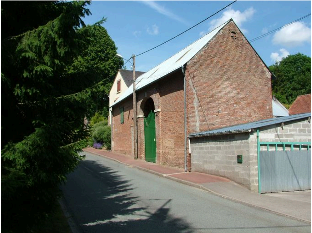
Vue générale depuis la rue, en aval.