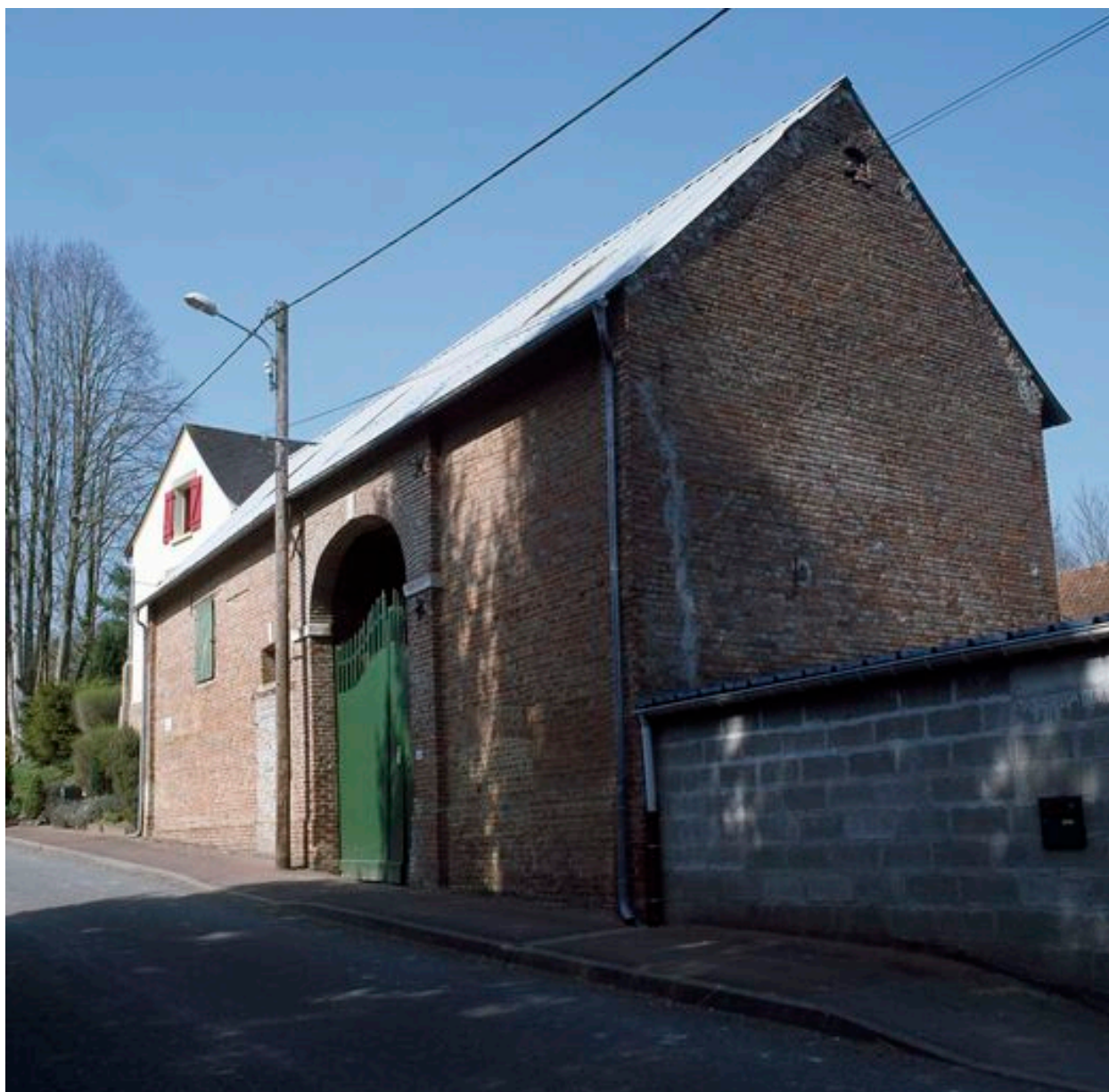
Vue de la grange depuis la rue.