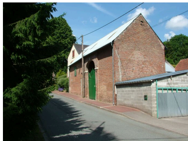
Vue générale depuis la rue, en aval. IVR22_20108001755NUCA