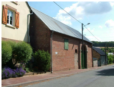
Vue générale depuis la rue, en amont. IVR22_20108001756NUCA