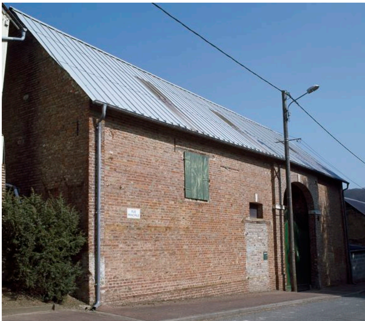
Vue de la grange depuis la rue.