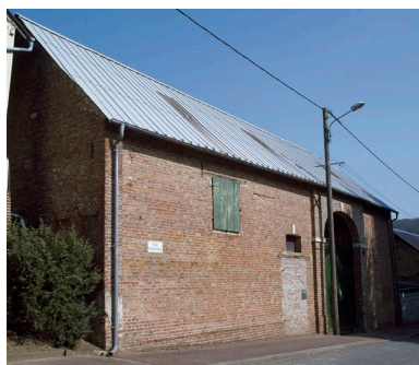
Vue de la grange depuis la rue. IVR22_20118000265XA