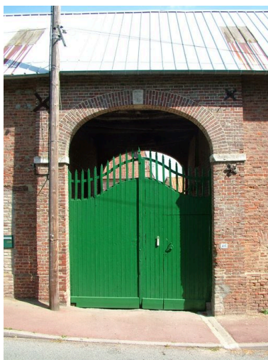
Porte charretière. IVR22_20108001754NUCA