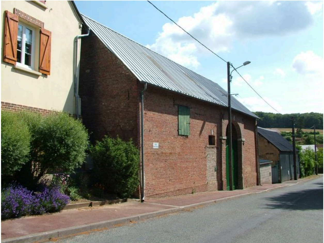
Vue générale depuis la rue, en amont.