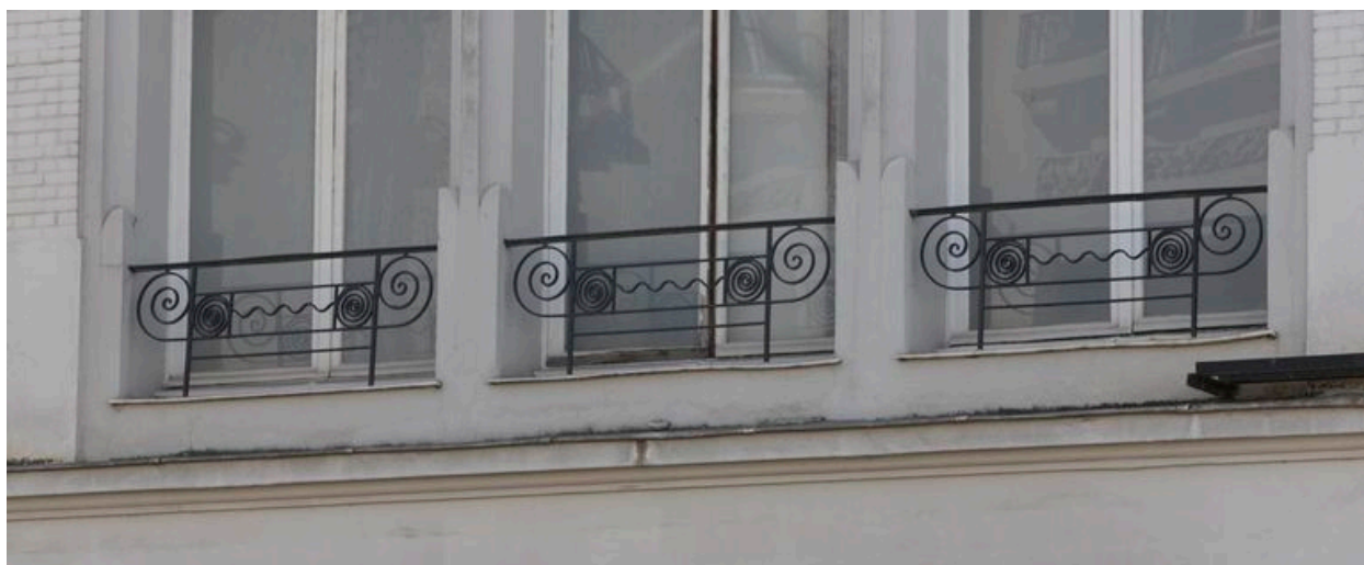
Décor en spirales des garde-corps.