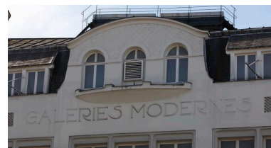
Fronton marqué par des décors et un lettrage géométrique. IVR31_20096200258NUCA