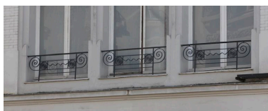
Décor en spirales des garde-corps. IVR31_20096200259NUCA