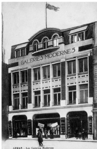
Arras. Les galeries modernes. Carte postale, vers 1925 (AD Pas de Calais ; 38 FI 983).

Phot. Thibaut Pierre (reproduction) IVR31_20096200060XB