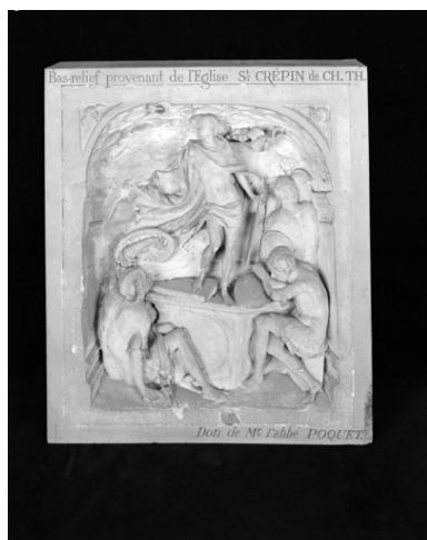
Panneau de retable en albâtre sculpté, 16e siècle, provenant de l'église Saint-Crépin. Collections de la S.H.A.C.T.