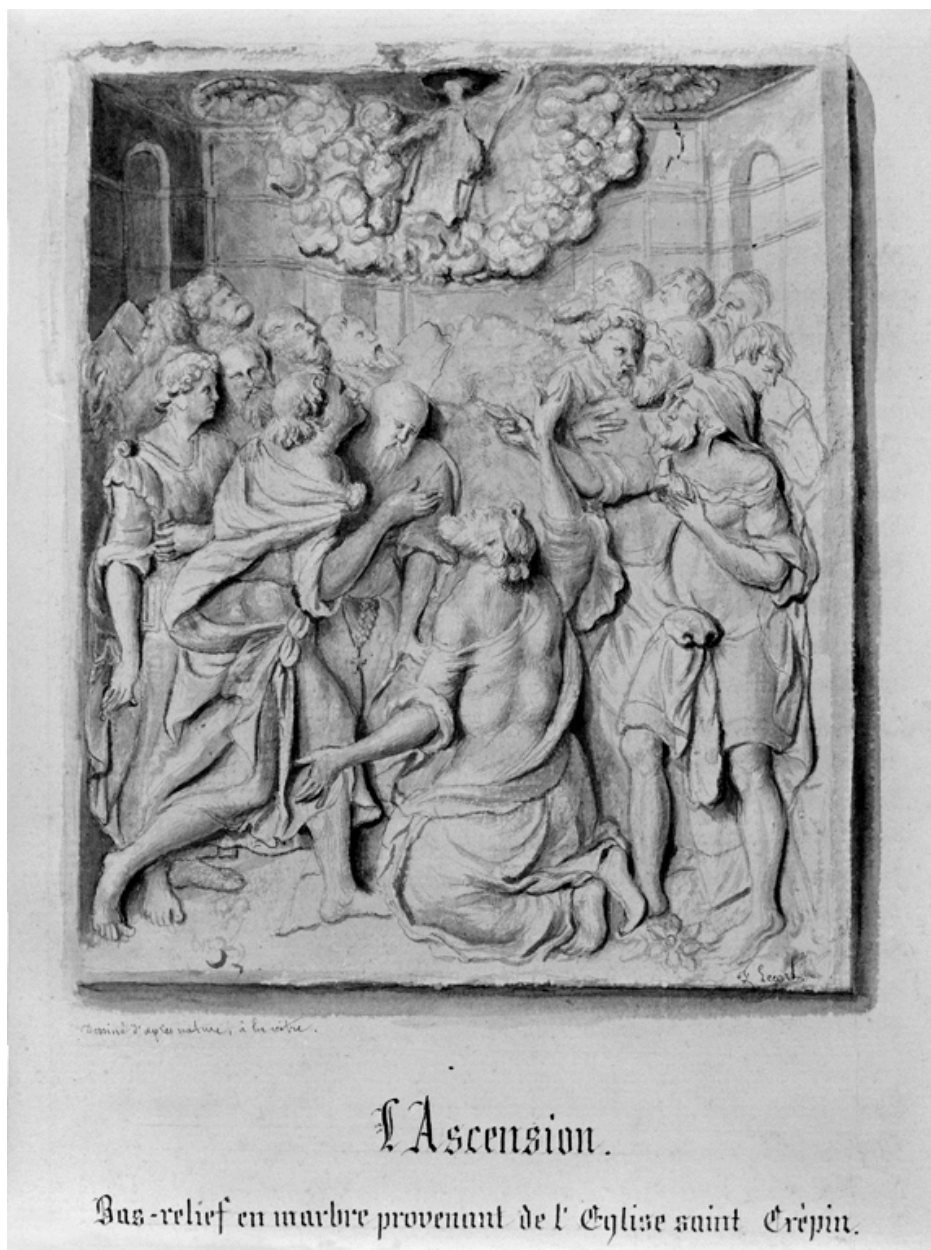
L'Ascension, fragment de retable en albâtre provenant du choeur de l'église Saint-Crépin ; dessin de Lecart, bibliothèque municipale.