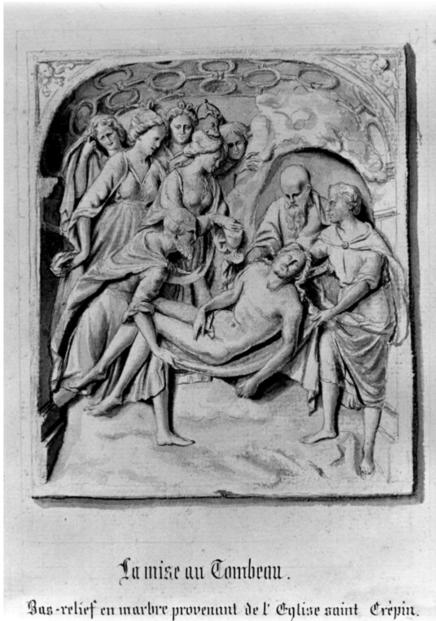
Fragment de retable en albâtre provenant du chœur de l'église Saint-Crépin ; dessin de Lecart, bibliothèque municipale.