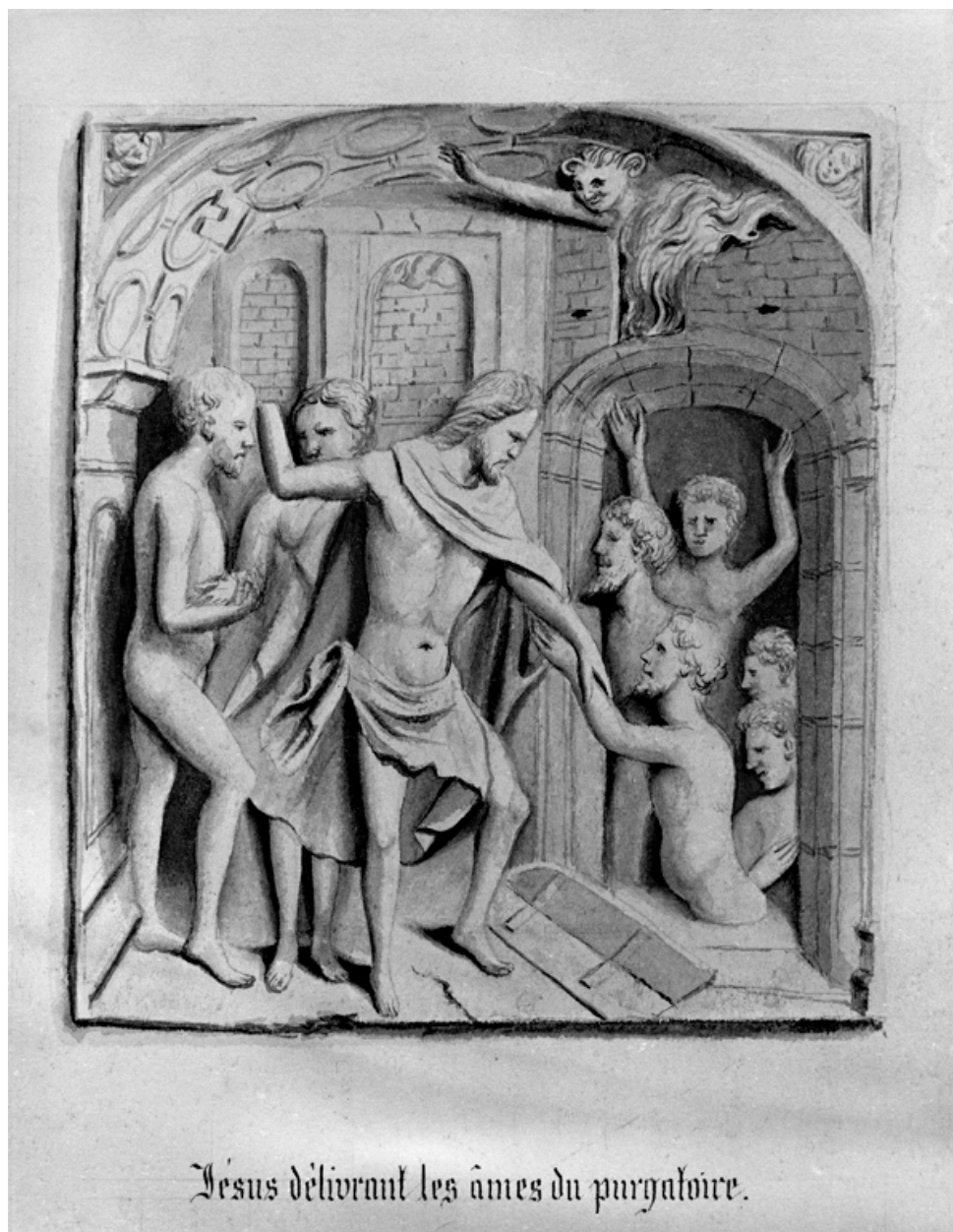
Fragment de retable en albâtre provenant de l'église Saint-Crépin ; dessin de Lecart, bibliothèque municipale.