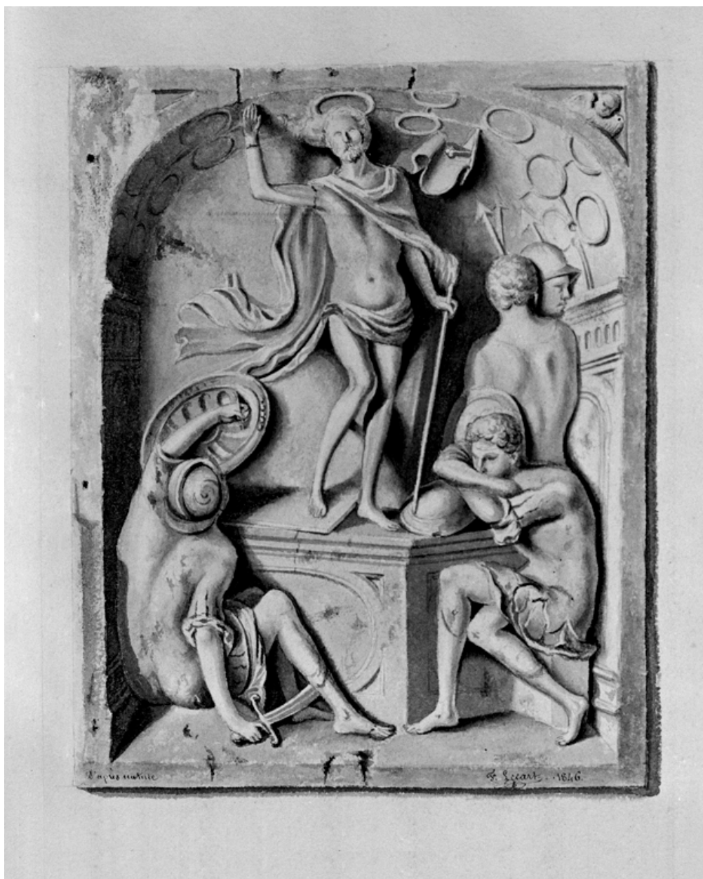
Fragment de retable en albâtre provenant du chœur de l'église Saint-Crépin ; dessin de Lecart, bibliothèque municipale.