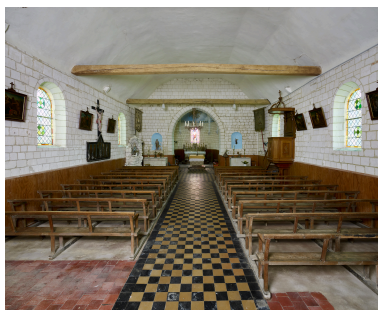
Intérieur, vue de la nef depuis le portail occidental. IVR32_20248001204NUCA