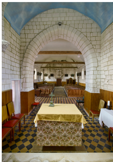
Intérieur, vue de la nef depuis le chœur.