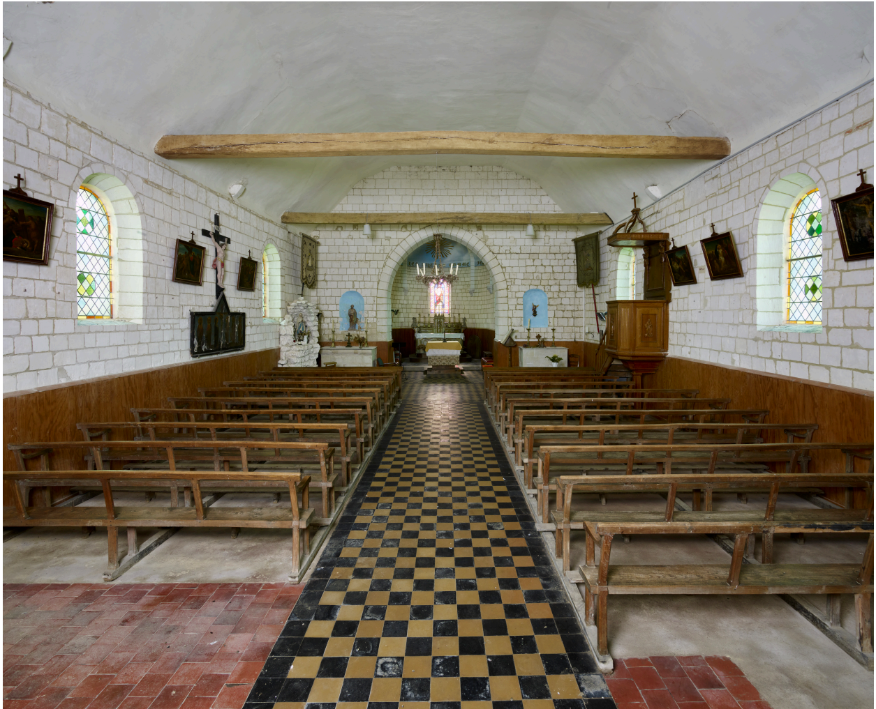
Intérieur, vue de la nef depuis le portail occidental.