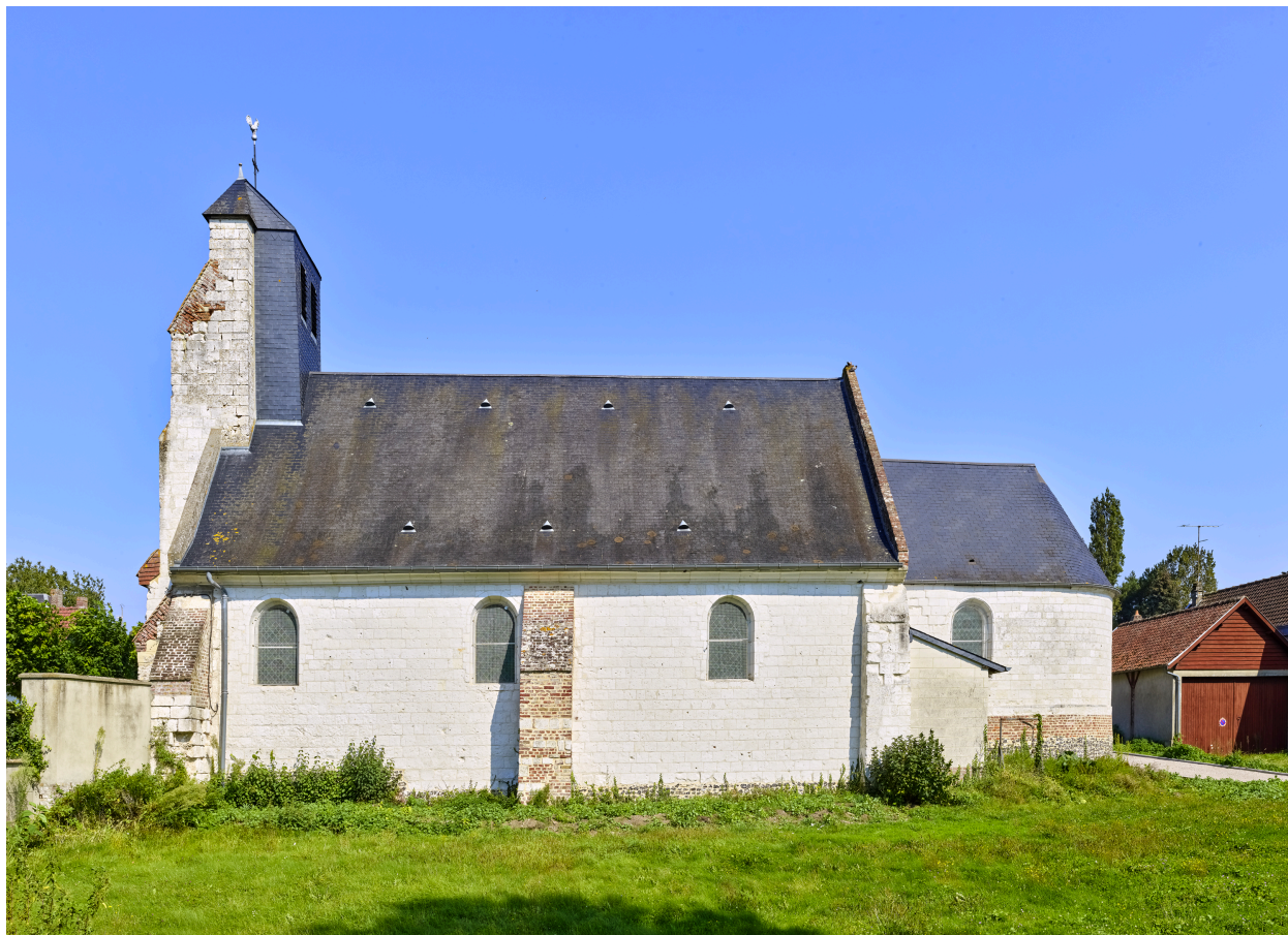
Vue de l'élévation sud.