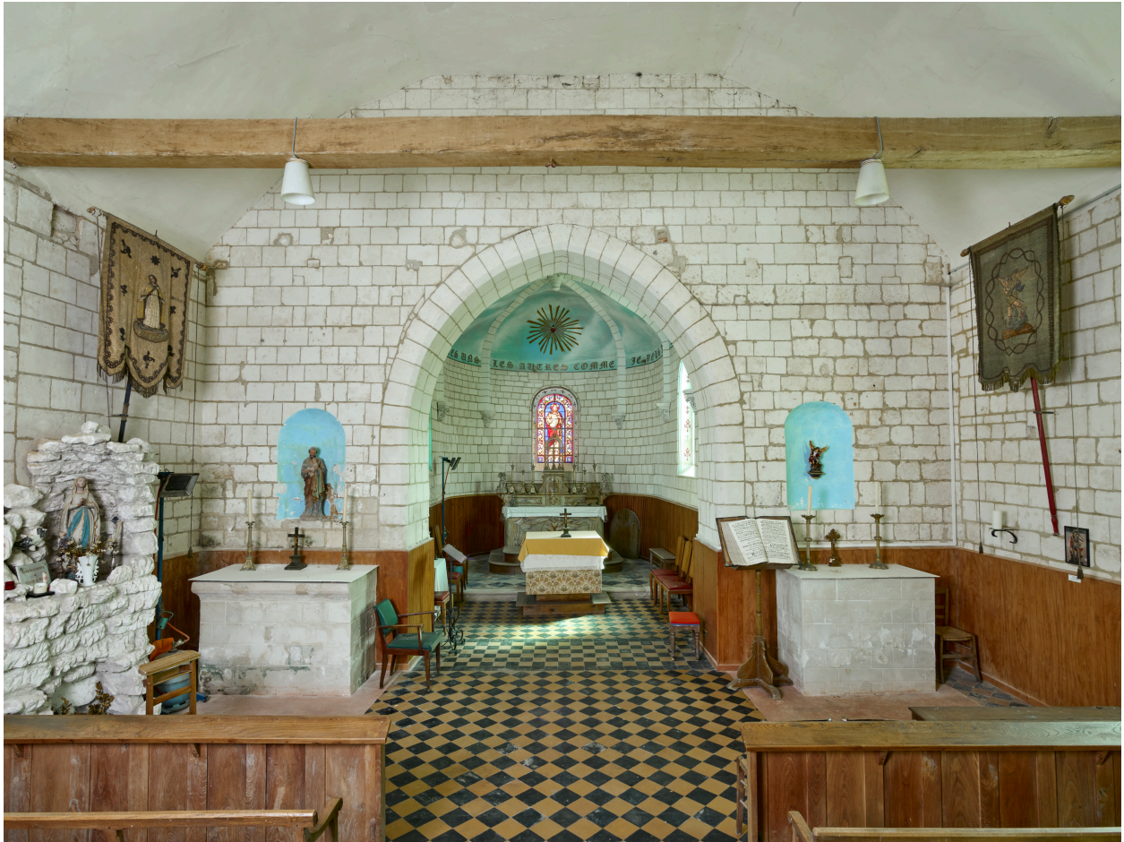
Intérieur, vue du chœur depuis la nef.