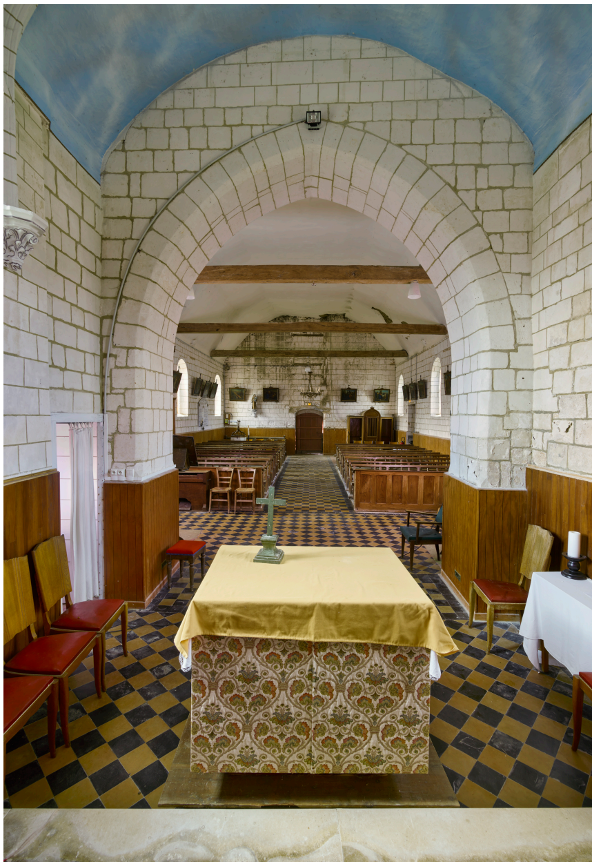
Intérieur, vue de la nef depuis le chœur.