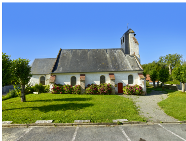
Vue de l'élévation nord.

Repro. Abbeville, archives et bibliothèque patrimoniale