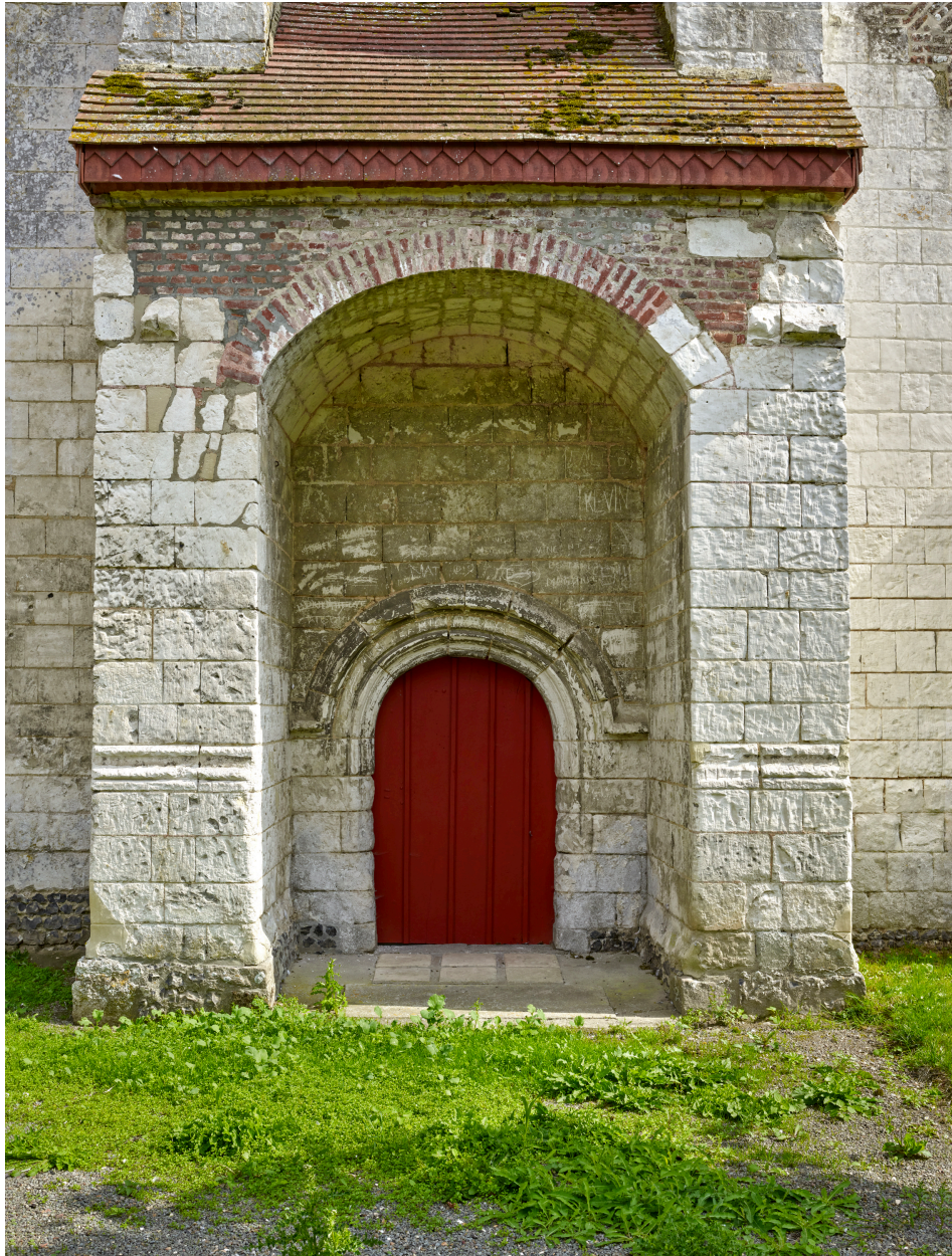
Détail du porche, depuis l'ouest.