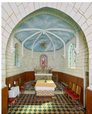
Intérieur, aménagement du chœur. IVR32_20248001207NUCA