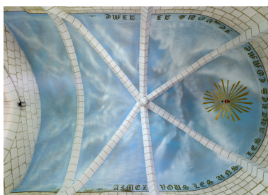
Intérieur, détail de la voûte du chœur.