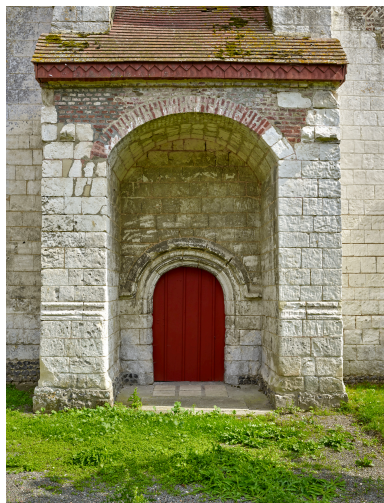
Détail du porche, depuis l'ouest. IVR32_20248001201NUCA