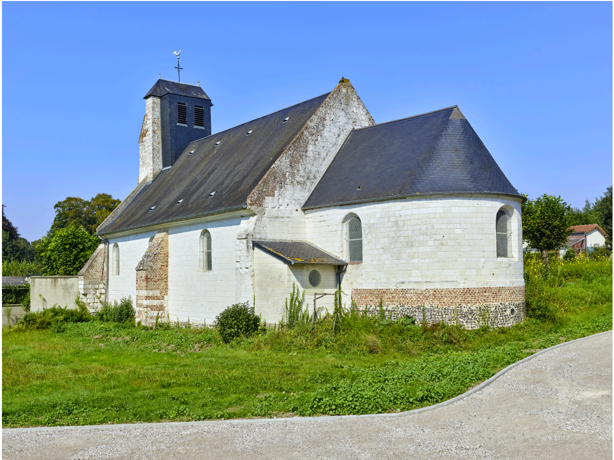
Vue du chevet et de la sacristie, depuis le sud-est.