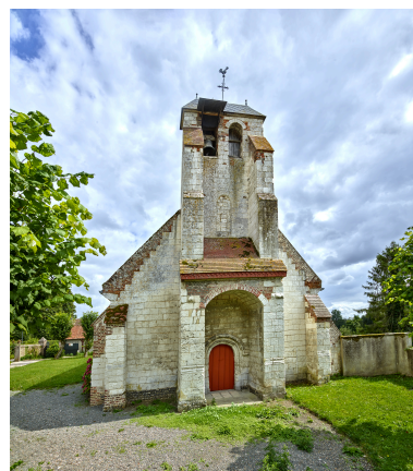
Vue du portail et du clocher, depuis l'est. IVR32_20248001200NUCA