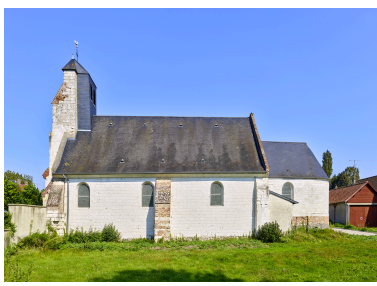
Vue de l'élévation sud.