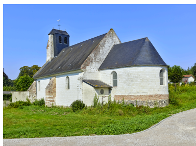
Vue du chevet et de la sacristie, depuis le sud-est.