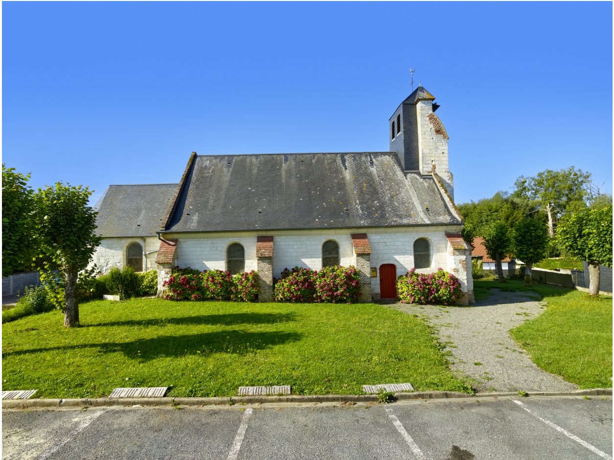
Vue de l'élévation nord.