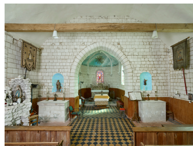
Intérieur, vue du chœur depuis la nef.