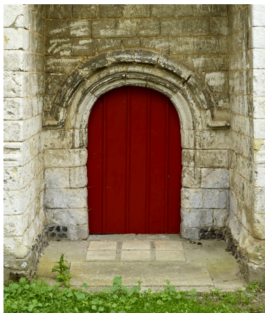
Détail du portail occidental. IVR32_20248001202NUCA