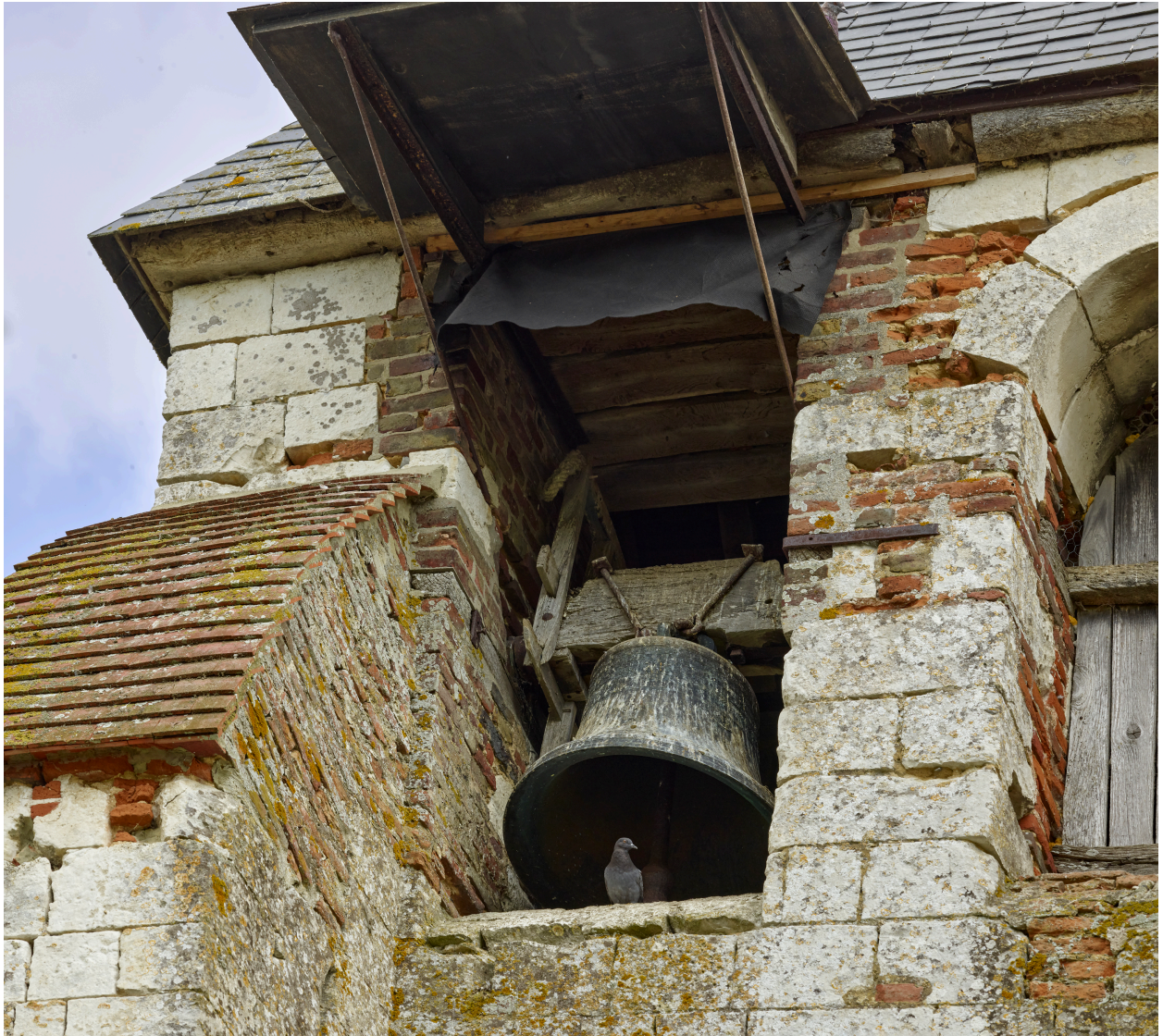
Détail de la cloche, depuis l'ouest.