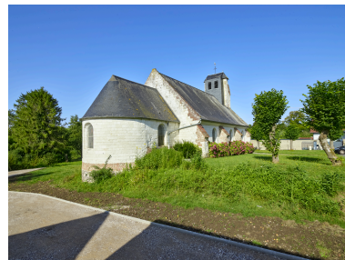
Vue du chevet, depuis l'est. IVR32_20248001195NUCA