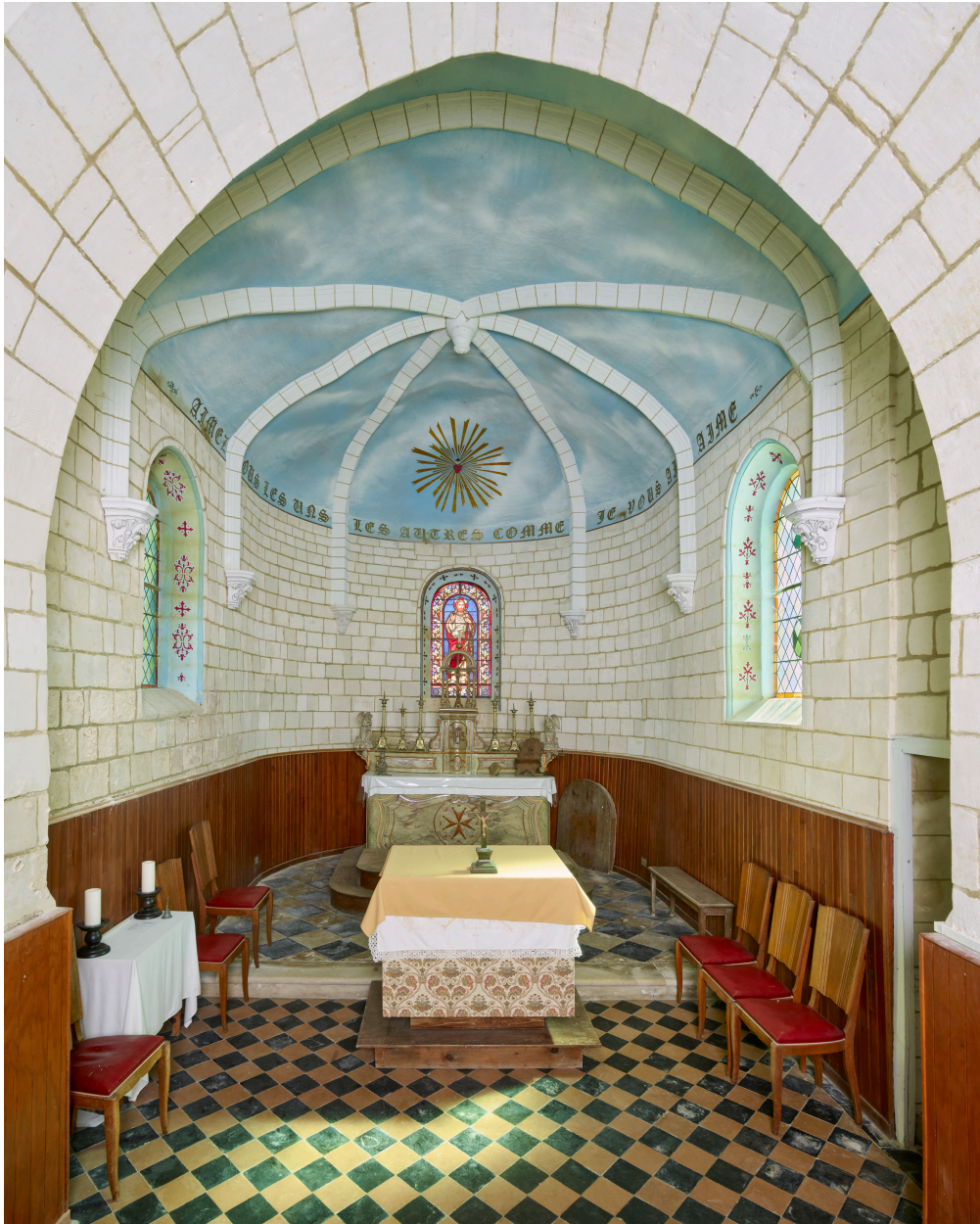
Intérieur, aménagement du chœur.