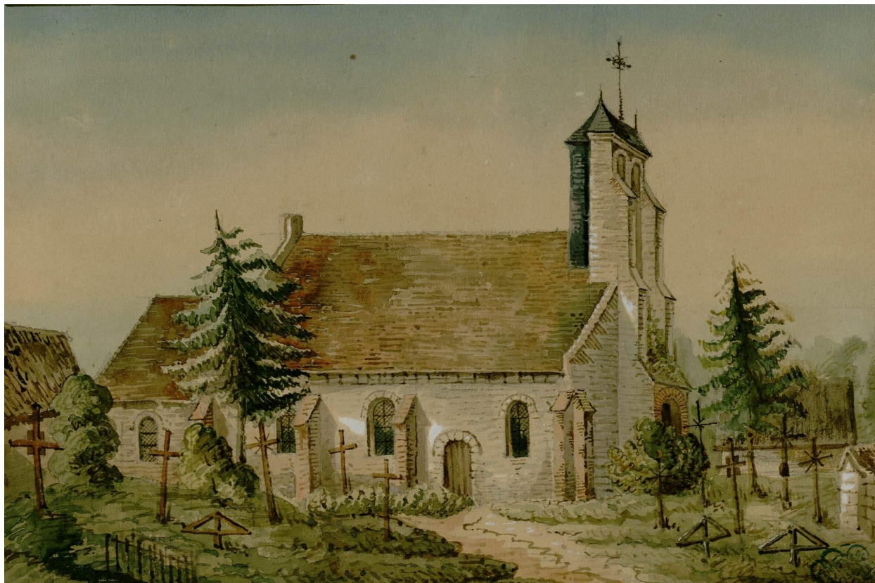
Église d'Épagnette dédiée à Saint-Michel, par Oswald Macqueron, d'après nature, 14 mai 1850 (Archives et Bibliothèque patrimoniale d'Abbeville ; Ab.M40).