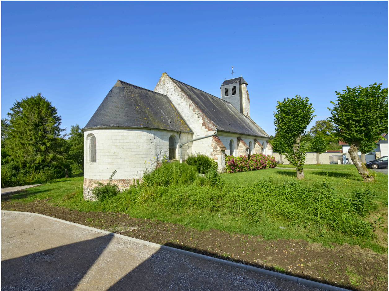
Vue du chevet, depuis l'est.