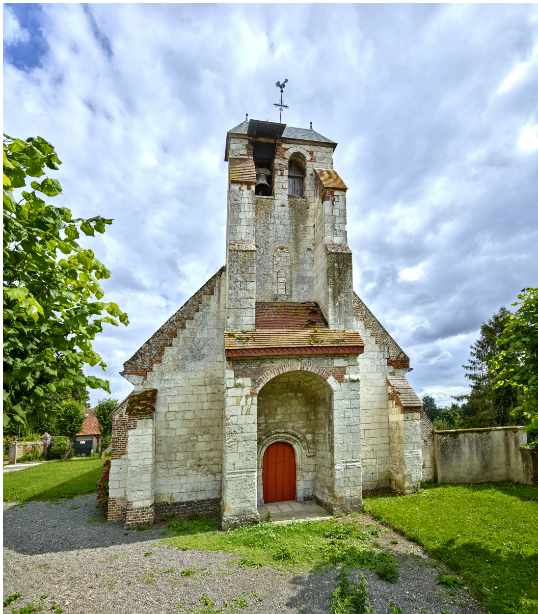
Vue du portail et du clocher, depuis l'est.