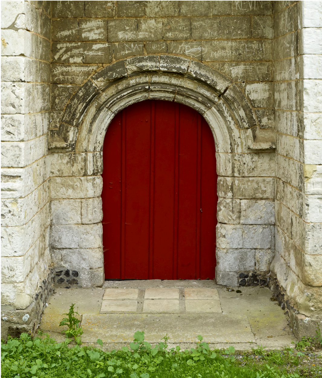
Détail du portail occidental.