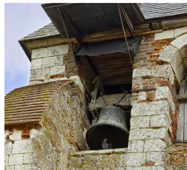
Détail de la cloche, depuis l'ouest. IVR32_20248001203NUCA