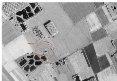
Situation de l'édifice le 15/08/1983. IVR32_20175900171NUCA

Situation de l'édifice sur un plan des installations allemandes au 29/12/1915. IVR32_20175900170NUCA