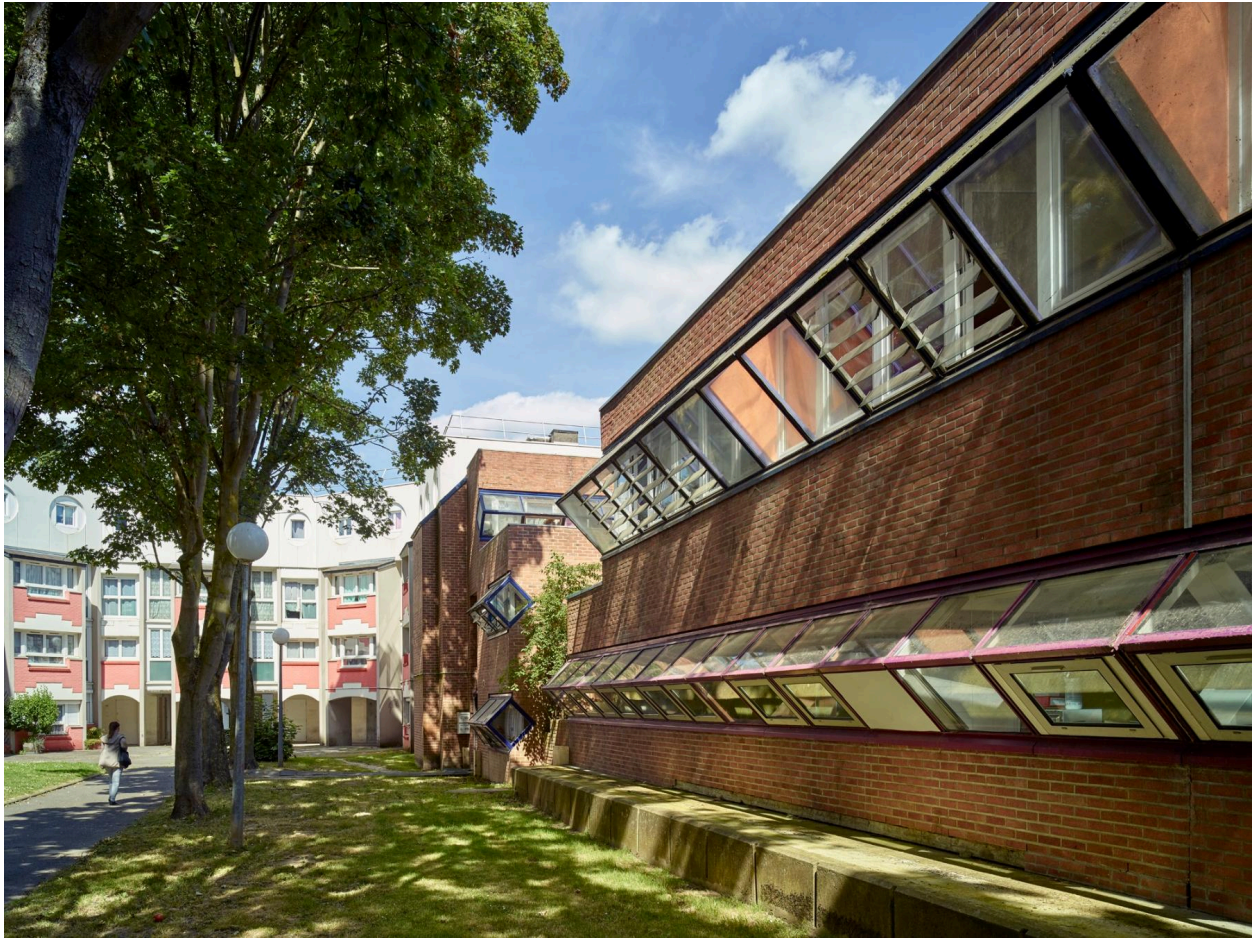
La façade sur la cour partagée avec l'îlot 15d.