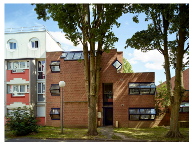
Détail de la façade des logements de fonction, juxtaposés aux immeubles de l'îlot 15d, avec lequel le groupe scolaire partage la cour sud.