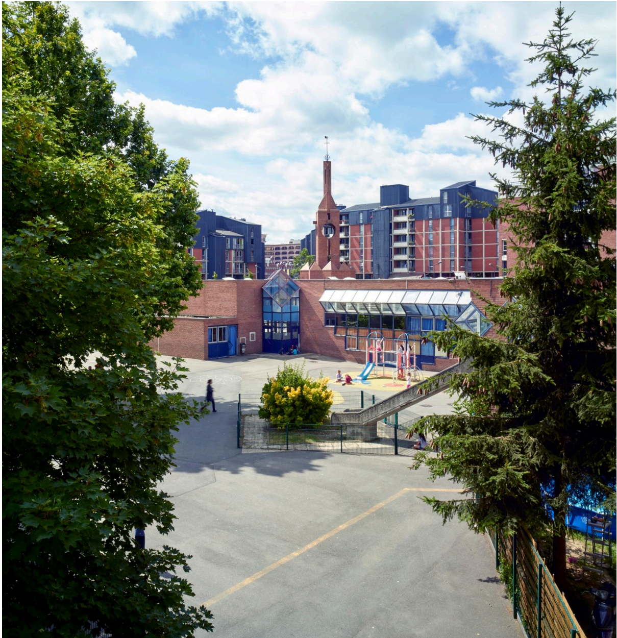
La façade arrière et la cour de récréation depuis l'îlot 15d voisin. Au fond la place de Venise et le clocher de la chapelle Saint-Marc.