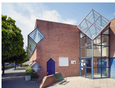
La façade sur la rue Vermeer depuis l'angle sud-est du groupe scolaire.