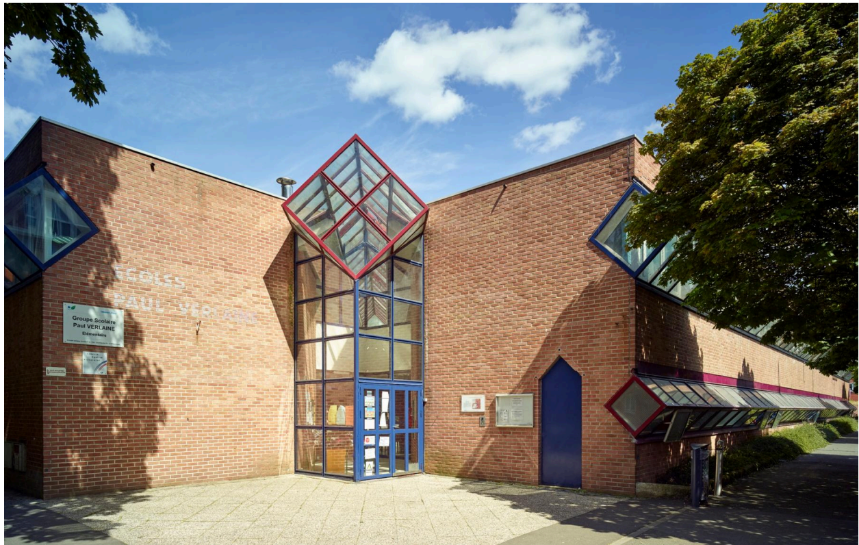
L'entrée et la façade sur la rue Vermeer.