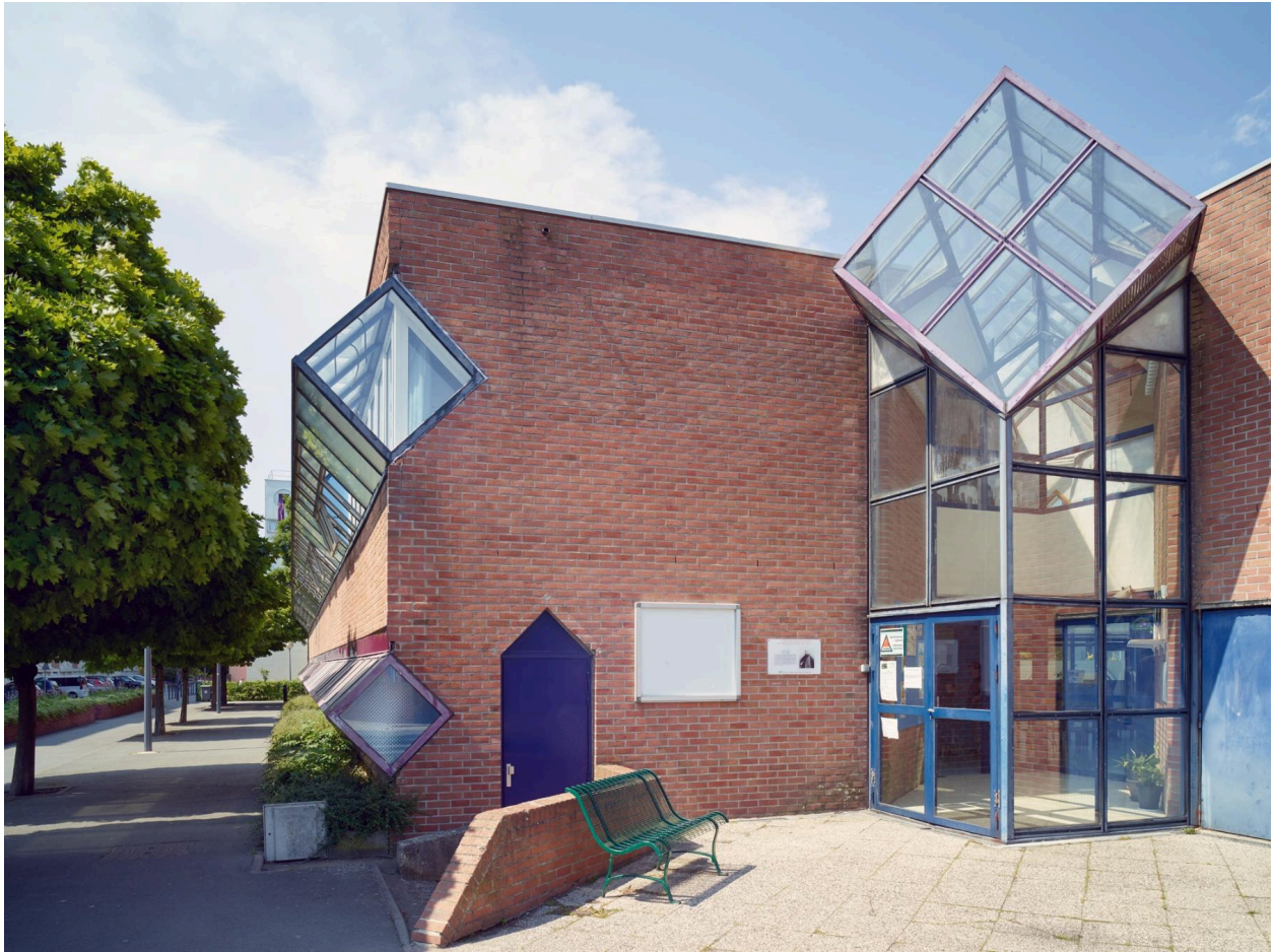
La façade sur la rue Vermeer depuis l'angle sud-est du groupe scolaire.