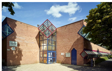
L'entrée et la façade sur la rue Vermeer.