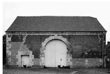
Grange.