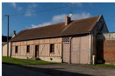
Logis prolongé d'une porte piétonne et d'une entrée charretière, n°20 Grande Rue, vue depuis le sud-est.