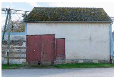
Grange sur rue avec entrée charretière, n°35 Grande Rue, vue depuis le nord. IVR32_20226000058NUCA