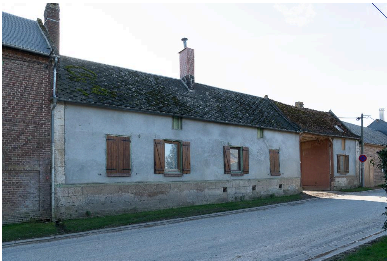
Logis de ferme sur rue prolongé d'une entrée charretière, n°19 Grande Rue, vu depuis le nord-est.