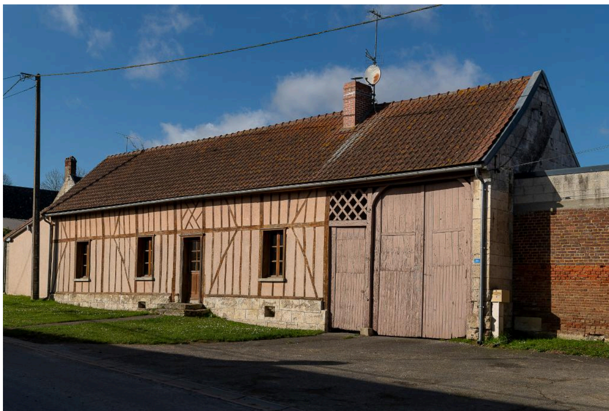
Logis prolongé d'une porte piétonne et d'une entrée charretière, n°20 Grande Rue, vue depuis le sud-est.