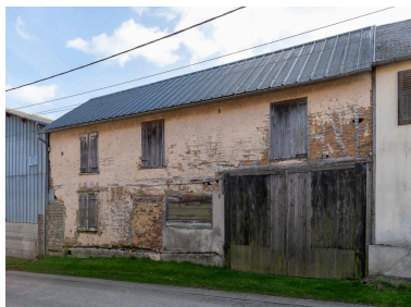
Ancienne maison de serger avec logis et atelier, n°4 rue du Calvaire, vue depuis l'ouest.