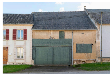
Ancien atelier de serger (?), n°31 Grande Rue, vue depuis le nord.