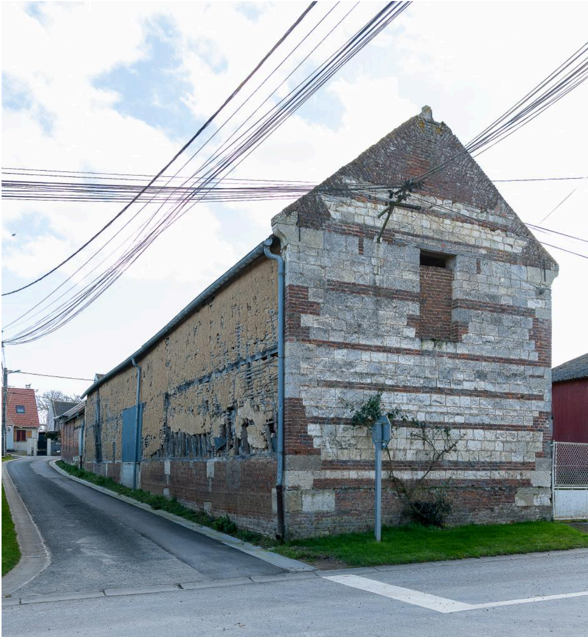
Bâtiments agricoles avec pignon en pierre et brique, n°39 Grande Rue, vue depuis le nord.