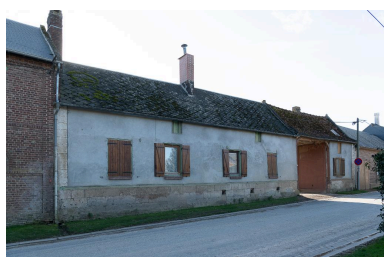
Logis de ferme sur rue prolongé d'une entrée charretière, n°19 Grande Rue, vu depuis le nord-est.