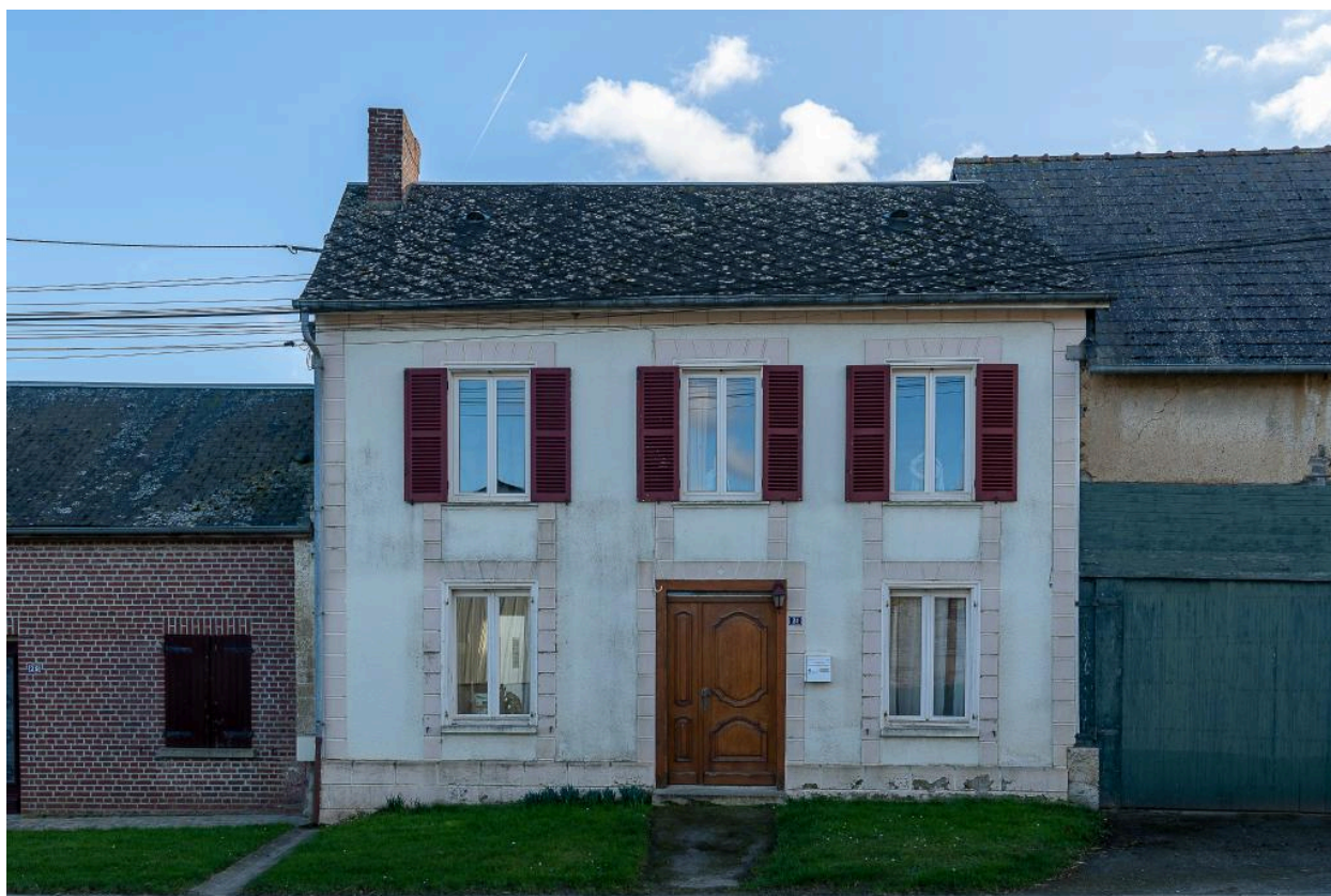
Ancien commerce (?), n°31 Grande Rue, vue depuis le nord.