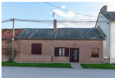
Ancien commerce, n°29 Grande Rue, vue depuis le nord. IVR32_20226000052NUCA