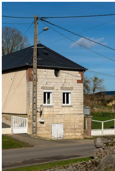
Vue depuis le sud du pignon en pierre du logis au n°42 Grande Rue.