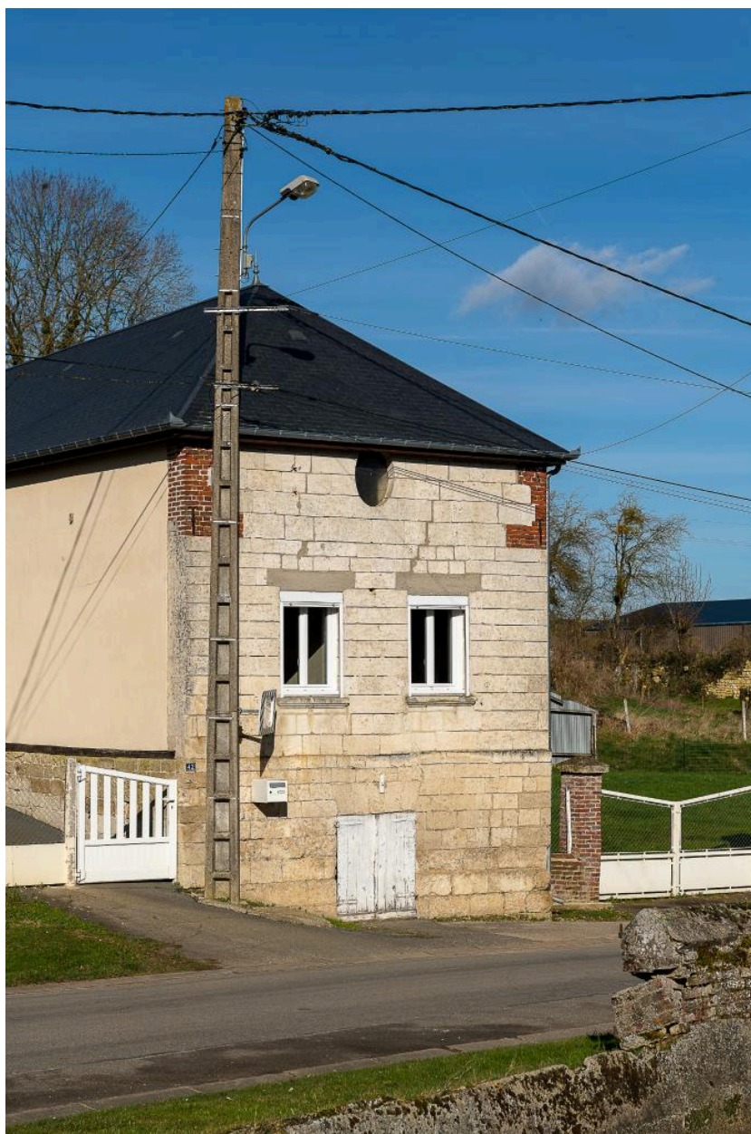
Vue depuis le sud du pignon en pierre du logis au n°42 Grande Rue.