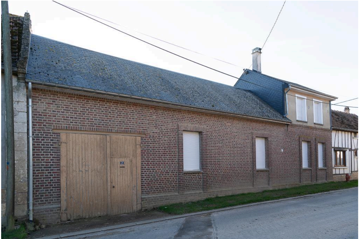
Logis sur rue reconstruit au milieu du 20e siècle, n°21 Grande Rue, vue depuis le nord-est.