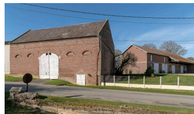
Grange et bâtiment d'étable en arrière-plan construits dans le 1er quart du 20 e siècle (?), n°42 Grande Rue.