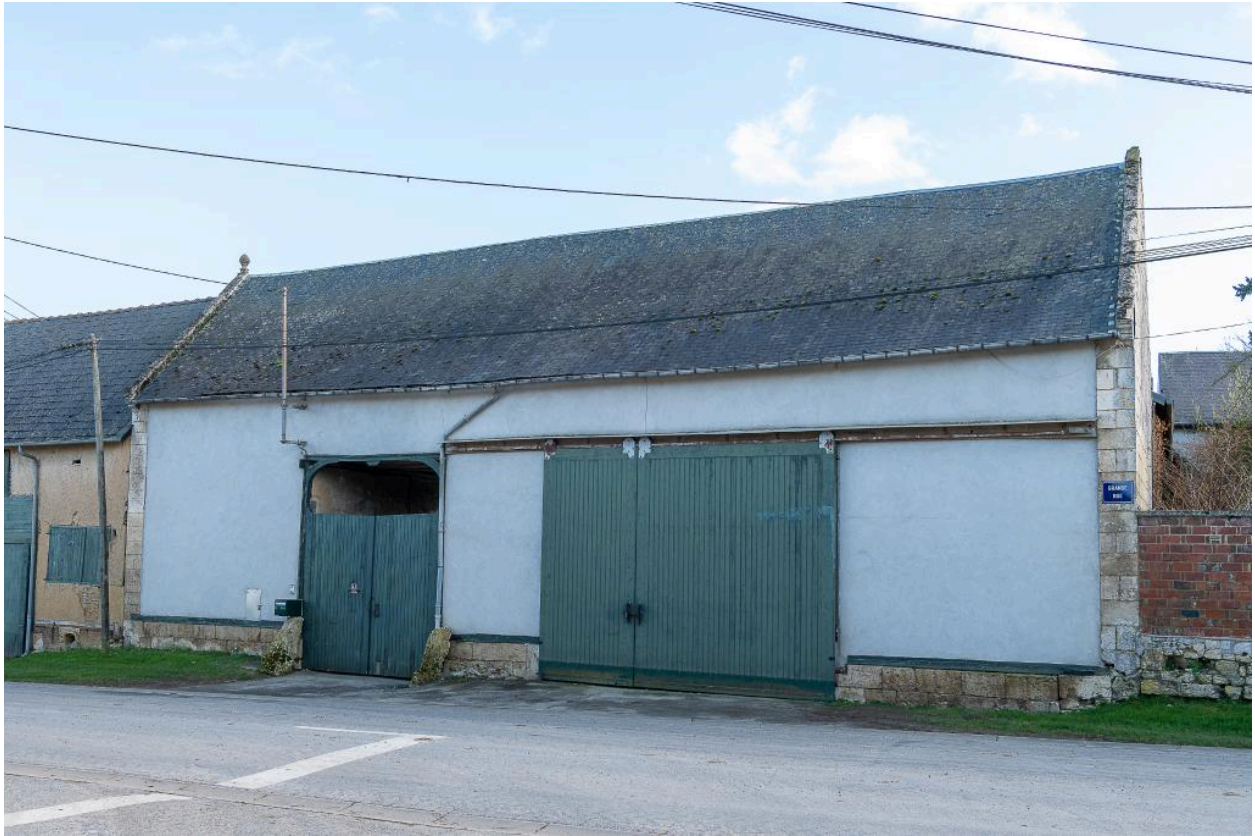
Grange sur rue avec entrée charretière, n°33 Grande Rue, vue depuis le nord.