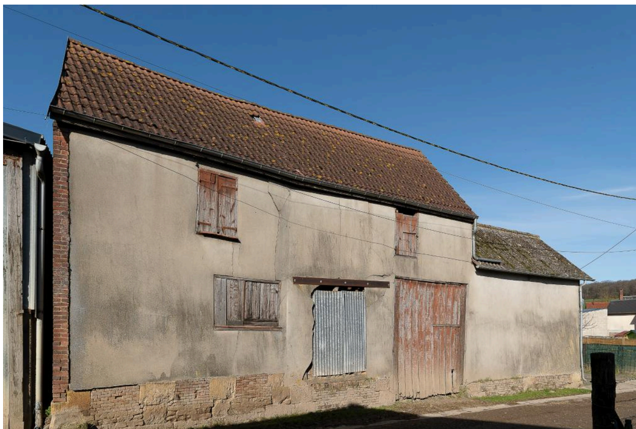
Ancien bâtiment de grange avec entrée charretière et atelier de serger (?), n°25 Grande Rue (côté rue du Colombier).