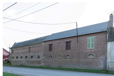
Bâtiments agricoles au n°19 Grande Rue, vue depuis le nord.