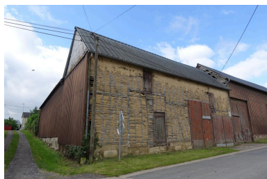
Grange de la ferme au n°41 Grande Rue, vue depuis le nord-est. IVR32_20226005005NUCA