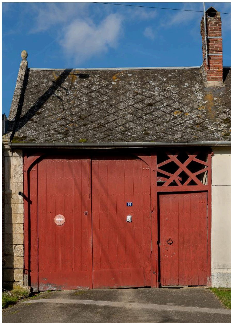
Porte charretière et entrée piétonne surmontée d'une imposte ajourée, n°18 Grande rue, vue depuis le sud.