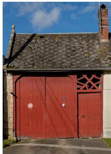
Porte charretière et entrée piétonne surmontée d'une imposte ajourée, n°18 Grande rue, vue depuis le sud.