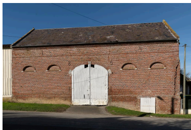
Grange au n°42 Grande rue, vue depuis le sud (date portée : "1854"). IVR32_2022600019NUCA