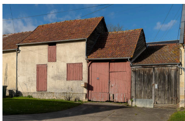
Bâtiment de grange et d'atelier de serger (?) prolongé d'une entrée charretière, n°26 Grande Rue, vue depuis le sud.