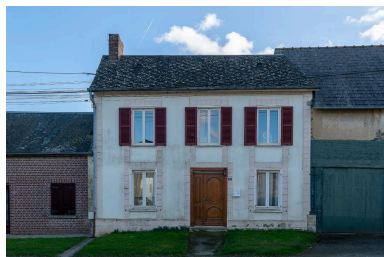
Ancien commerce (?), n°31 Grande Rue, vue depuis le nord. IVR32_20226000051NUCA