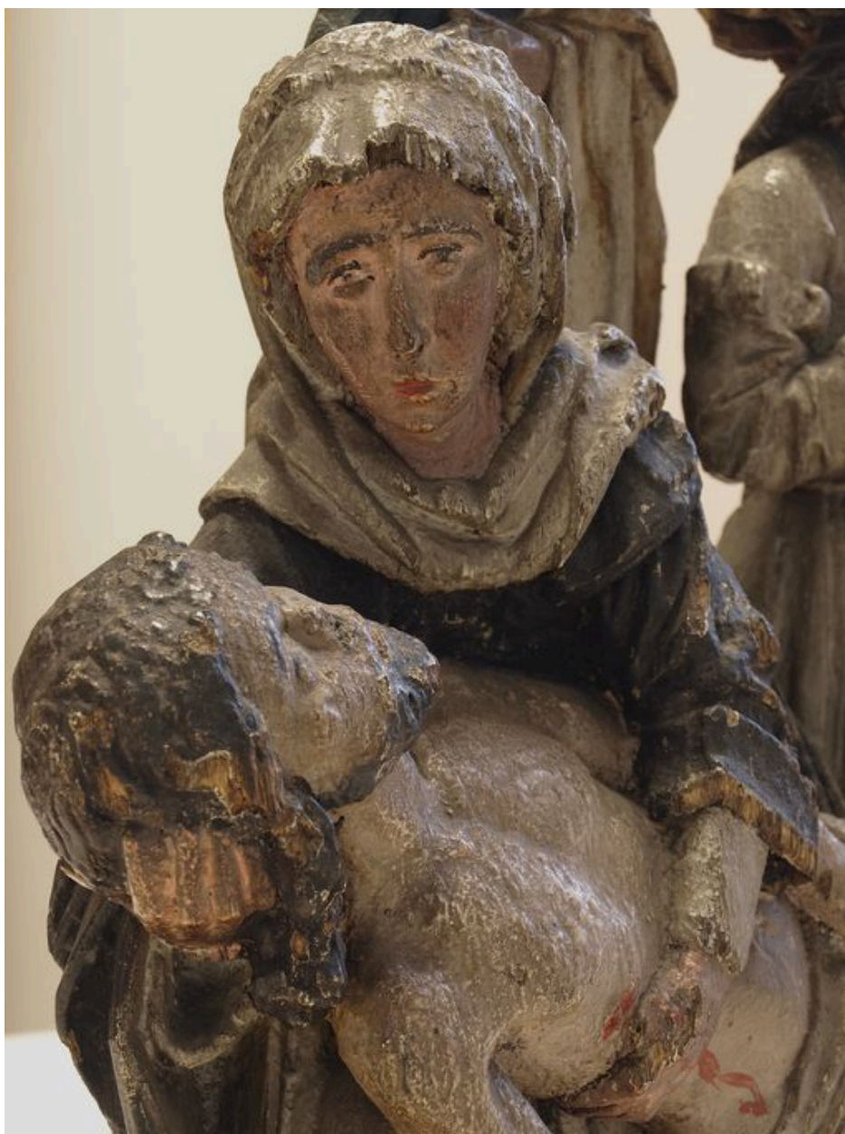
Vue de détail sur les visages de la Vierge et du Christ.