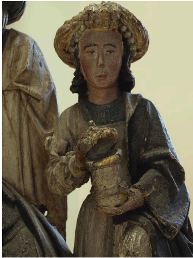
Vue de détail sur Marie Madeleine. IVR31_20106204728NUCA