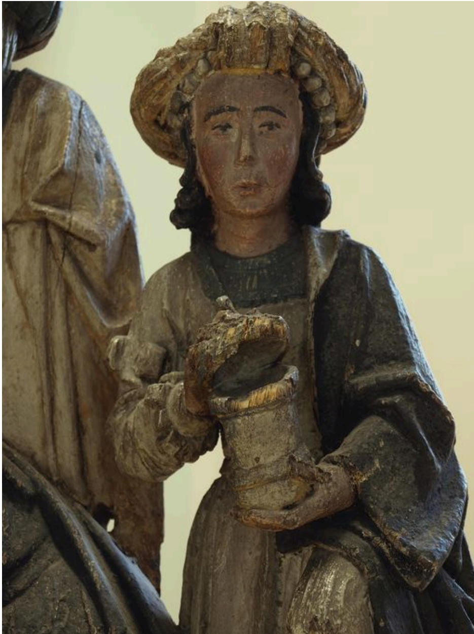
Vue de détail sur Marie Madeleine.