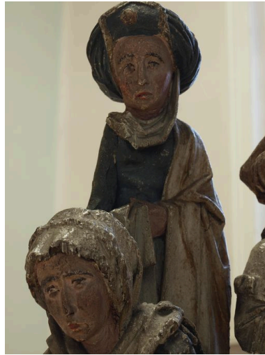
Vue de détail sur une sainte femme. IVR31_20106204729NUCA