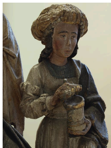
Vue de détail sur Marie Madeleine. IVR31_20106204727NUCA