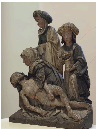
Vue générale. IVR31_20106204723NUCA