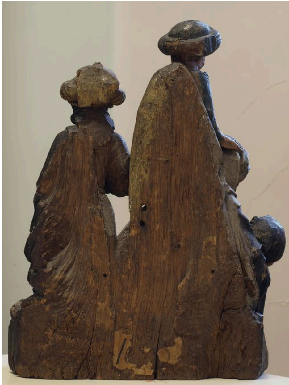
Vue du revers plat.