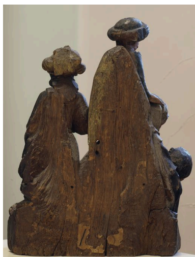
Vue du revers plat. IVR31_20106204725NUCA