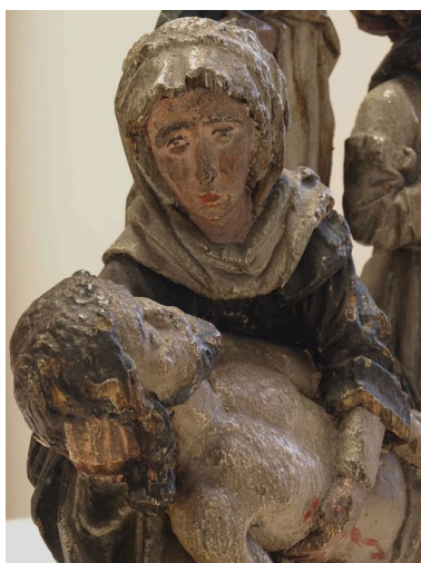
Vue de détail sur les visages de la Vierge et du Christ. IVR31_20106204726NUCA