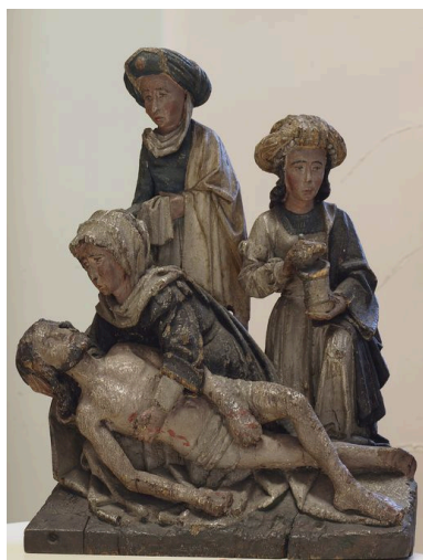
Vue générale. IVR31_20106204722NUCA