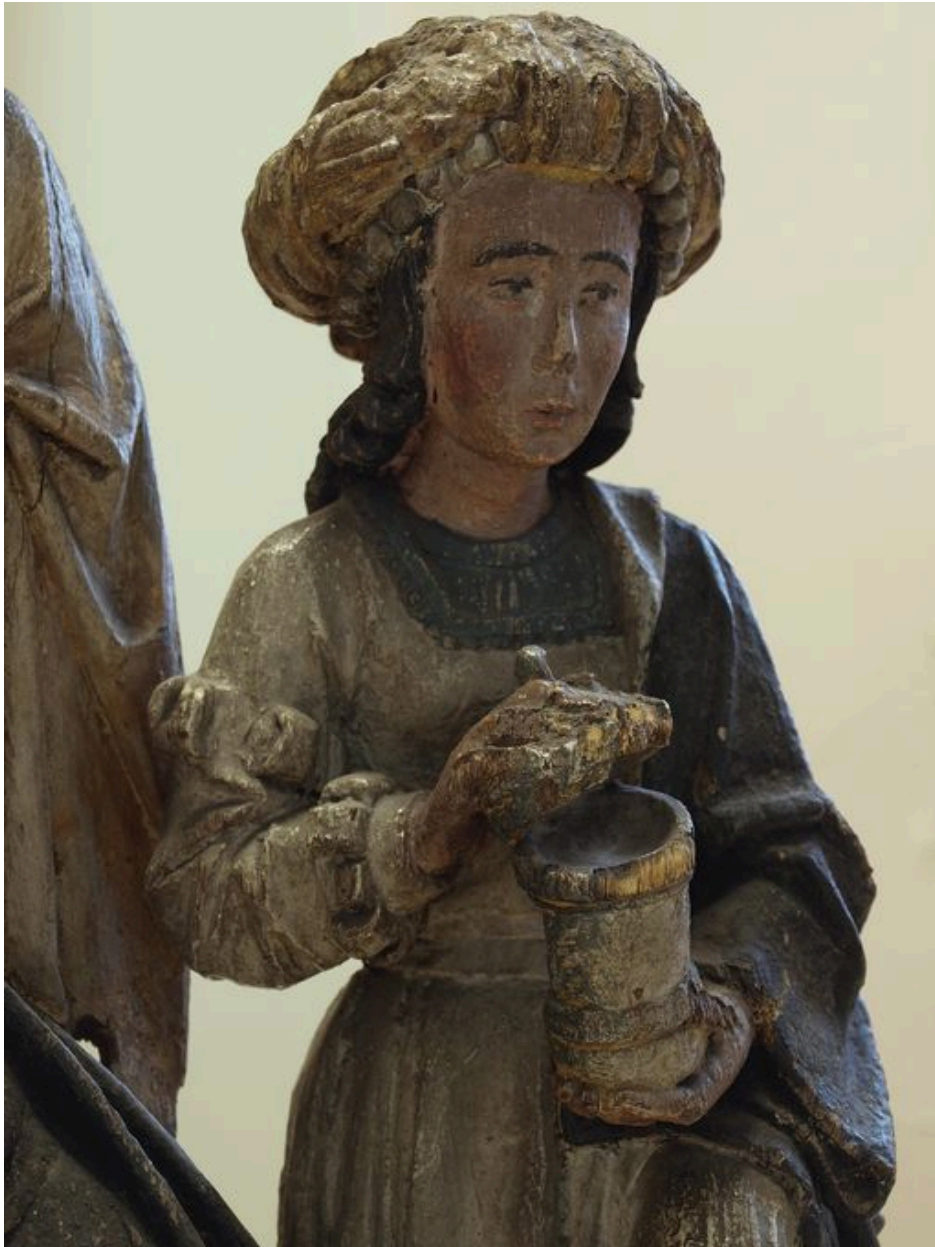
Vue de détail sur Marie Madeleine.