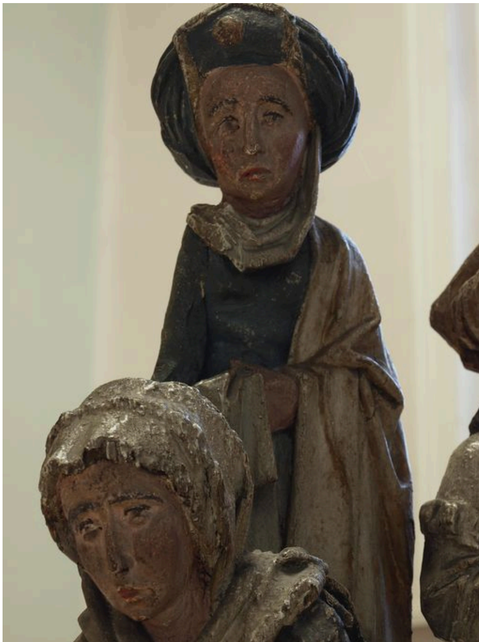
Vue de détail sur une sainte femme.