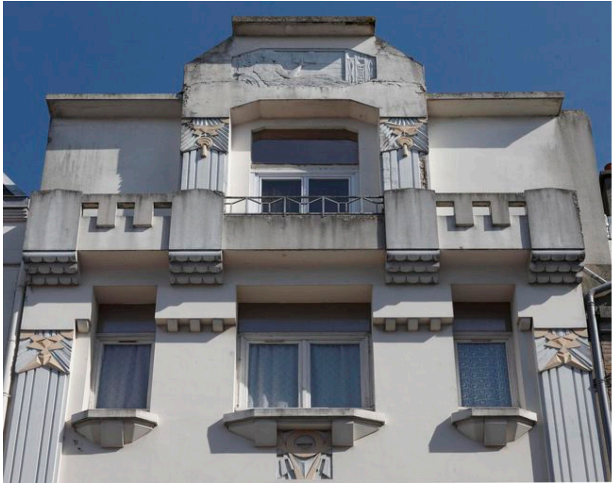
Détail d'un bas-relief : figure allégorique de la Lecture.