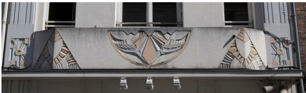
Bandeau aux motifs géométriques.