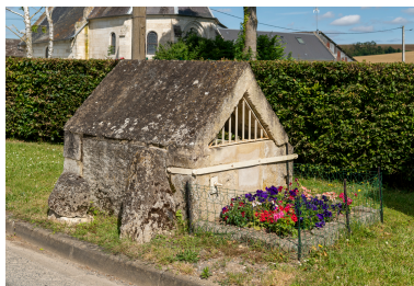
Puits dans la rue des Moissons. IVR32_20246000741NUCA