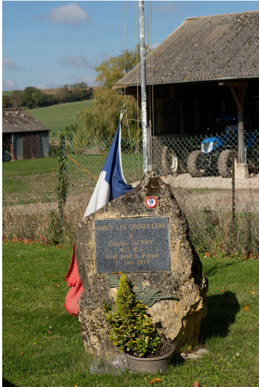
Monument aux morts pour la France.