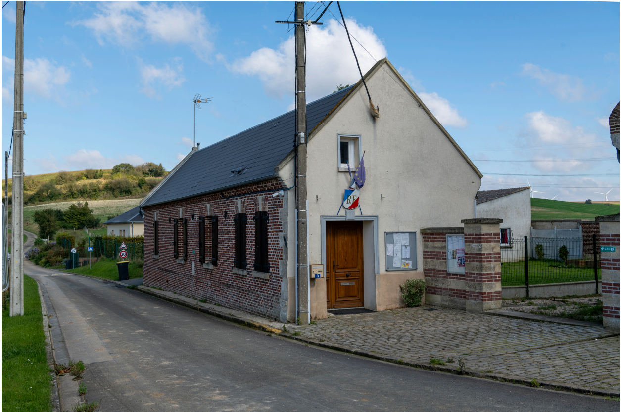
Mairie vue depuis le sud.