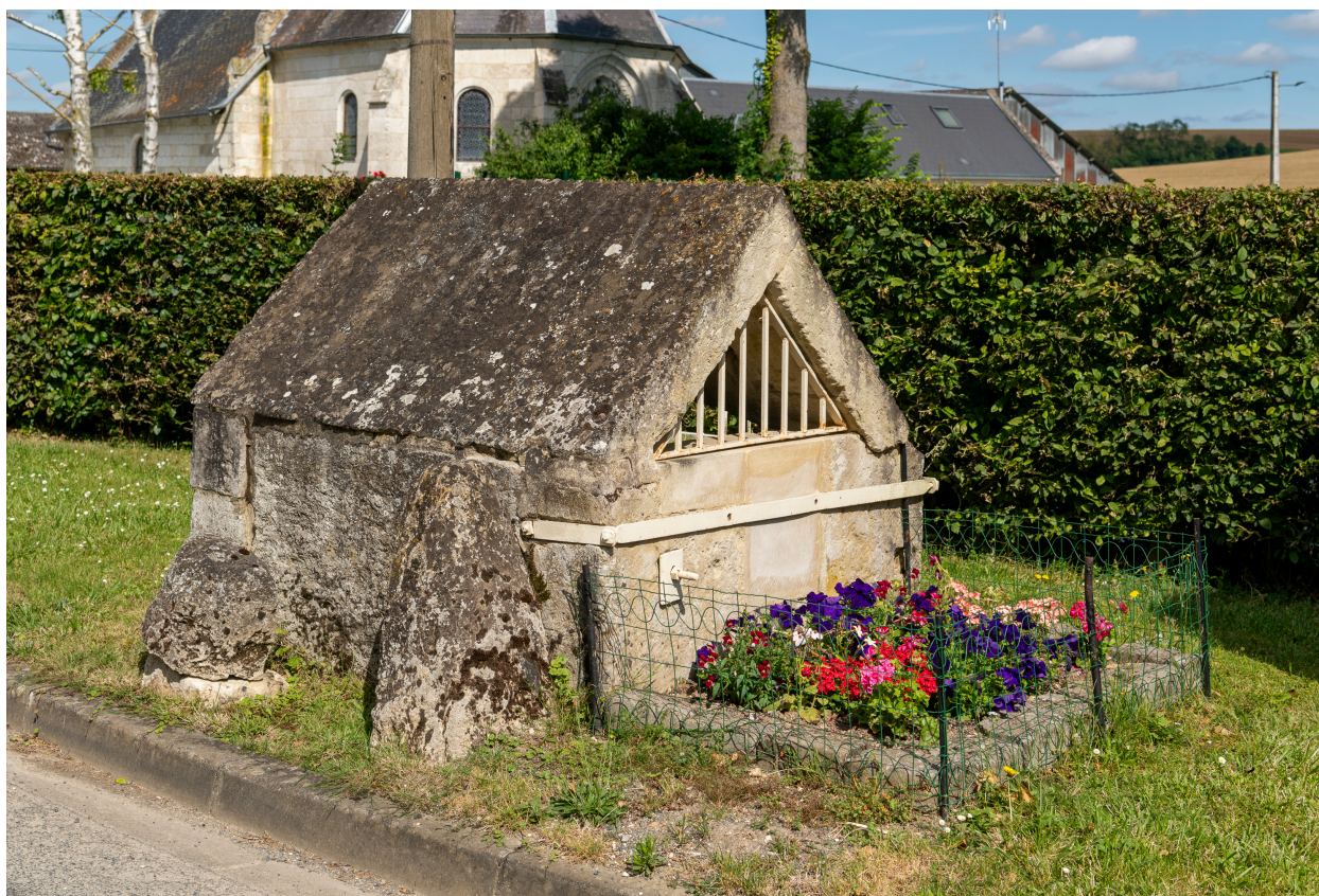
Puits dans la rue des Moissons.