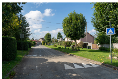
Rue des Moissons, vue depuis l'est.