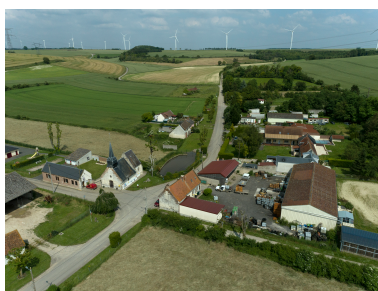
Vue aérienne du village depuis l'ouest.