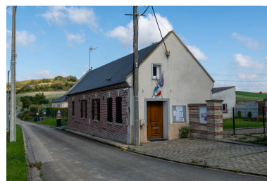
Mairie vue depuis le sud.