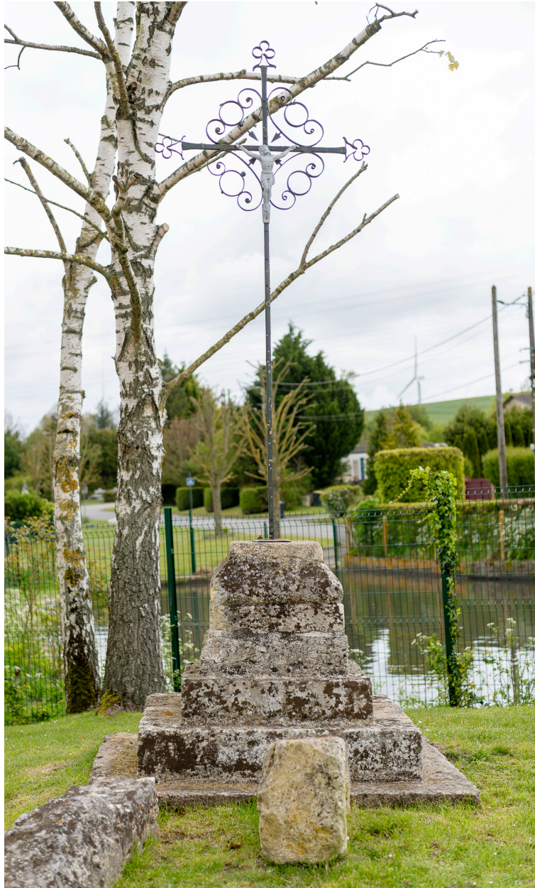
Croix de chemin près de l'église, vue depuis l'ouest.