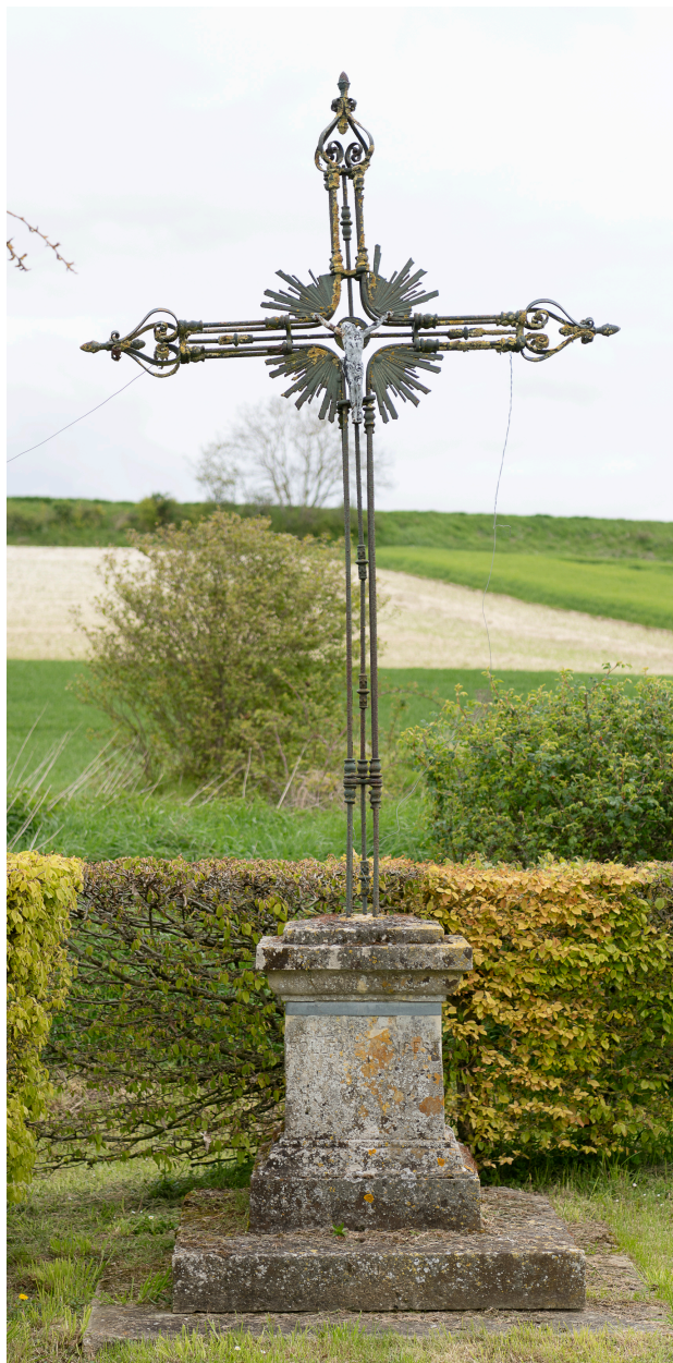
Croix de chemin de la route de Fransures au nord-est du village, vue depuis le sud.