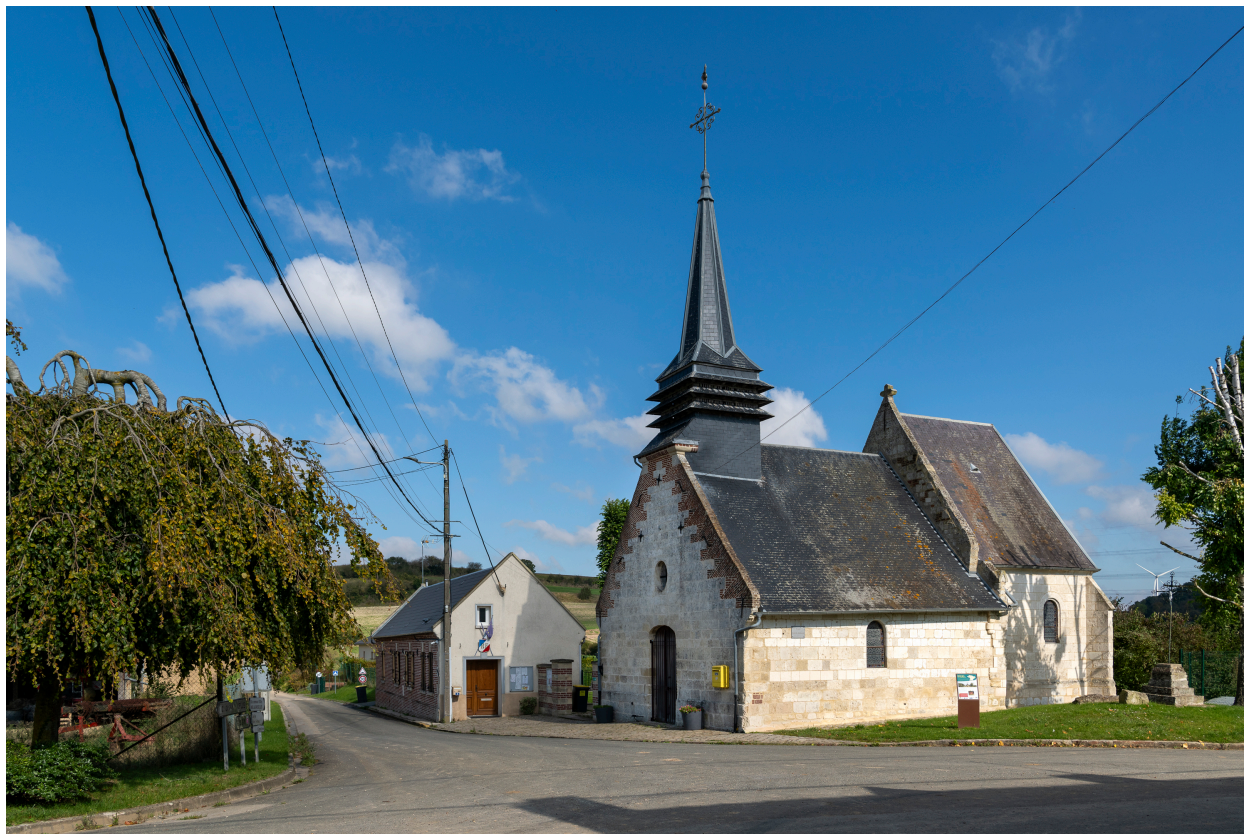
Carrefour du village avec église et mairie, vue depuis le sud.