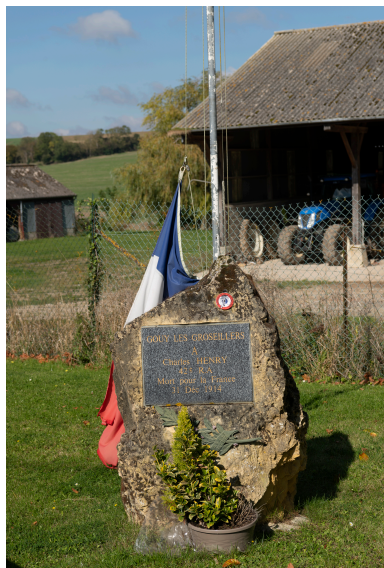
Monument aux morts pour la France. IVR32_20246000905NUCA