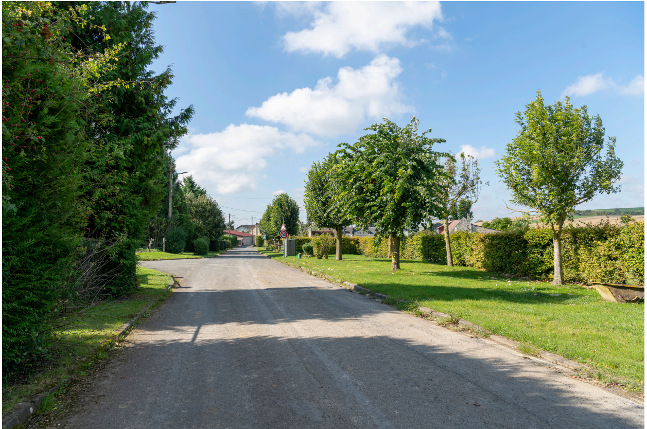
Entrée du village depuis l'est.