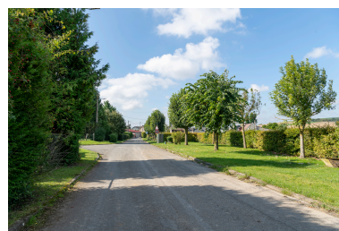
Entrée du village depuis l'est.