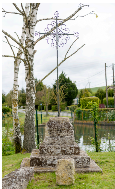
Croix de chemin près de l'église, vue depuis l'ouest. IVR32_20246000374NUCA