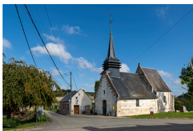
Carrefour du village avec église et mairie, vue depuis le sud.