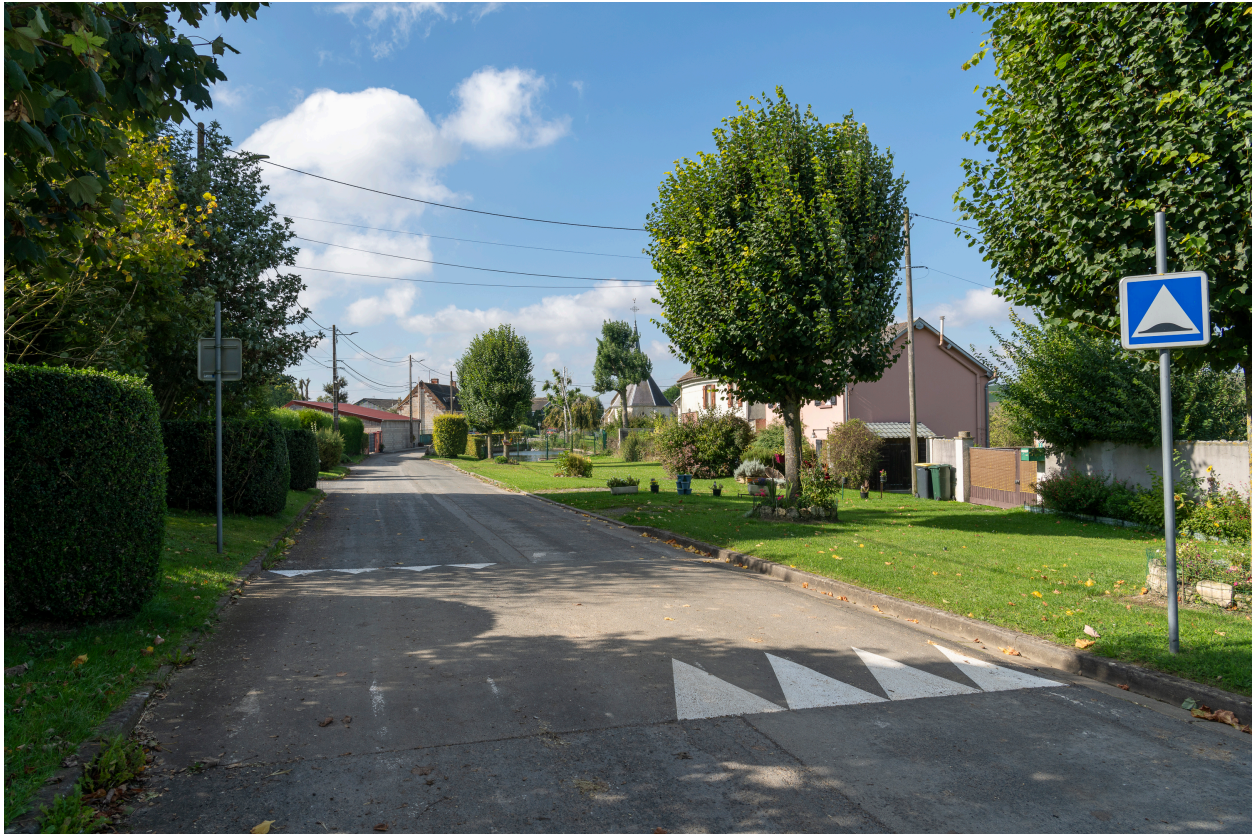
Rue des Moissons, vue depuis l'est.