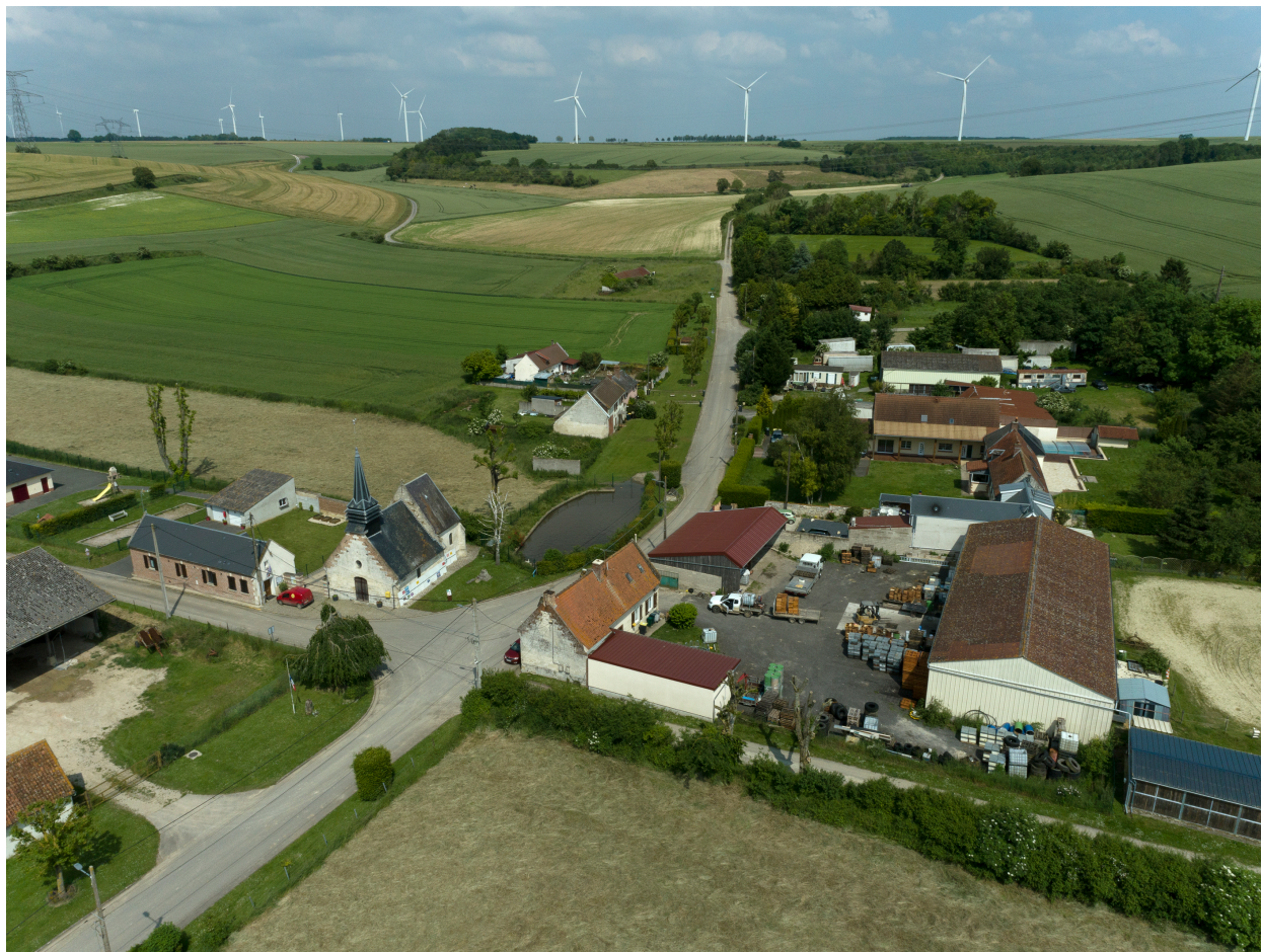
Vue aérienne du village depuis l'ouest.