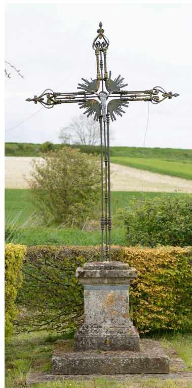
Croix de chemin de la route de Fransures au nord-est du village, vue depuis le sud. IVR32_20246000373NUCA