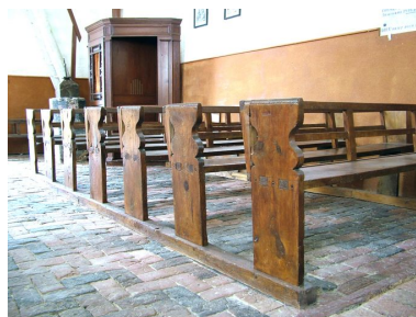
Vue des bancs de la partie nord de la nef, chêne, 19e siècle. IVR22_20108001302NUCA