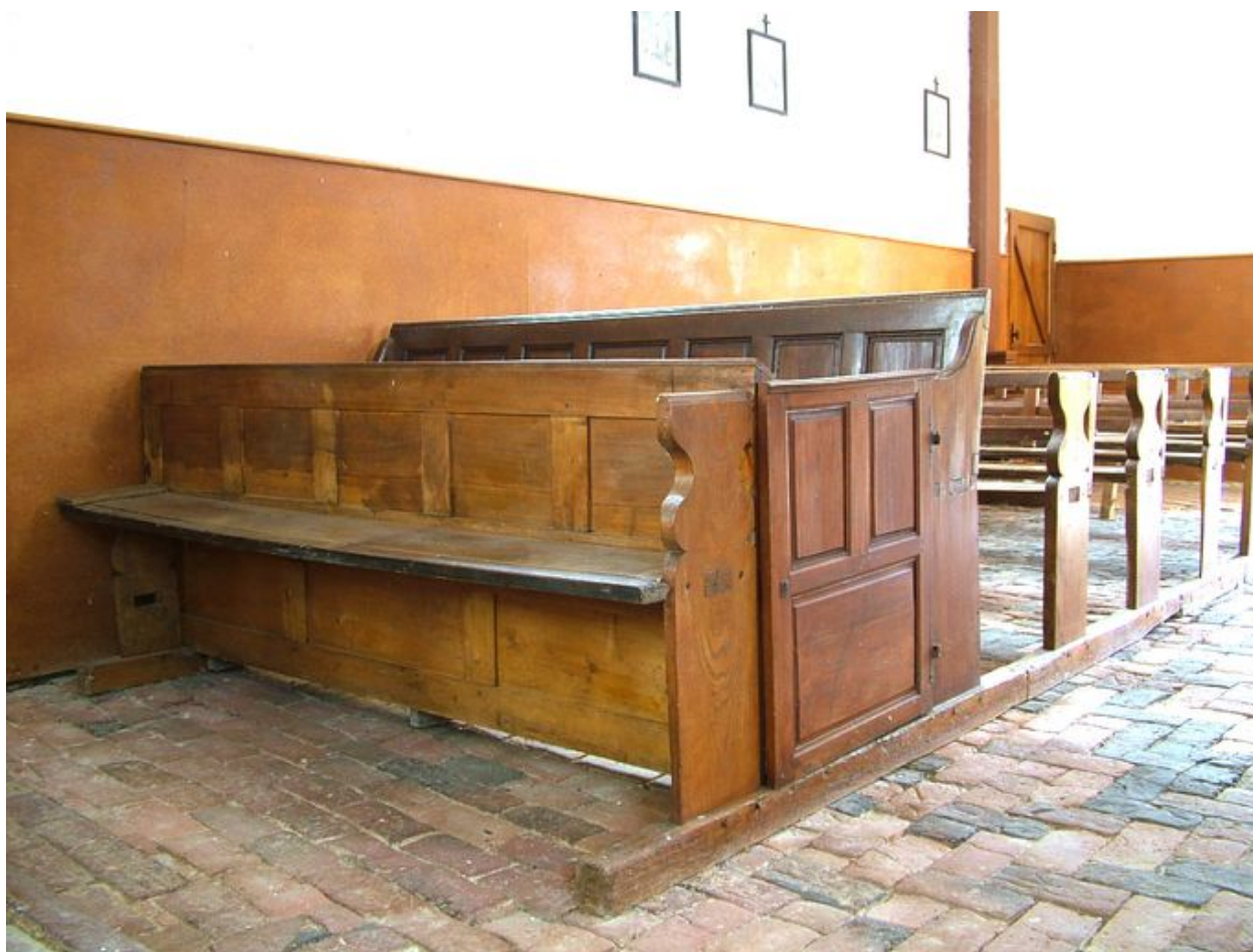
Vue des bancs de la partie sud de la nef, chêne, 19e siècle.