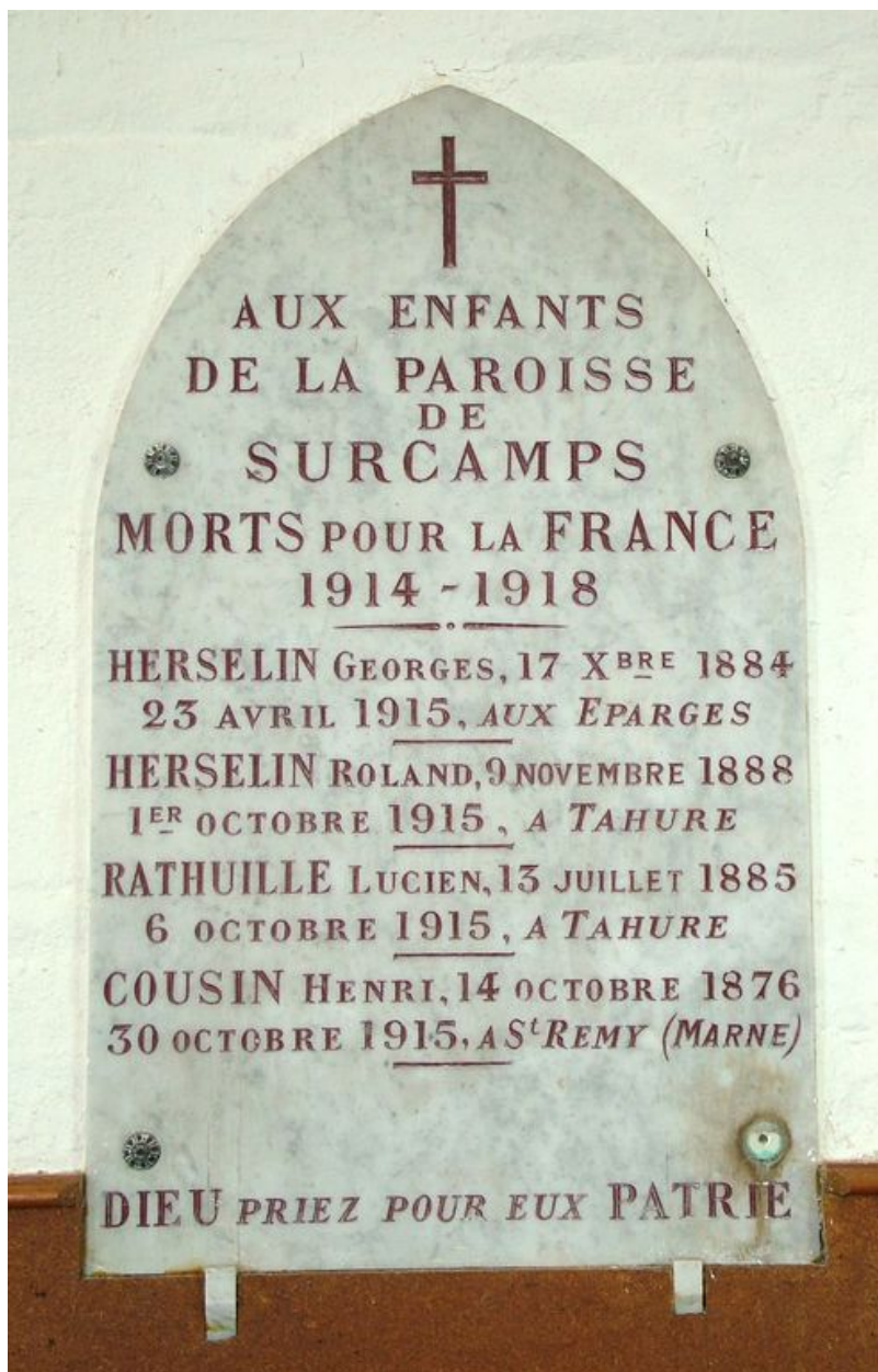
Tableau commémoratif des morts, marbre, années 1920.