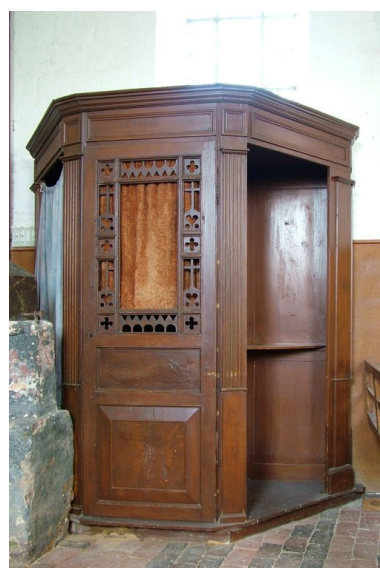
Confessionnal, chêne, milieu du 19e siècle. IVR22_20108001306NUCA