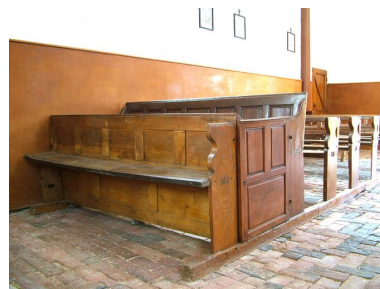
Vue des bancs de la partie sud de la nef, chêne, 19e siècle. IVR22_20108001303NUCA