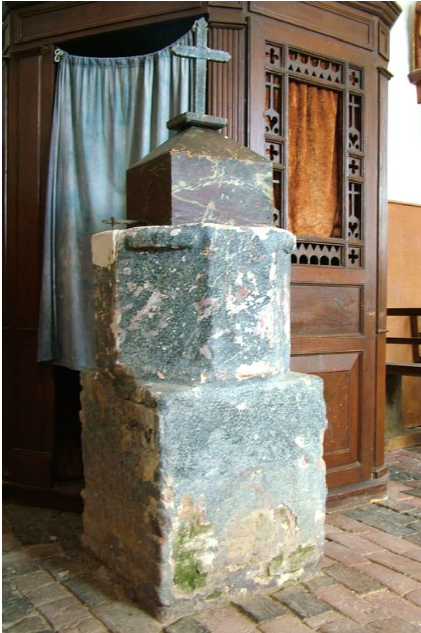
Fonts baptismaux, calcaire et brique, 17e (?) et 20e siècle.