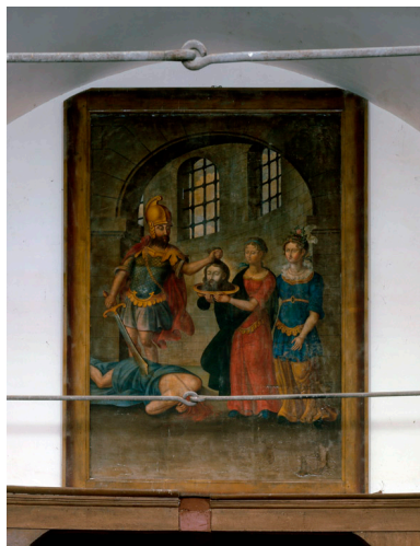
Vue générale. IVR22_20008000520VA