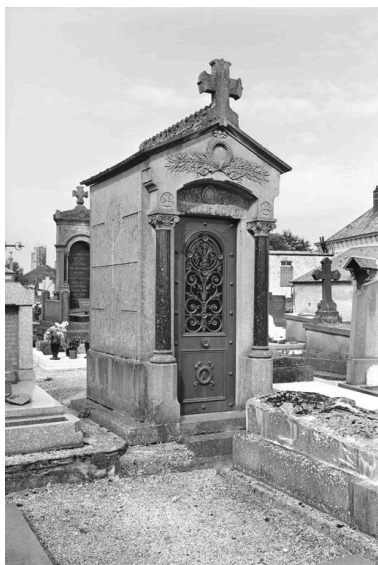
Vue d'ensemble.