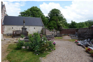
Vue générale du cimetière depuis l'entrée.