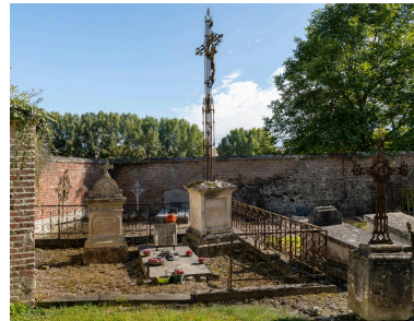
Enclos funéraire de la famille Langoisseur-Houpin- Desanglois et croix de cimetière. IVR32_20216001158NUCA