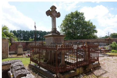
Tombeau de la famille Levoir-Roger, vers 1889.