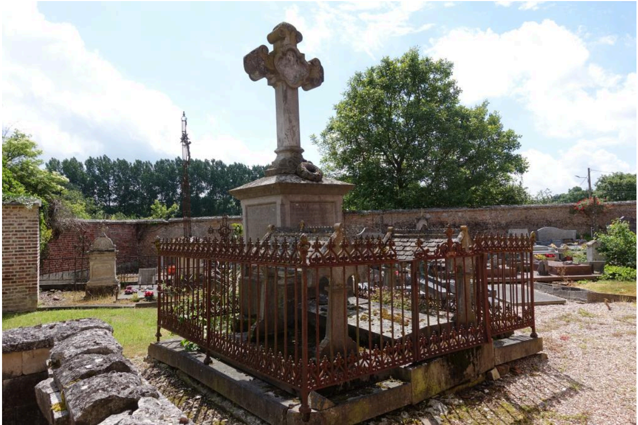
Tombeau de la famille Levoir-Roger, vers 1889.