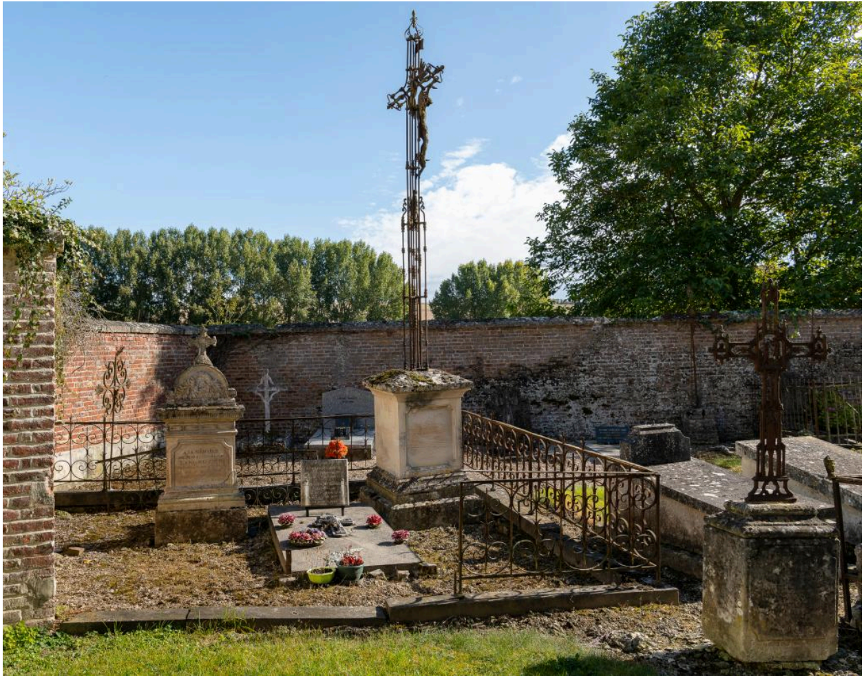
Enclos funéraire de la famille Langoisseur-Houpin-Desanglois et croix de cimetière.