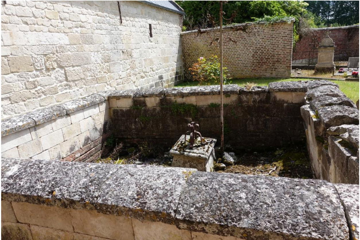
Enclos funéraire de la famille de Saisseval.