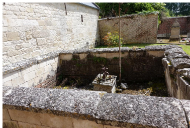
Enclos funéraire de la famille de Saisseval.