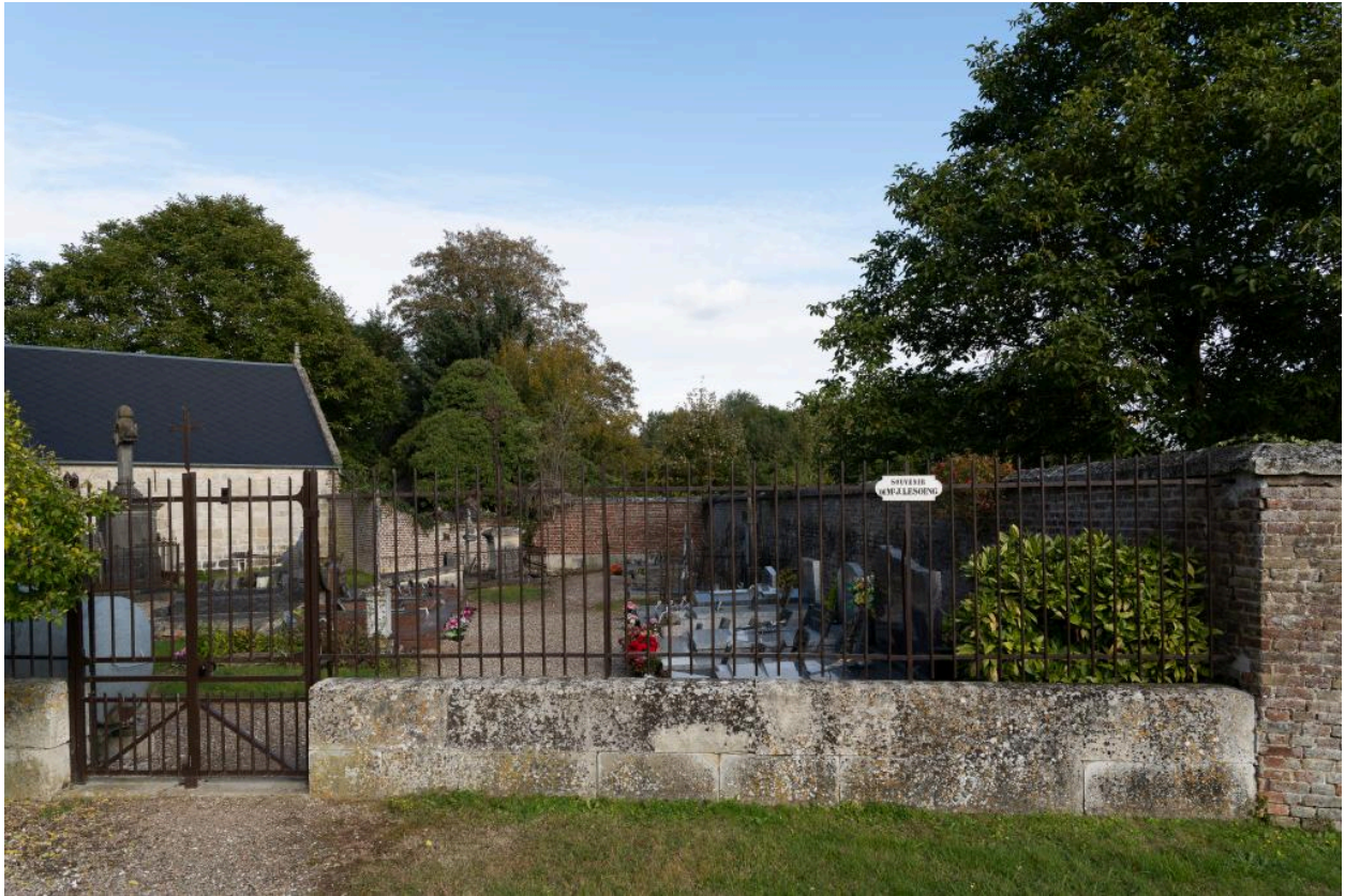
Vue générale du cimetière.