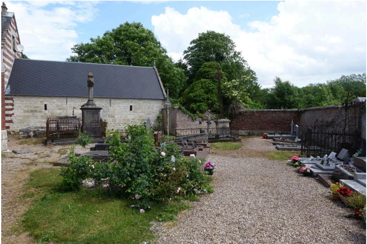
Vue générale du cimetière depuis l'entrée.