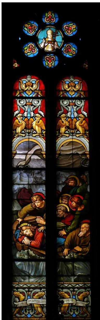
Baie 14. IVR22_20058001952NUCA