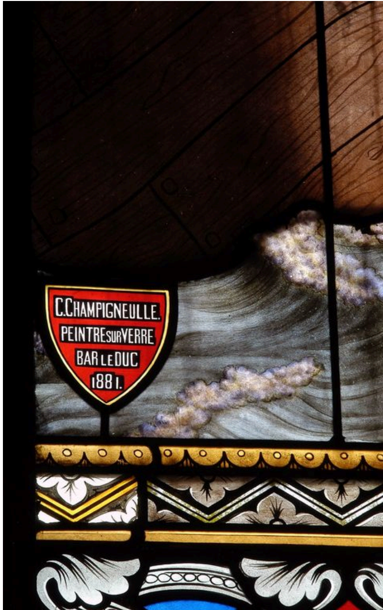
Baie 12 (détail) : signature.