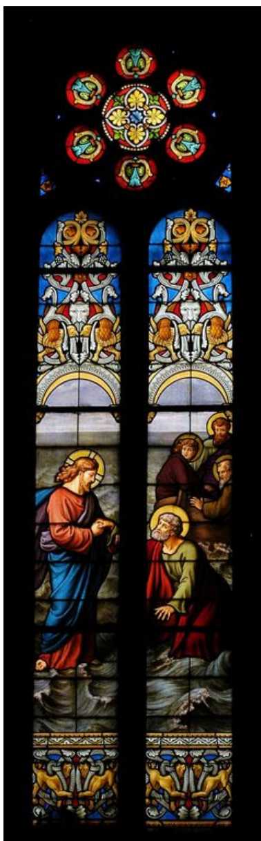
Baie 16.