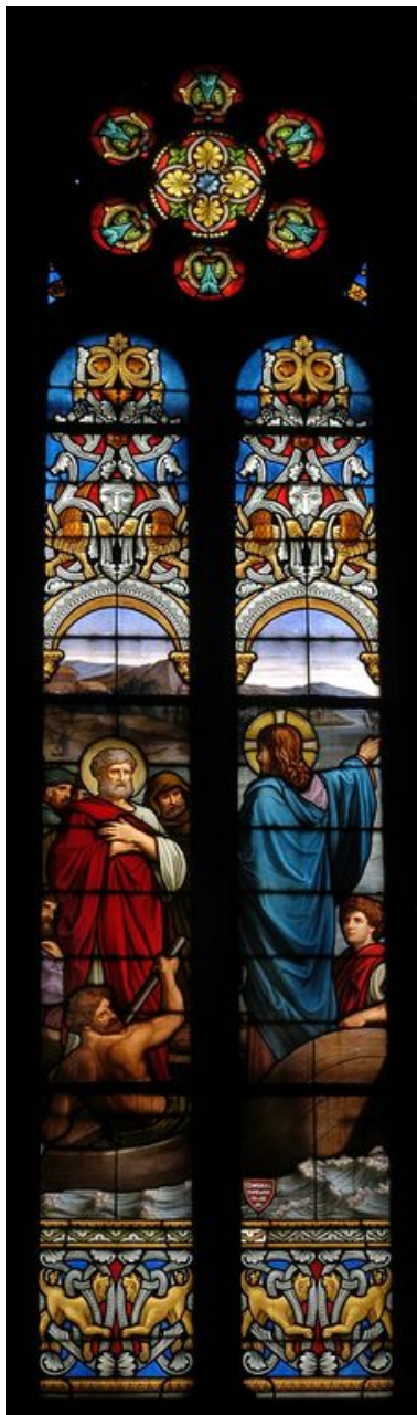
Baie 12. IVR22_20058001950NUCA