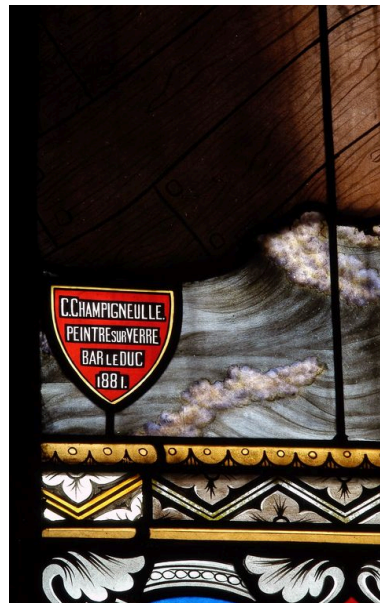
Baie 12 (détail) : signature. IVR22_20058001951NUCA