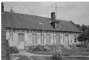
Logis. Élévation antérieure. IVR22_19846000960X

Plan de situation. Extrait du plan cadastral de 1982, section A5 611. IVR22_20096000012NUCA