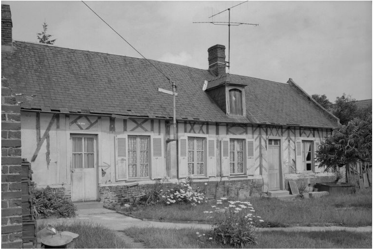
Logis. Elévation antérieure.