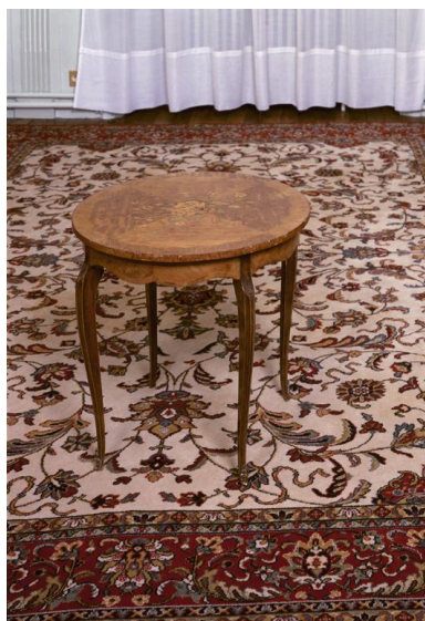
Vue d'ensemble. IVR22_20020200073XA