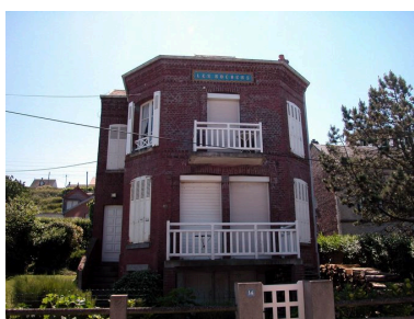
Vue d'ensemble, élévation sur mer.