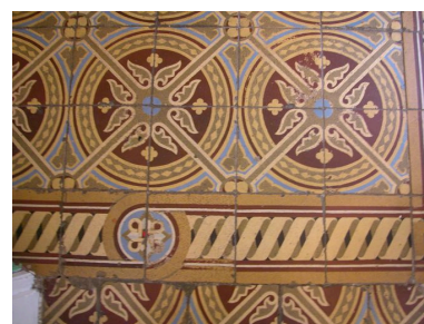
Détail des carreaux de sol du vestibule.