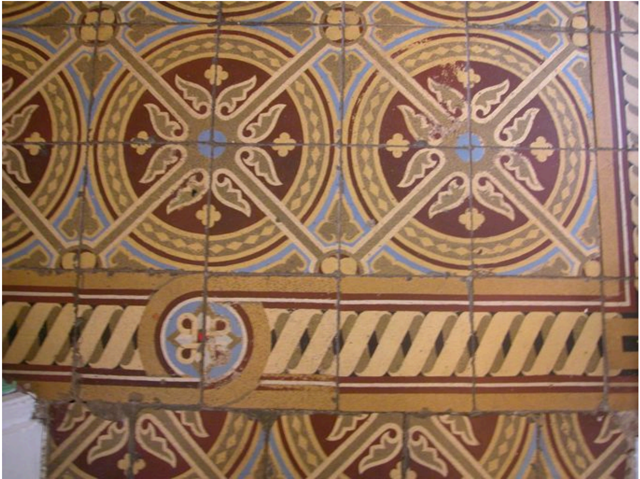
Détail des carreaux de sol du vestibule.