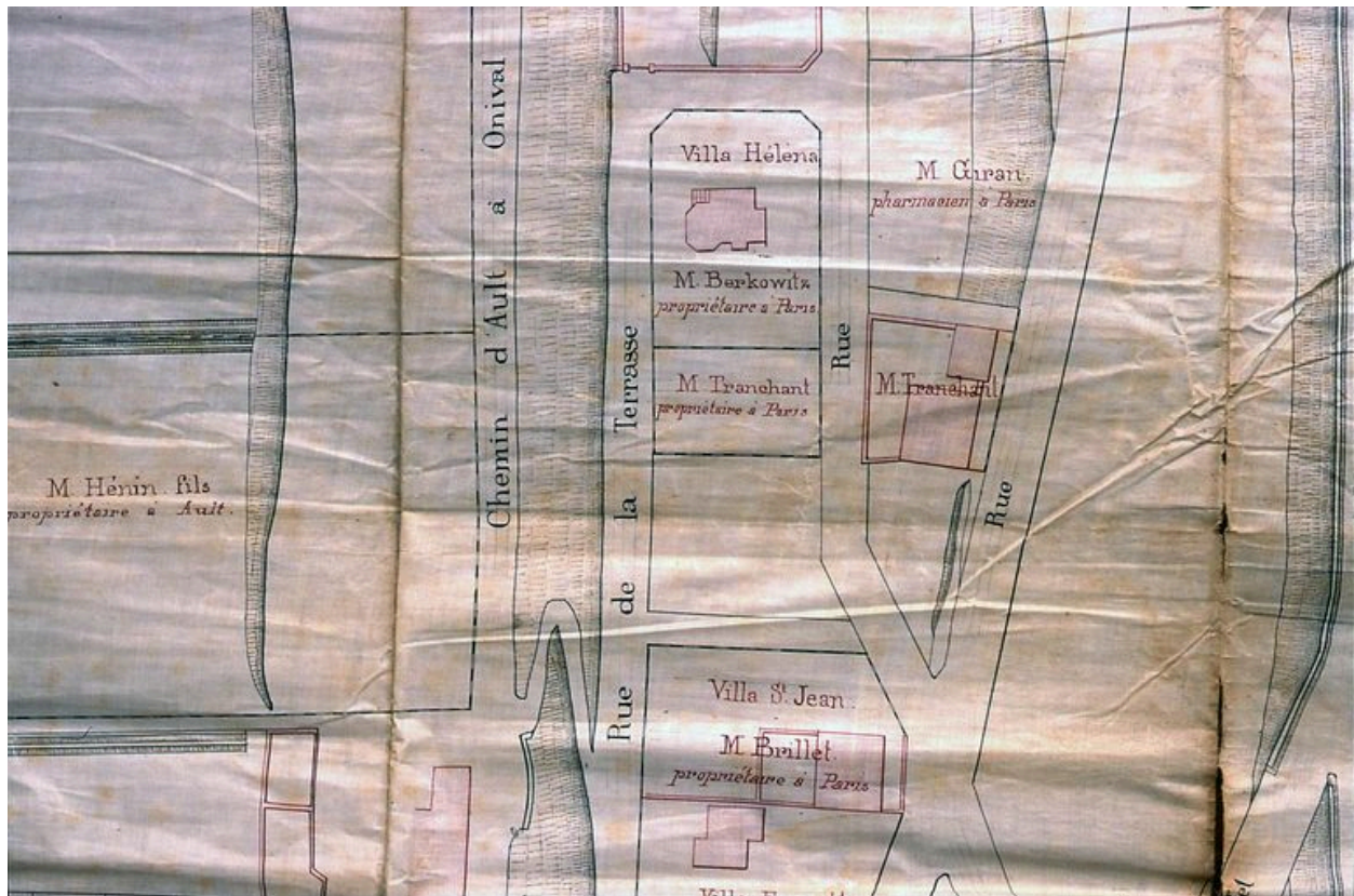
La villa Hélène, sur un plan datant de 1886.