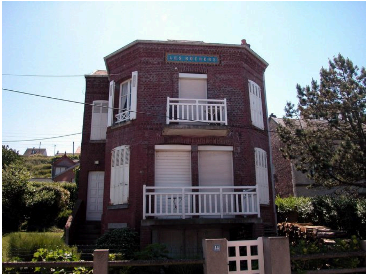
Vue d'ensemble, élévation sur mer.